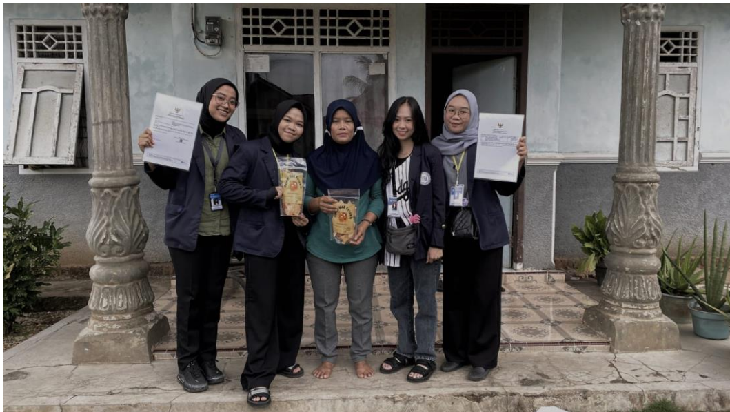
Gambar 1.1 Pembuatan Label/Stiker pada UMKM

Label/ Stiker merupakan media promosi yang berisi informasi yang menjadi informasi untuk orang banyak, sehingga dapat menarik minat para konsumen untuk mengenali sebuah produk. Pembuatan Label/Stiker pada UMKM Opak Mak Friska ini bertujuan agar UMKM rumahan ini lebih dikenal oleh masyarakat atau wisatawan yang berkunjung ke Desa Wonodadi.