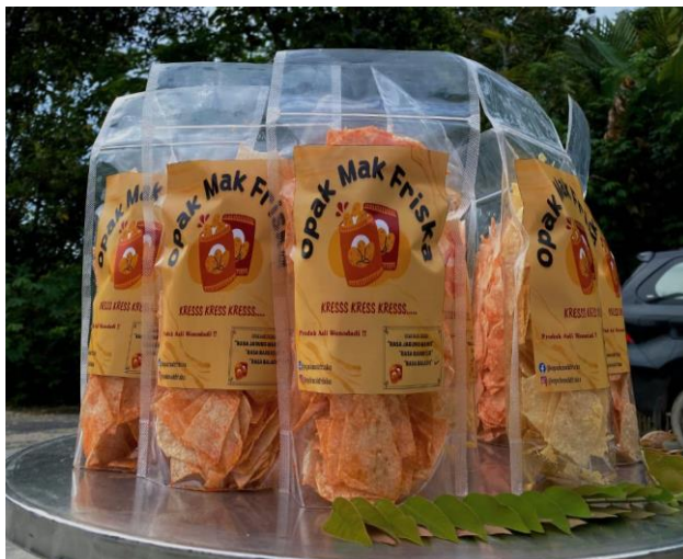
Gambar 1.2 Pengembangan inovasi rasa dan pengemasan Opak Modern