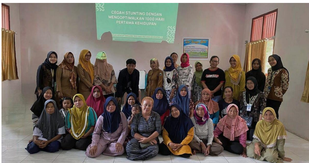
Gambar 1.4 Penyuluhan Stunting