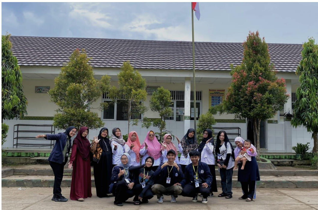
Gambar 1.5 Kegiatan Mengajar Dan Sosialisasi Di SDN 1 Wonodadi