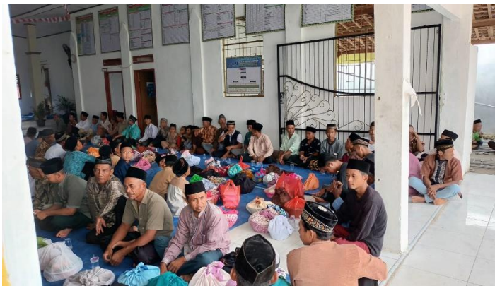
Gambar 2.8 Kegiatan menyambut Tahun Baru Islam

Tahun baru Islam ini tentu memiliki makna yang penuh arti dan merupakan suatu hari yang penting bagi umat muslim. Pasalnya, Tahun baru Islam menandai peristiwa penting yang terjadi dalam sejarah Islam yaitu memperingati penghijrahan Nabi Muhammad SAW dari kota Mekkah ke Madinah pada tahun 622 Masehi.