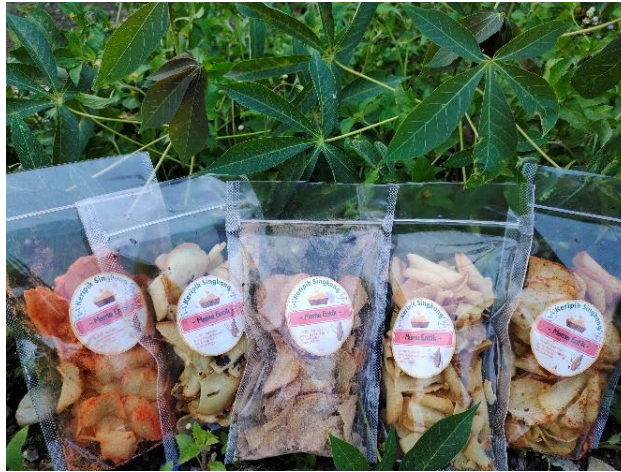
Gambar 2.2 Varian rasa keripik singkong Mama Entik

keinginan konsumen agar produk tersebut tetap menarik dimata konsumen agar konsumen tidak beralih ke produk lain. Inovasi mempunyai pengaruh kuat dalam meningkatkan kinerja UMKM. Saat ini UMKM keripik singkong Mama Entik memiliki beberapa varian rasa yaitu manis gurih, pedas gurih, coklat, rumput laut, dan balado.