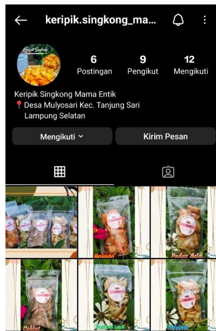
Gambar 2.4 Sosial media produk keripik singkong Mama Entik

dijalankan dengan skala cukup kecil, menentukan strategi promosi yang tepat tetap perlu dilakukan agar bisnis selalu berkembang. Salah satu contoh digital marketing adalah upaya pemasaran online dengan menggunakan internet seperti Facebook, WhatsApp, Instagram, dll dimana penjual bisa berkomunikasi dengan calon konsumen di dunia maya.