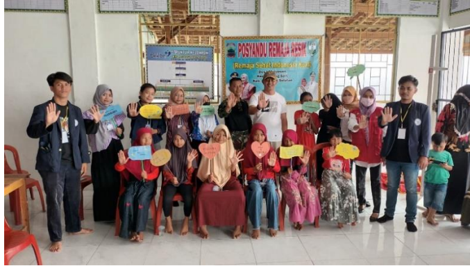
Gambar 2.7 Posyandu Remaja Resik Stop Stunting