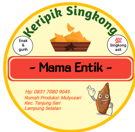
Gambar 2.3 Desain logo keripik singkong Mama Entik

Diharapkan dengan dibuatkan inovasi desain logo keripik singkong Mama Entik ini dapat meningkatkan daya tarik pada konsumen untuk membeli produk Mama Entik. Karna sebelumnya logo Mama Entik kurang menarik, karna kurangnya desain dan warna yang sesuai dengan UMKM tersebut. Untuk itu diberikan logo dengan warna kuning karna memiliki makna harapan dan kejayaan, serta diharapkan bisa meningkatkan nilai penjualan.