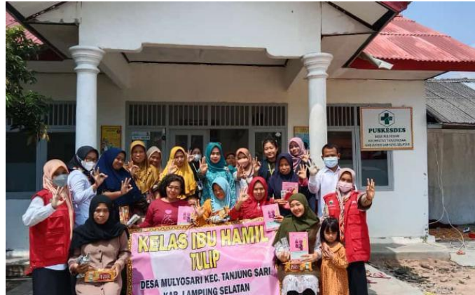
Gambar 2.9 Penyuluhan kelas ibu hamil

Kegiatan penyuluhan kelas ibu hamil ini dilakukan oleh petugas Kesehatan kecamatan Tanjung Sari yang diikuti oleh 15 orang ibu hamil. Pemberian materi dilaksanakan dengan metode diskusi.