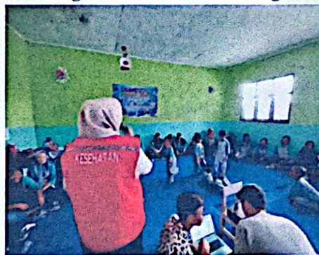
Gambar 2.1 Kegiatan Sosialisasi Stunting

Posyandu dapat mencegah anak terkena berbagai faktor risiko stunting melalui program-program yang diselenggarakan. Beberapa program Posyandu sebagai upaya pencegahan stunting adalah pemberian vitamin A, penanggulangan diare, sanitasi dasar serta peningkatan gizi Posyandu bukan hanya terkait vaksinasi. Namun, di Posyandu juga bisa dimanfaatkan untuk memantau tumbuh kembang anak seperti mengukur berat badan, tinggi badan, dan lingkar kepala anak diukur untuk mendeteksi sejak dini jika terjadi hal-hal yang tidak diinginkan seperti kekurangan gizi.