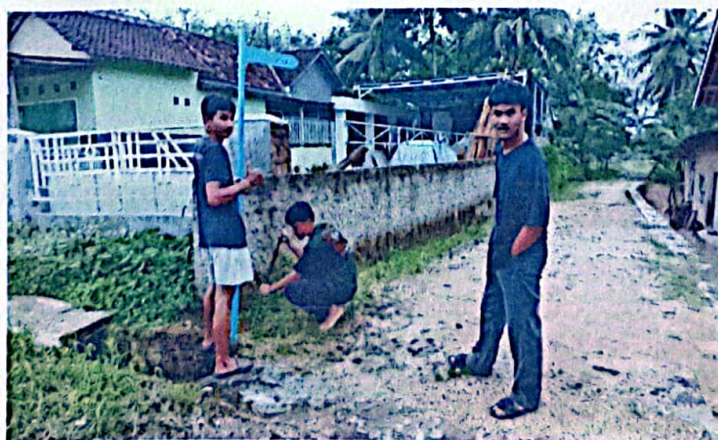
Proses Pemasangan Papan Nama Jalan