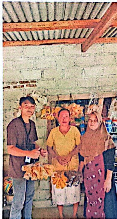
Pengantaran Keripik Pisang Kepada Konsumen