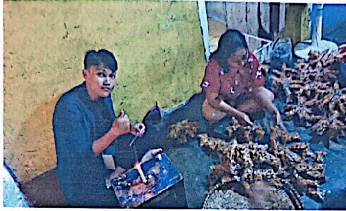
Proses Pengemasan Keripik Singkong