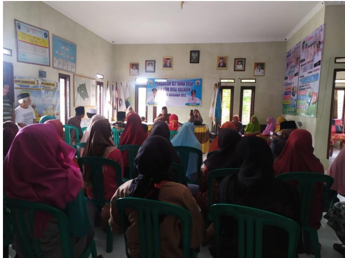
Gambar 12. Membantu Pembagian BLT Lansia Di Balai Desa