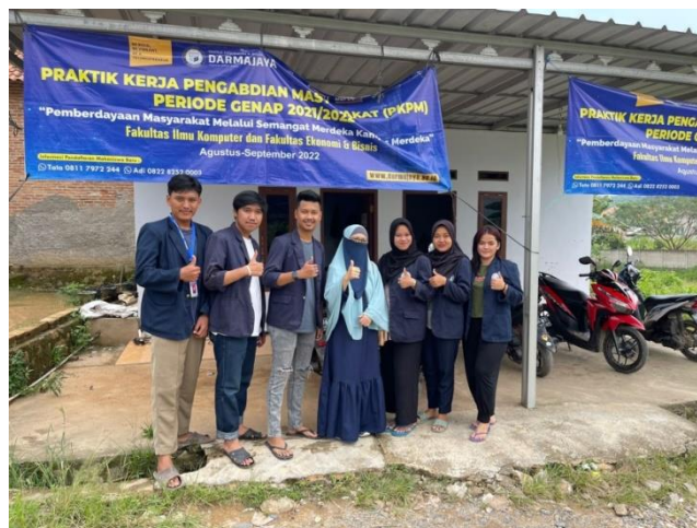
Gambar 15. Kunjungan DPL ke posko