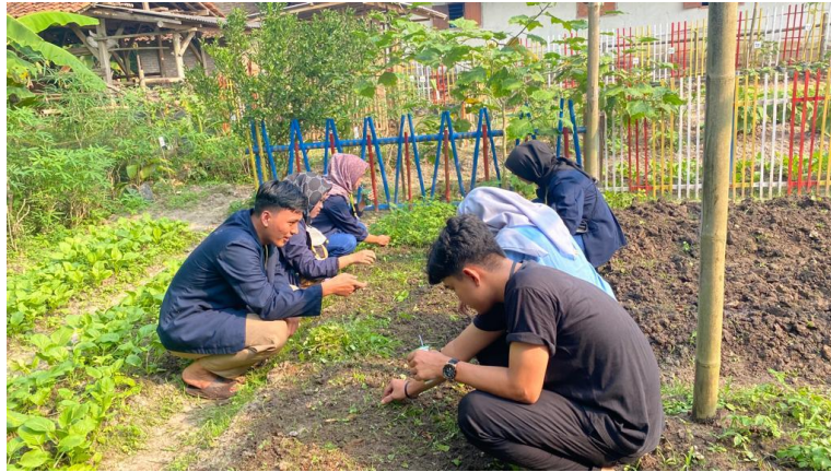
Gambar 7. Membantu kegiatan Ibu-Ibu PKK di Taman Toga