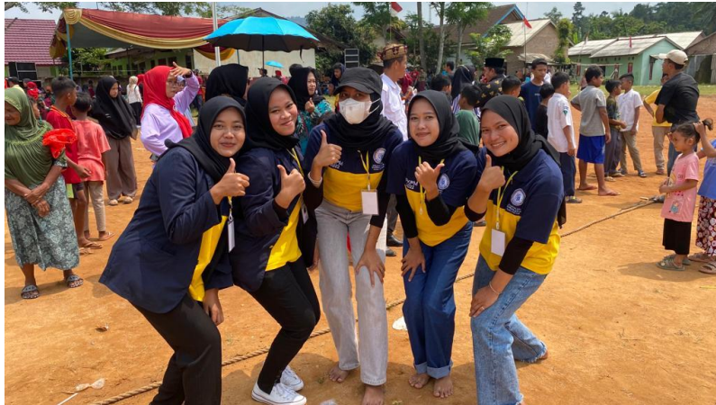
Gambar 14. Memeriahkan HUT RI ke 77