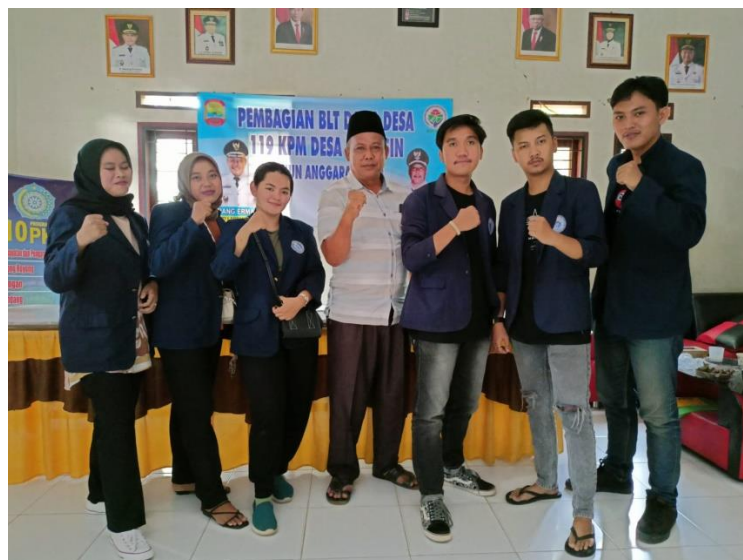
Gambar 6. Permohonan izin pelaksanaan PKPM di Balai Desa