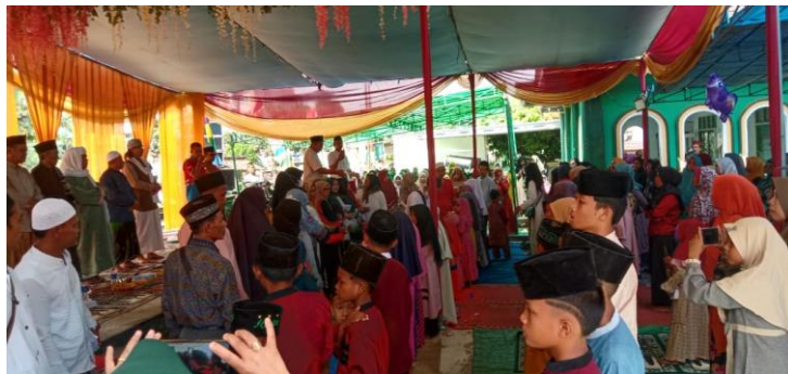
Gambar 11. Kegiatan Santunan Anak Yatim