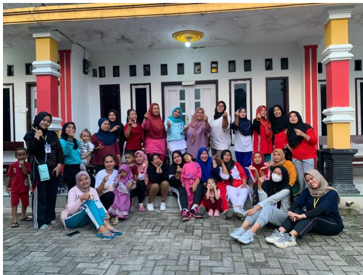
Gambar 8. Senam Sehat Desa Kaliasin