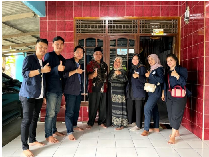
Gambar 5. Permohonan izin pelaksanaan PKPM kepada kepala desa