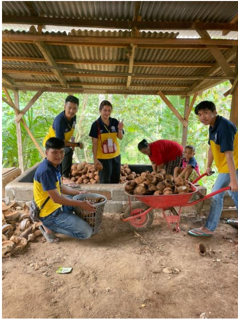
Gambar 10. Membantu kegiatan produksi di UMKM Korang