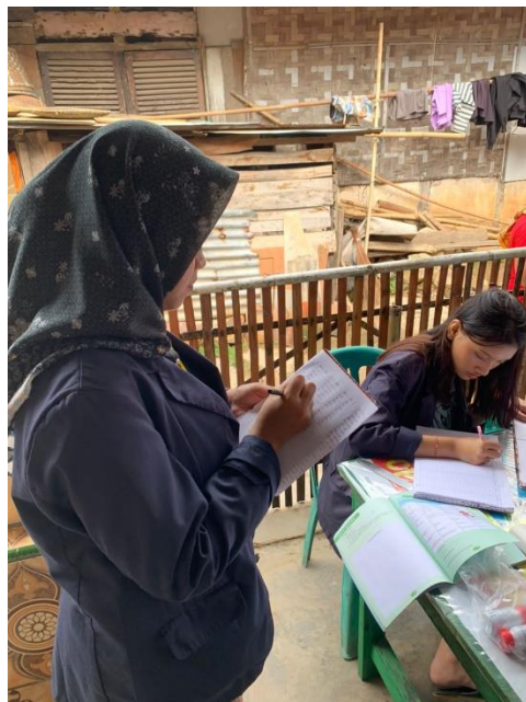
Gambar 13. Kegiatan Posyandu Balita