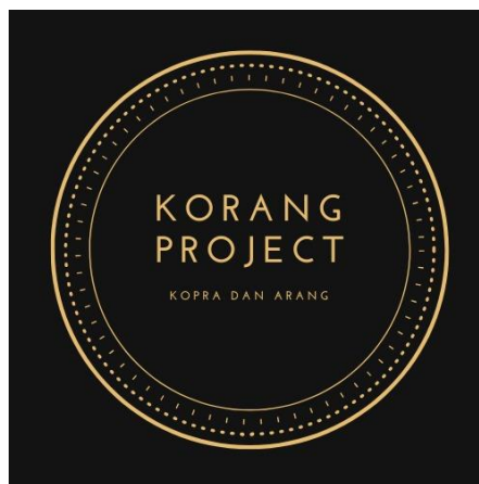
Gambar 9. Logo UMKM Korang