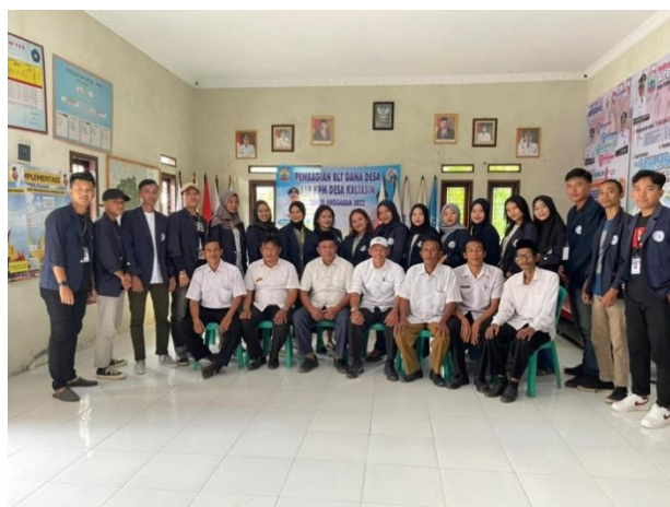
Gambar 16. pelepasan mahasiswa pkpm di balai desa Kaliasin