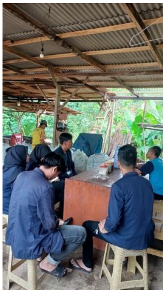
Gambar 2. Survey lokasi dan membantu proses produksi UMKM Kopra

Selama PKPM berlangsung, kami mengunjungi UMKM kopra dan arang dan ikut serta dalam proses pembuatan kopra dan arang dari tahap awal sampai dengan tahap akhir serta membantu membuat pembukuan keuangan secara digital, logo dan merek untuk kopra dan arang dan mengedukasi pemilik UMKM tentang penggunaan media sosial.