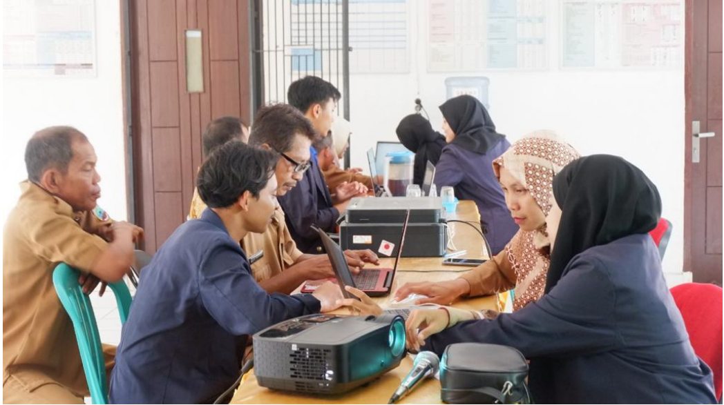
Pelatihan Dasar Microsoft Word kepada Aparatur Desa