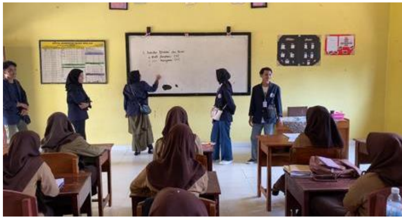
Penyampaian Materi Morivasi Belajar