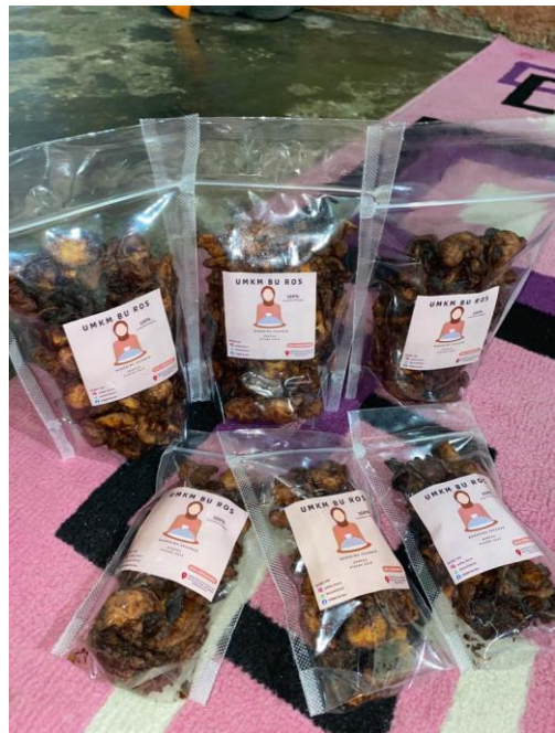
Inovasi produk pisang salai