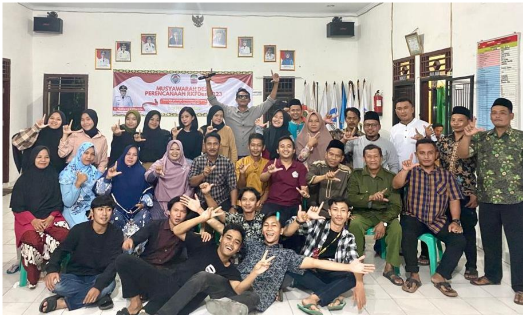
Pemberian plakat dan acara perpisahan dengan desa