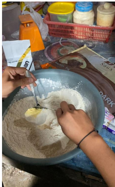
Proses Pencampuran Bahan Bakpao