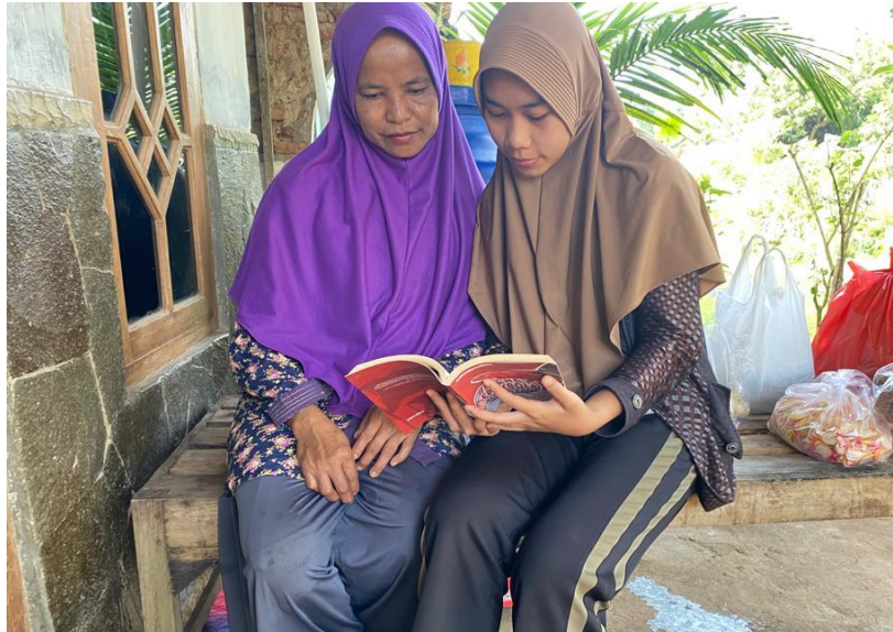
Sosialisasi pembukuan sederhana kepada UMKM Kue Bakpao