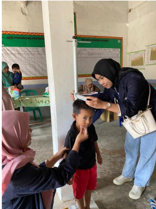
Membantu Posyandu Mengukur Tinggi Badan Anak