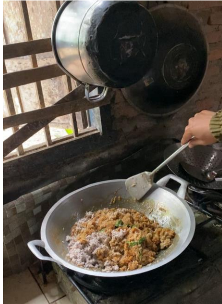
Proses Pembuatan Isi Bakpao