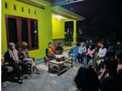
Gambar 1 (Mengunjungi Balai Desa dan rumah Bapak Kepala Desa)