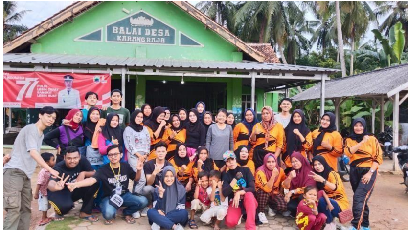
Gambar 2.17 Dokumentasi kegiatan senam bersama ibu-ibu di desa Karang Raja

Kegiatan senam rutin di desa Karang Raja diadakan secara rutin setiap 1 minggu sekali. Kegiatan ini diikuti oleh ibu-ibu di desa Karang Raja yang dilakukan di balai desa Karang Raja.