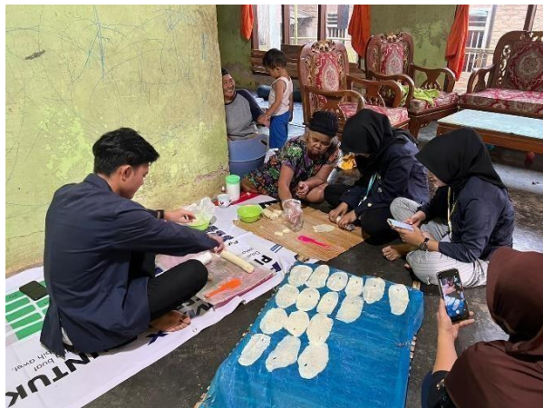
Gambar 2.23 Membantu proses produksi di UMKM Klanting

Proses produksi di UMKM Klanting sekaligus belajar bagaimana proses pembuatan klanting.