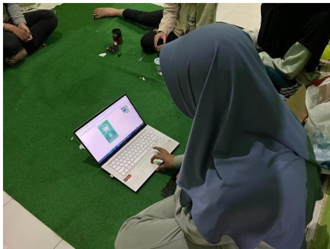
Gambar 2.21 Dokumentasi pembuatan logo UMKM Klanting

20. Pembuatan logo UMKM Klanting, Pelatihan pembukuan keuangan UMKMKegiatan ini merupakan perkembangan dari tahap sebelumnya yaitu pembuatan logo yang akan di letakkan pada kemasan produk. Dan juga pelatihan pembukuan keuangan sederhana untuk UMKM.