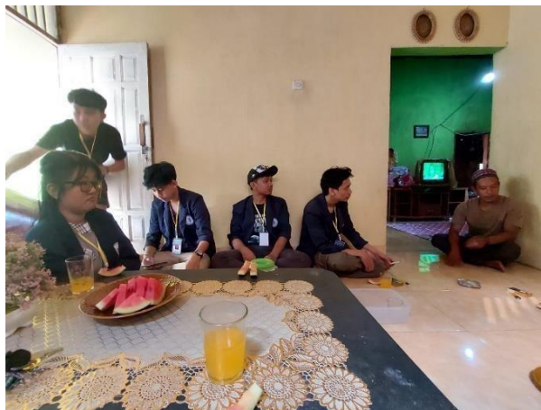
Gambar 2.2 Dokumentasi kunjungan ke rumah kepala dusun

Kunjungan ke rumah kepala dusun yang ada di desa Karang Raja untuk silaturahmi sekaligus memperkenalkan diri.