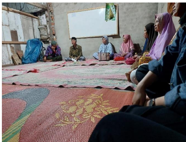
Gambar 2.4 Dokumentasi pengajian di Desa Karang Raja