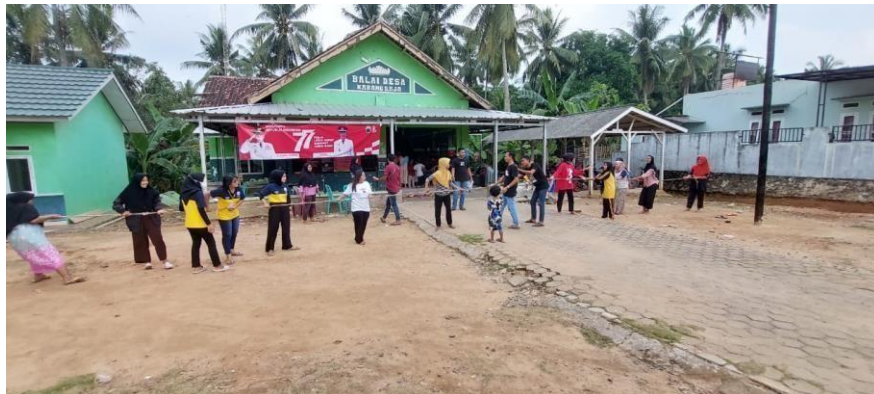
Gambar 2.12 Dokumentasi kegiatan perlombaan HUT RI di dusun Suka Jaya