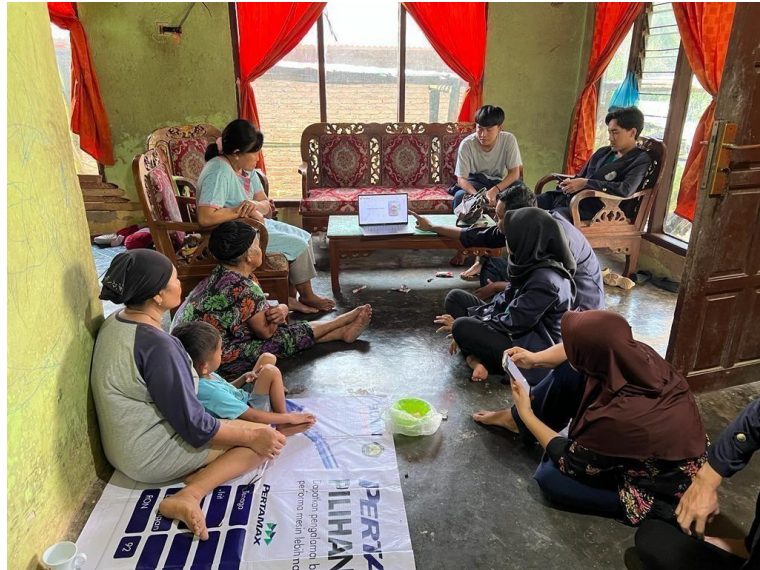
Gambar 2.19 Dokumentasi pengenalan logo dan kemasan kepada UMKM Klanting

Kegiatan ini bertujuan untuk mengetahui kondisi UMKM sekaligus memberikan beberapa inovasi pada produk yang dihasilkan, seperti pengenalan logo dan kemasan serta promosi melalui media sosial.