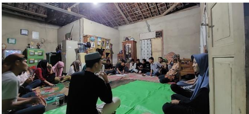
Gambar 2.10 Dokumentasi rapat panitia peringatan HUT RI