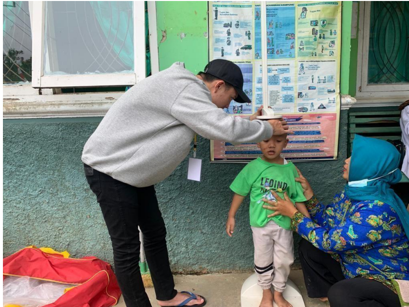
Gambar 2.9 Dokumentasi kegiatan posyandu balita

Kegiatan posyandu balita di desa Karang Raja dilakukan secara rutin setiap 1 bulan sekali. Maka kami bekerja sama dengan puskesmas kecamatan Merbau Mataram dalam kegiatan posyandu ini.