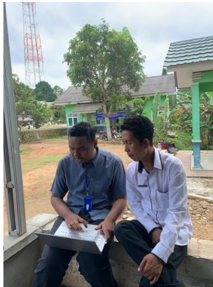
Gambar 2.14 Dokumentasi wawancara kepada aparatur desa

Tahap 1 dalam membuat sistem informasi desa adalah mengumpulkan informasi terkait desa Karang Raja dengan melakukan wawancara kepada aparatur desa.