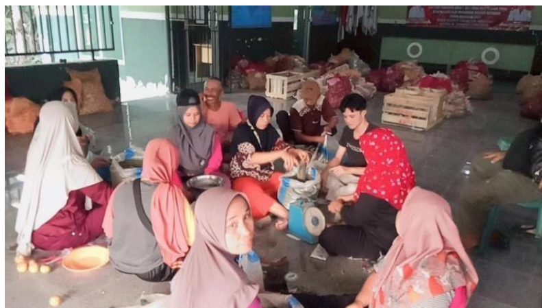
Gambar 2.6 Dokumentasi pengemasan sembako