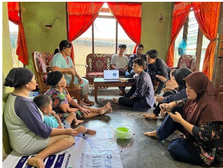
Gambar 2.20 Dokumentasi promosi melalui media sosial kepada UMKM Klanting