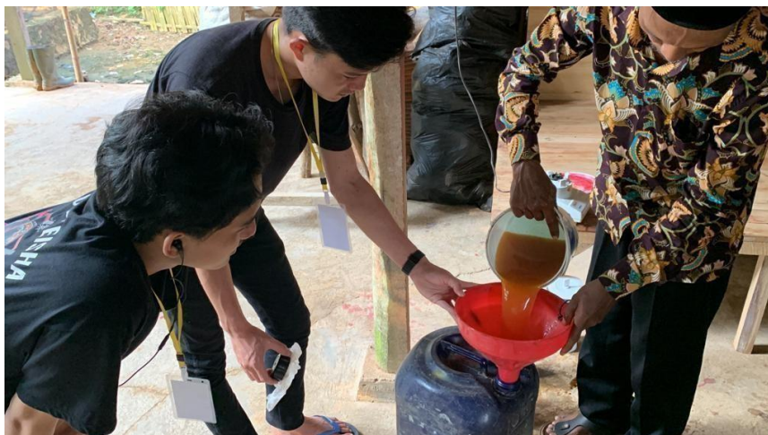
Gambar 2.15 Dokumentasi proses pembuatan pupuk organik cair

Di desa Karang Raja tepatnya di dusun Talang Mainal terdapat warga yang membuat pupuk organik cair yang terbuat dari limbah rumah tangga.