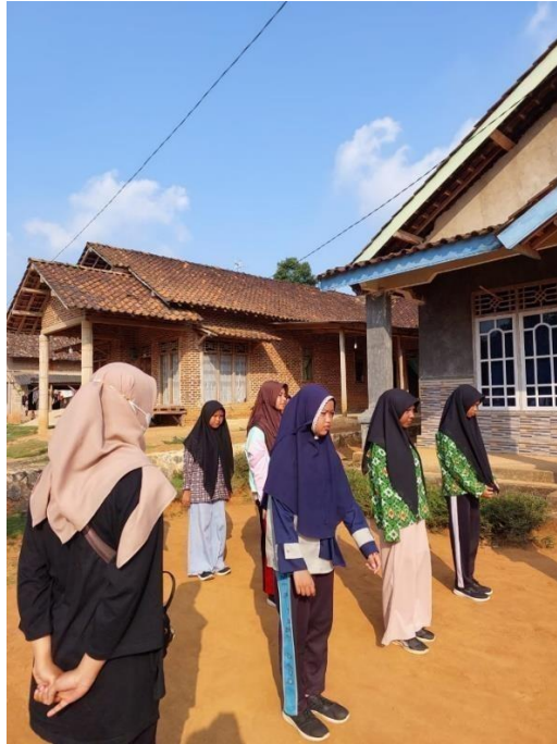
Gambar 2.3 Dokumentasi membantu latihan paskibra