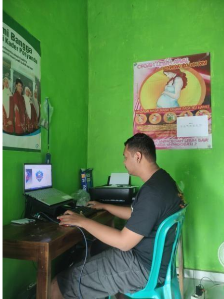
Gambar 2.7 Dokumentasi pembuatan logo tim sepakbola

Tim sepakbola Karang Raja sudah terbentuk sejak tahun 2005, tetapi belum memiliki logo yang resmi. Sehingga kami membantu proses pembuatan logo tim sepakbola untuk desa Karang Raja sehingga memiliki logo yang resmi.