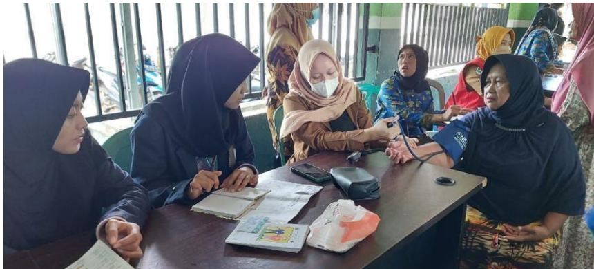
Gambar 2.8 Dokumentasi kegiatan posyandu lansia

Kelompok PKPM desa Karang Raja bekerja sama dengan puskesmas kecamatan Merbau Mataram dalam kegiatan posyandu lansia di desa Karang Raja.