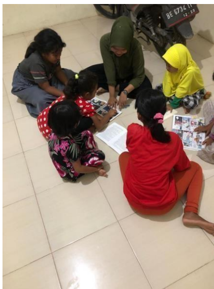
Gambar 2.18 Dokumentasi kegiatan mengajar les untuk anak-anak didusun Suka Jaya

Mengajar les dilakukan demi membantu proses pembelajaran bagi anak-anak di dusun Suka Jaya.