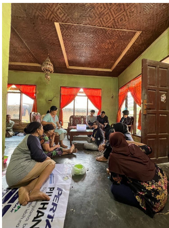
Gambar 2.22 Dokumentasi pelatihan pembukuan keuangan untuk UMKM Klanting