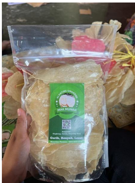
Gambar 2.24 Membantu pengemasan produk dan logo pada UMKM Klanting

Pengemasan produk dan logo pada UMKM Klanting Mak Munah.