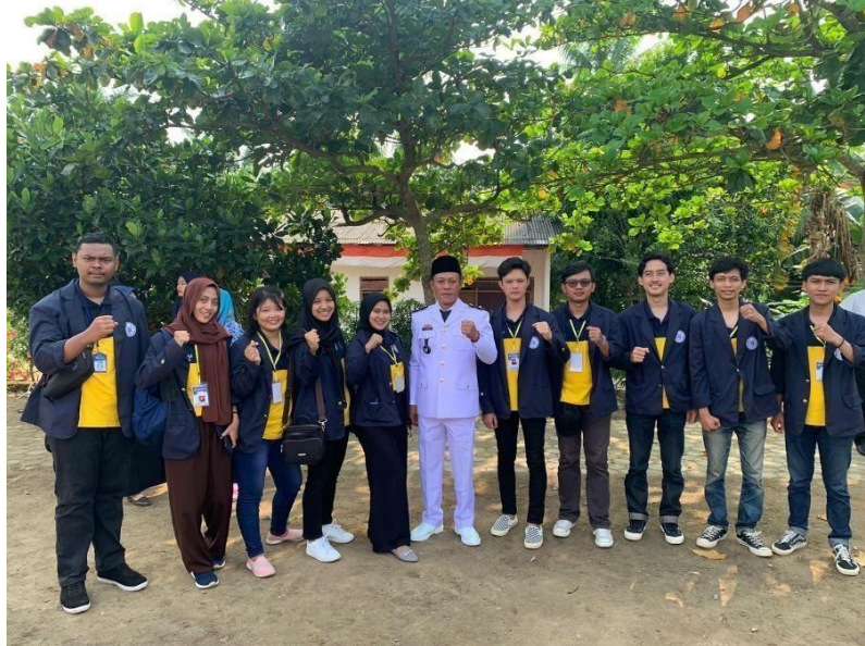
Gambar 2.11 Dokumentasi bersama kepala desa Karang Raja setelah upacara bendera