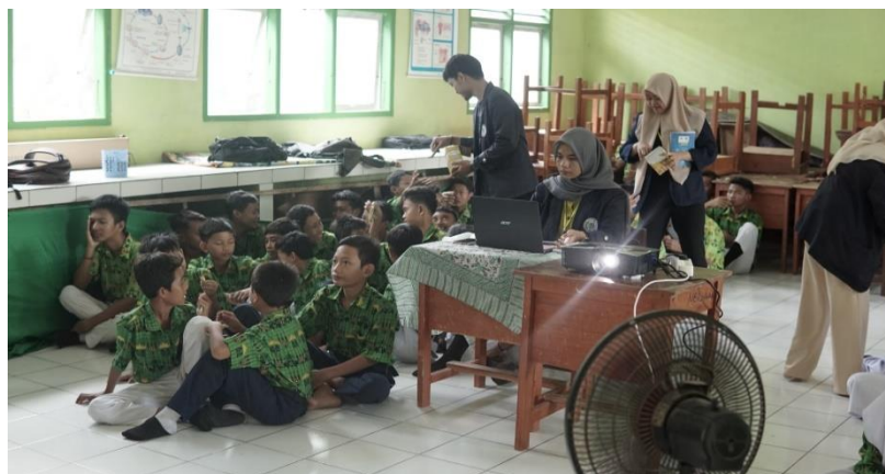
Gambar 2.16 Sosialisasi di SMP Purnama