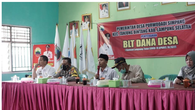
Gambar 2.13 Pembagian BLT dan Vaksinasi Covid-19