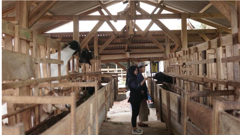
Gambar 2.17 Kunjungan ke peternakan kambing BUMDes

Desa Purwodadi Simpang memiliki BUMDes yang mengelola peternakan kambing.