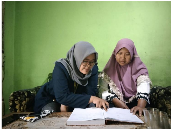
Gambar 2.6 Pelatihan Laporan Keuangan Kepada Pemilik Deki Cake

menunjukkan posisi keuangan entitas tersebut pada akhir periode tersebut.