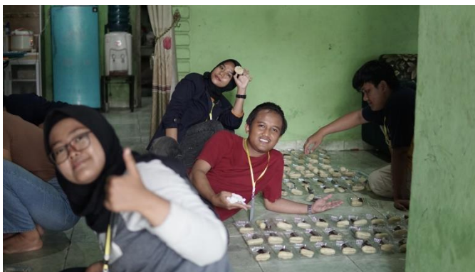
Gambar 2.10 Proses Packing UMKM Deki Cake