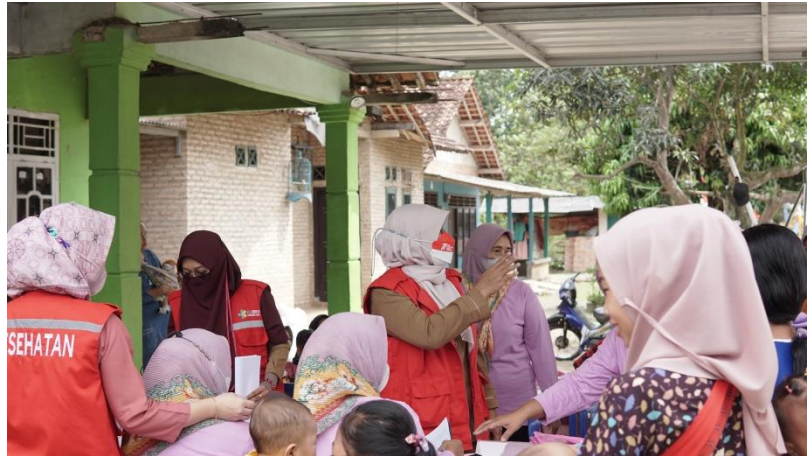
Gambar 2.14 Kegiatan gizi stunting