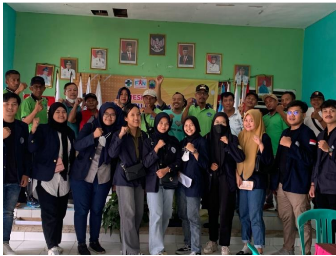
Gambar 2.8 Survey

Survey dilakukan dengan tujuan agar kegiatan PKPM selama satu bulan dapat berjalan dengan baik dan tepat sasaran berdasarkan potensi yang ada. Selama melakukan survey saya pastinya juga mengunjungi balai desa Purwodadi Simpang untuk menyerahkan surat izin pelaksanaan PKPM serta meminta arahan dan dukungan untuk satu bulan kegiatan.