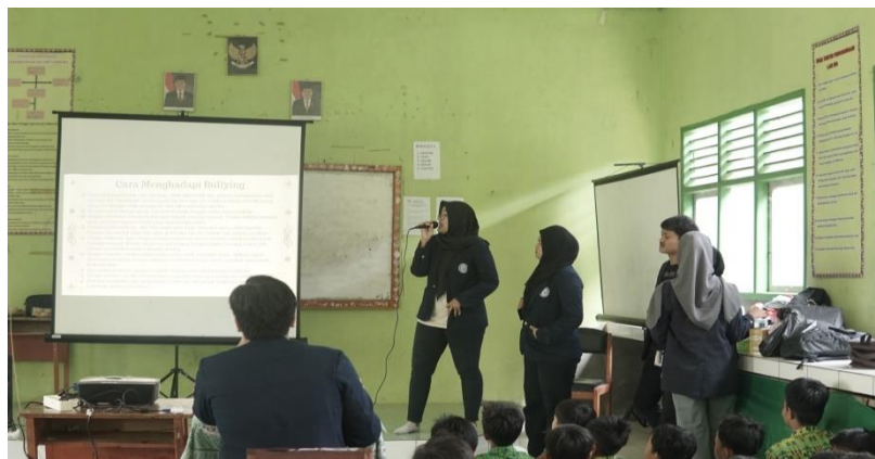
Gambar 2.15 Kegiatan Sosialisasi di SMP Purnama

Sosialisasi di SMP Purnama bertujuan untuk mengedukasi siswa/i akan dasar-dasar kegunaan komputer dan bahayanya bullying.