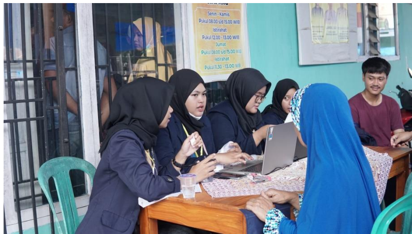
Gambar 2.12 Vaksinasi Covid-19 dan Pembagian BLT