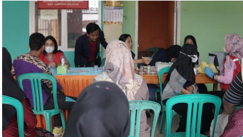
Gambar 2.11 Vaksinasi Covid-19