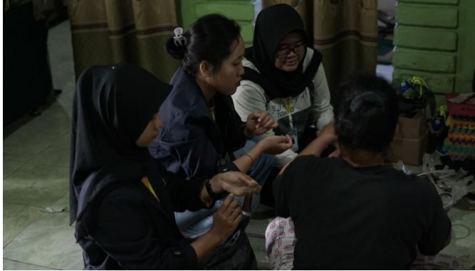
Gambar 2.9 Proses Produksi UMKM Deki Cake