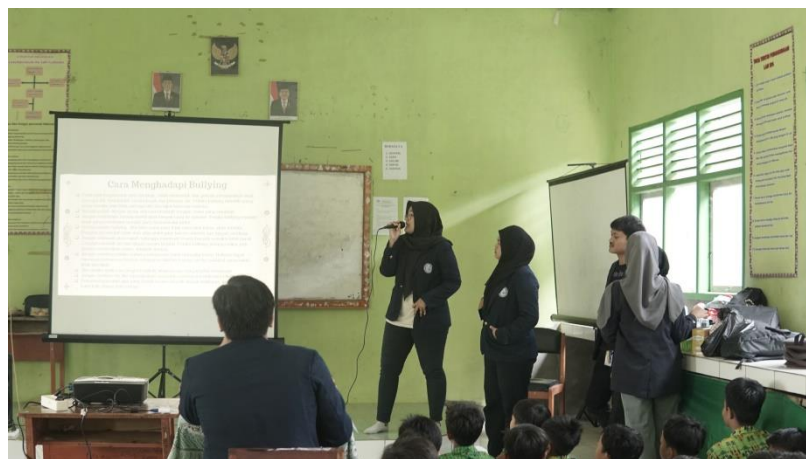
Gambar 2.7 Sosialisasi di SMP Purnama

Sosialisasi ini dilakukan untuk memberikan edukasi kepada murid yang ada di SMP Purnama akan apa saja yang termasuk bullying dan seberapa berbahaya apa bullying di lingkungan sekolah maupun lingkungan luar. Selain itu, murid SMP Purnama juga dikenalkan dengan perangkat komputer serta kegunaan Microsoft yang cukup berguna di lingkungan sekolah.