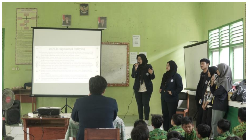
Gambar 2.5 Sosialisasi Edukasi di SMP Purnama