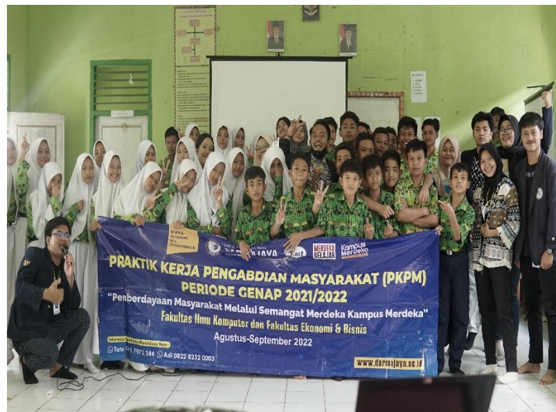
Gambar 2.8 sosialisasi SMP Purnama

Sosialisasi ini dilaksanakan di SMP Purnama, materi pada sosialisasi ini yaitu tentang Stop Bullying dan juga Pengenalan Dasar-dasar computer.