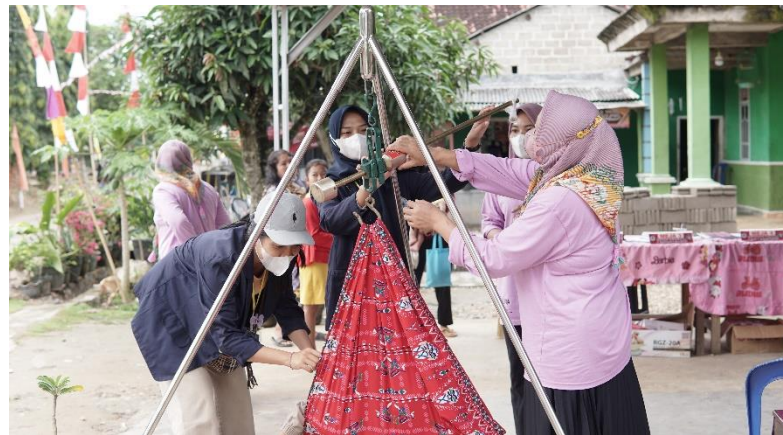
Gambar 2.11 posyandu gizi stanting balita

Posyandu yang diadakan oleh tenaga kesehatan desa untuk mencegah stanting kepada balita yang ada di Desa Purwodadi Simpang