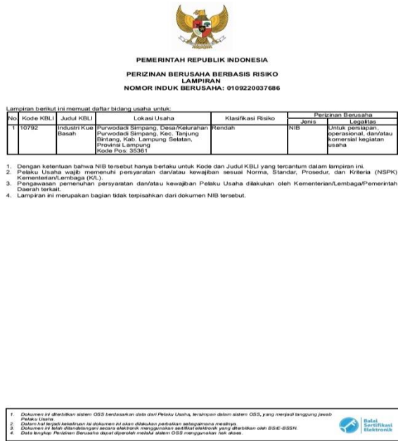
Gambar 2.6 sertifikat NIB