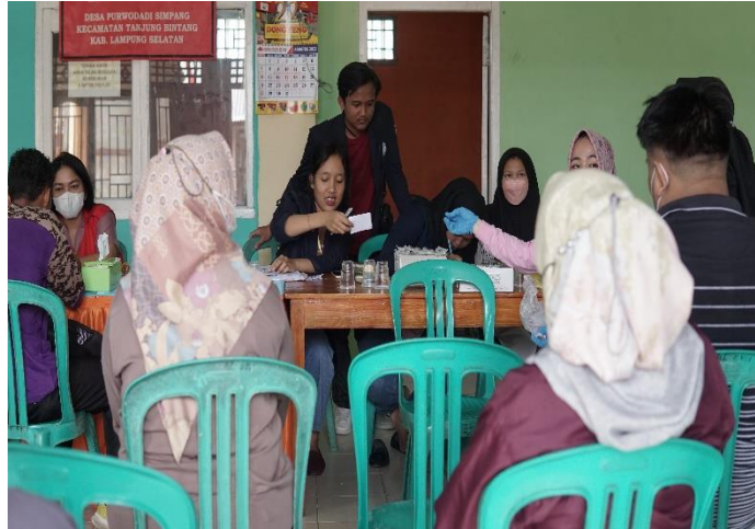
Gambar 2.9 vaksinasi covid-19

mengadakan vaksinasi covid-19 di Balai desa purwodadi simpang oleh tenaga kesehatan pukesmas Purwodadi simpang.