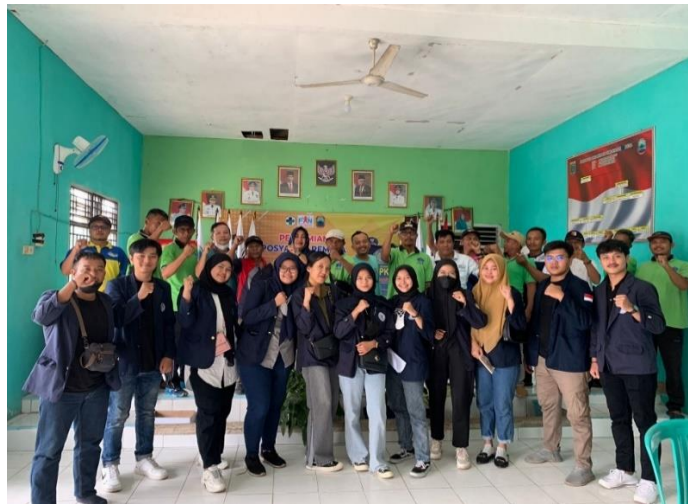
Gambar 2.2 survey

Agar selama PKPM berlangsung berjalan dengan baik saya mengunjungi Balai desa Purwodadi Simpang yang terletak di JCR8+C5P, Purwodadi Simpang, Kec. Tj. Bintang, Kabupaten Lampung Selatan, Lampung dan menyerahkan surat izin pelaksanaan PKPM dan meminta arahan dan dukungan.