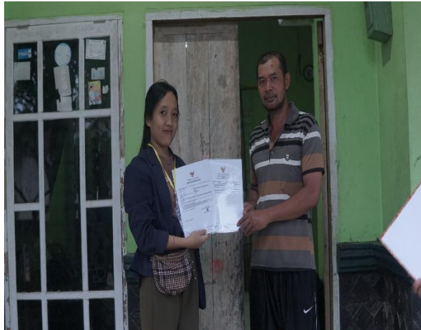
Gambar 2.7 Penyerahan Sertifikat NIB