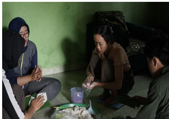
Gambar 2.4 pembuatan kue lemper

Proses pembuatan kue lemper yang berbahankan nasi ketan dan abon sapi. Pertama yan dilakukan pengukusan beras ketan lalu pencetakan dan pengisian abon setelah itu pembungkusan menggunakan daun pisang.