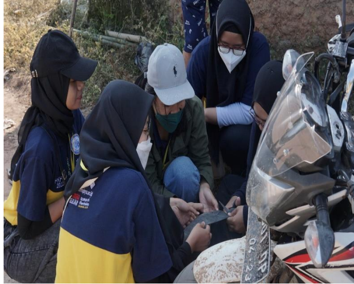
Gambar 2.10 Gotong royong