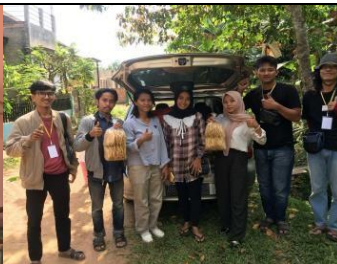
Foto bersama pemilik UMKM Opak Rumah Kita