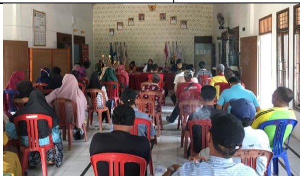
Pembagian hadiah 17an