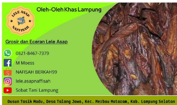
Gambar 2.2 Kartu Nama UMKM Lele Asap Naffisah