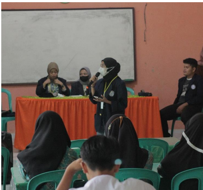
Gambar 2.10 Kegiatan Mengajar SMA N 1 Merbau Mataram

dikarenakan banyak remaja yang masuk dalam dunia pergaulan bebas. Jika pergaulan bebas masih banyak terjadi khususnya pada remaja, tentu hal ini akan merugikan diri mereka sendiri, keluarganya, dan negara.