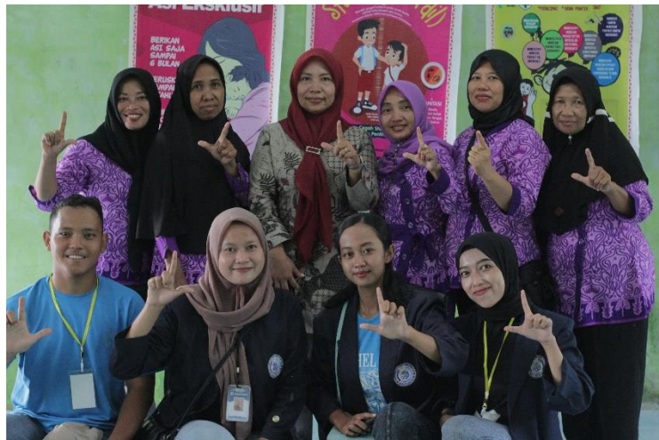
Gambar 2.11 Kegiatan Membantu Posyandu Desa Talang Jawa