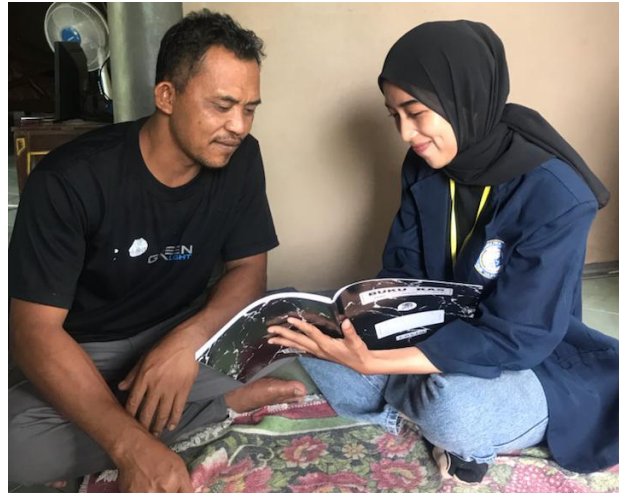
Gambar 2.6 Pelatihan Pencatatan Keuangan