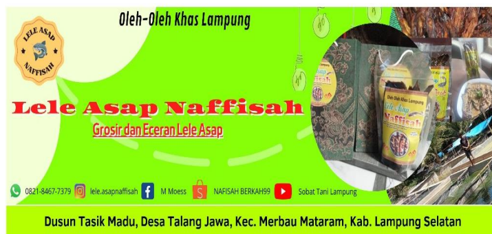
Gambar 2.3 Banner UMKM Lele Asap Naffisah