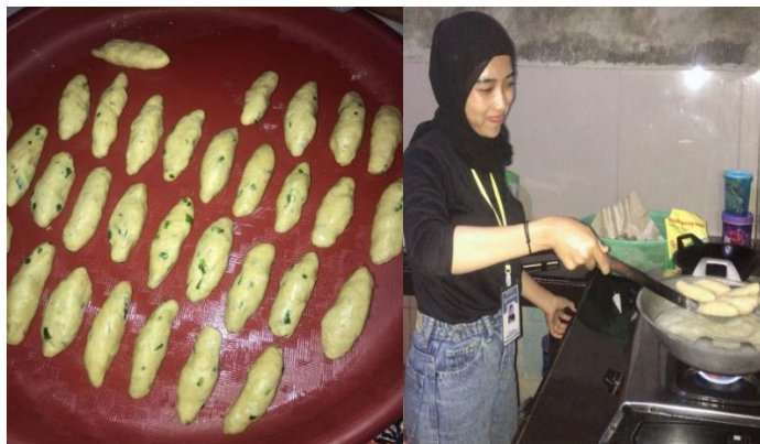
Gambar 2.4 Kegiatan Produksi Sempol Lele

Sempol adalah olahan makanan sejenis gorengan yang terbuat dari tepung tapioka. Jenis makanan ini pada pengolahannya biasanya dicampur dengan daging ayam, namun pada kesempatan ini penulis menyarankan kepada pemilik UMKM untuk mengolah sempol dicampur dengan daging ikan lele. Sempol merupakan jajanan yang cukup diminati oleh masyarakat khususnya anak-anak, oleh karena itu penulis menyarankan produk tersebut sebagai bentuk inovasi yang penulis berikan kepada pemilik UMKM guna menambah pendapatan pemilik UMKM.