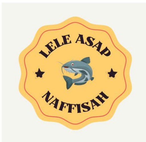
Gambar 2.1 Logo UMKM Lele Asap Naffisah

Logo, kartu nama, dan banner merupakan sebuah identitas usaha yang sangat bermanfaat bagi sebuah usaha. Adanya logo, kartu nama, dan banner, pelanggan akan lebih mudah mengetahui informasi tentang usaha tersebut.