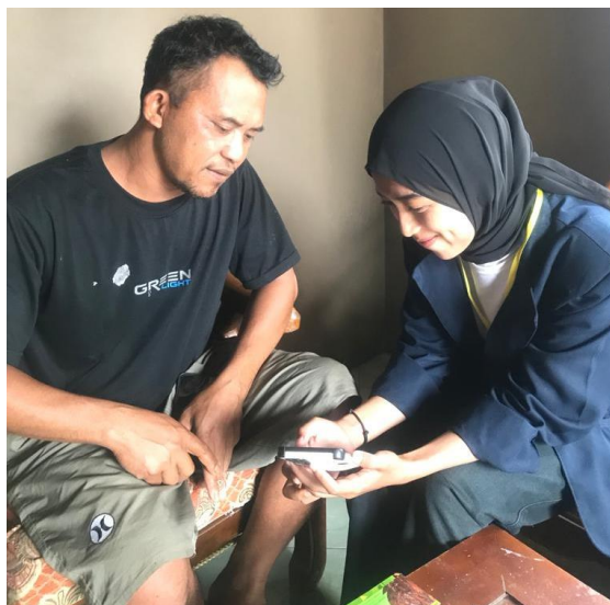
Gambar 2.7 Pelatihan Penggunaan Aplikasi Stroberi Kasir