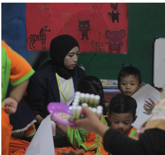
Gambar 2.9 Kegiatan Mengajar TK Bina Mulya II

TK Bina Mulya II adalah jenjang pendidikan anak usia dini yang berada di Dusun Tasik Madu, Desa Talang Jawa, Kecamatan Merbau Mataram, Kabupaten Lampung Selatan. Pada kesempatan ini, penulis membantu kegiatan belajar mengajar di TK Bina Mulya II.