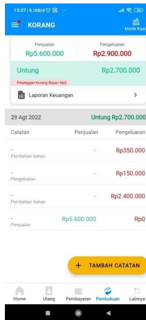
Gambar 5 1. Tampilan hasil keseluruhan beban yang dikeluarkan