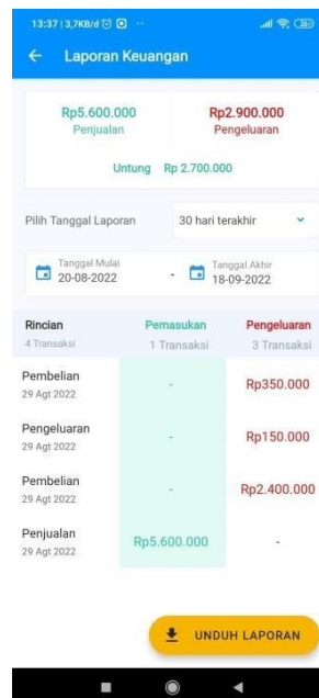
Gambar 6 1. Tampilan laporan keuangan setelah seluruh beban dimasukkan