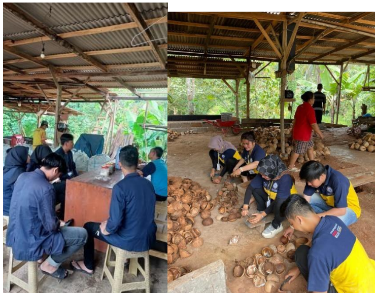
Gambar 2 1. Survey lokasi dan membantu proses produksi UMKM Kopra

Selama PKPM berlangsung, kami mengunjungi UMKM kopra dan ikut serta dalam proses pembuatan kopra dari tahap awal sampai dengan tahap akhir serta membantu membuat pembukuan keuangan secara digital, logo dan merek untuk kopra dan mengedukasi pemilik UMKM tentang penggunaan media sosial.