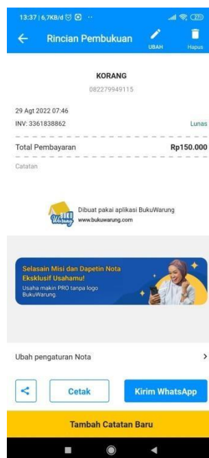
Gambar 4 1 Hasil pencatatan beban pengeluaran