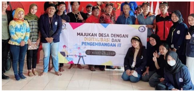
Gambar.15 Edukasi IT pada aparat desa