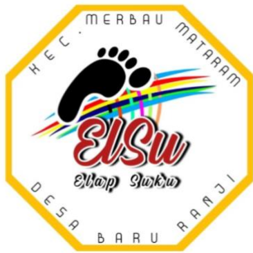
Gambar 3. Logo Pengerajin Kesen (Elsu /Elap Suku)

Berdasarkan kegiatan yang sudah dilakukan, mendapatkan hasil berupa logo sebagai tanda pengenal dari UMKM di desa Baru Ranji yaitu mulai dari UMKM pengerajin,kayu (Kertadayu “Kerajinan Tangan Dari Kayu”), Pengerajin Kesen “Elap Suku”, Gula Aren (Genji “Gula Aren Ranji”). Logo tersebut sudah di desain sebagai identitas /nama dari UMKM beserta produk mereka yang sebelumnya masih belum memiliki nama.