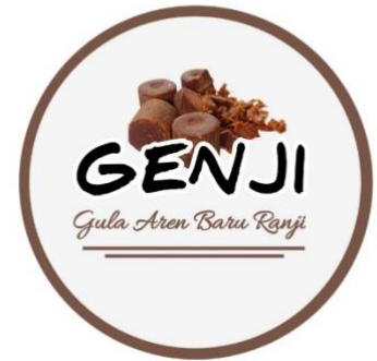
Gambar 5. Logo UMKM Gula Aren