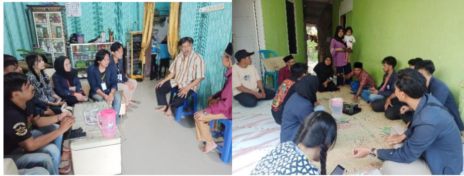
Gambar.19 Pengenalan Dusun