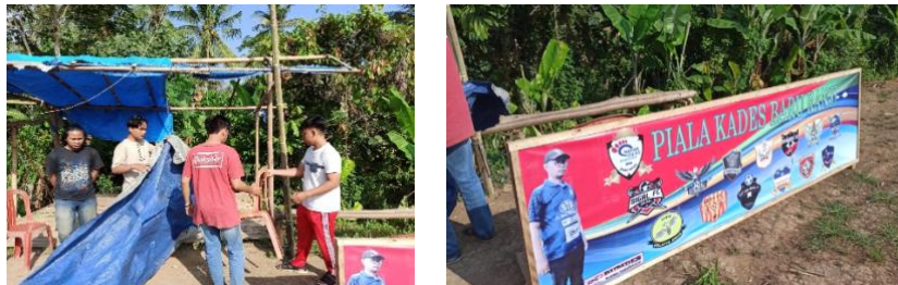
Gambar.17 Persiapan Liga Desa