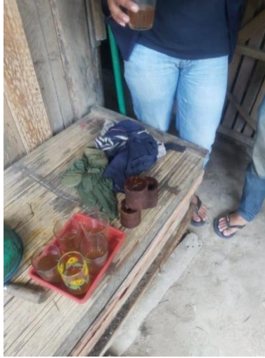
Gambar 1. Kunjungan UMKM