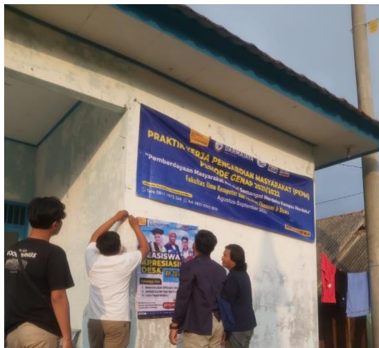
Gambar.10 Pemasangan Banner