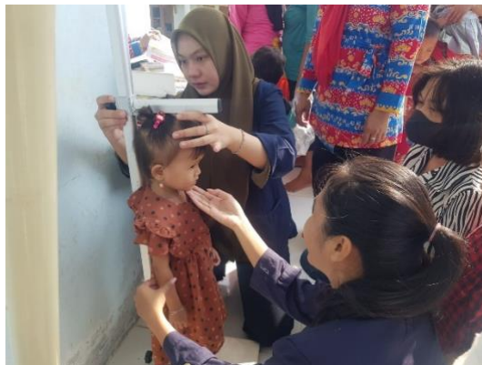
Gambar.11 Stunting Posyandu