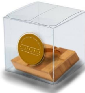
Gambar 7. Contoh Logo Produk Kayu