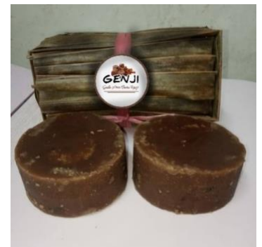
Gambar 8. Contoh Logo Produk Gula Aren