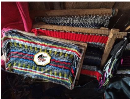
Gambar 6. Contoh Logo Produk Kesen