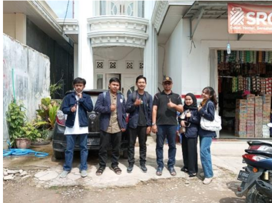
Gambar.9 Kunjungan Desa Baru Ranji

Berikut gambar dokumentasi yang diambil selama melakukan Praktek Kerja Pengabdian Masyarakat :