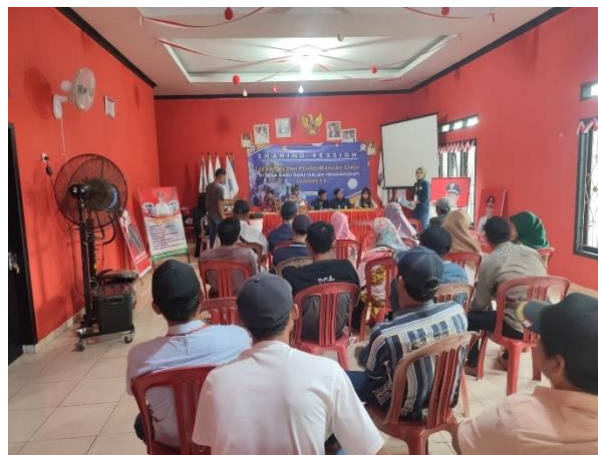
Gambar.14 Sharing Session UMKM