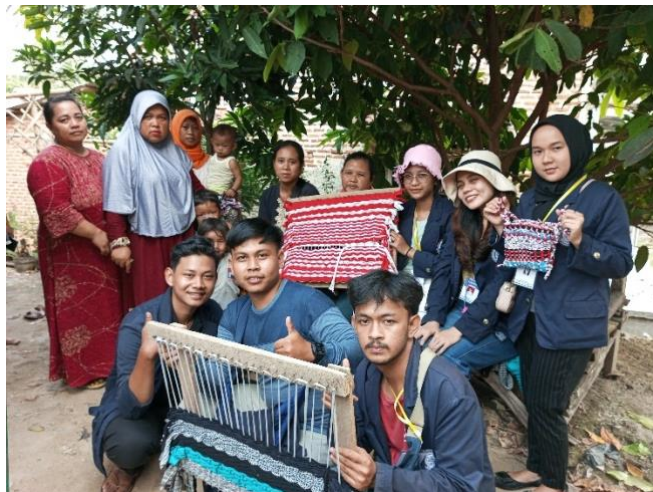
Gambar.13 Hasil Kerajinan Kesen