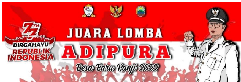
Gambar.16 Desain piala lomba adipura desa Baru Ranji