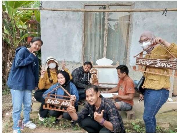
Gambar.12 Hasil Kerajinan Kayu