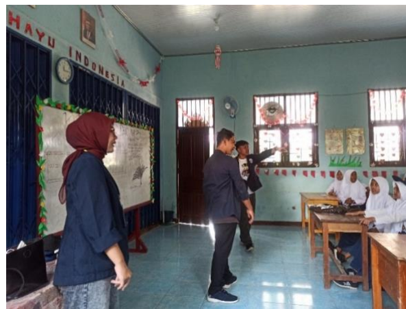
Gambar.20 Kunjungan SMP PGRI 1 Merbau Mataram