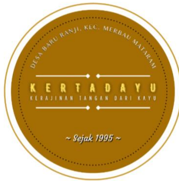
Gambar 4. Logo Pengerajin Kayu (Kertadayu)