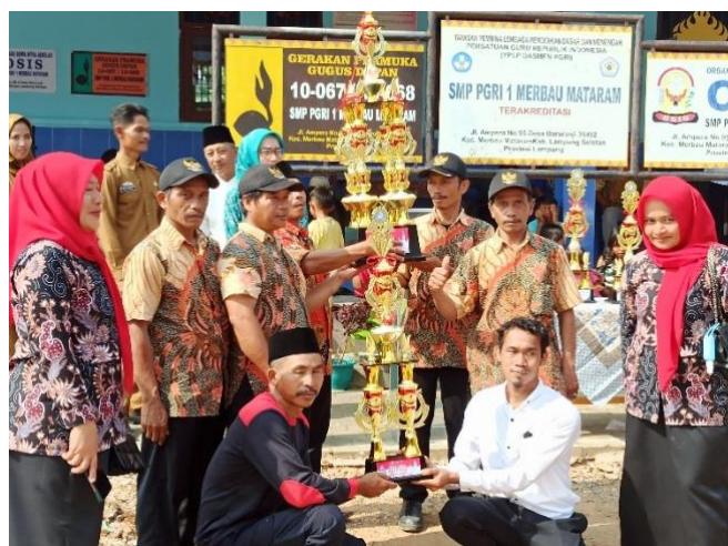
Gambar.18 Pemberian piala lomba adipura desa Baru Ranji