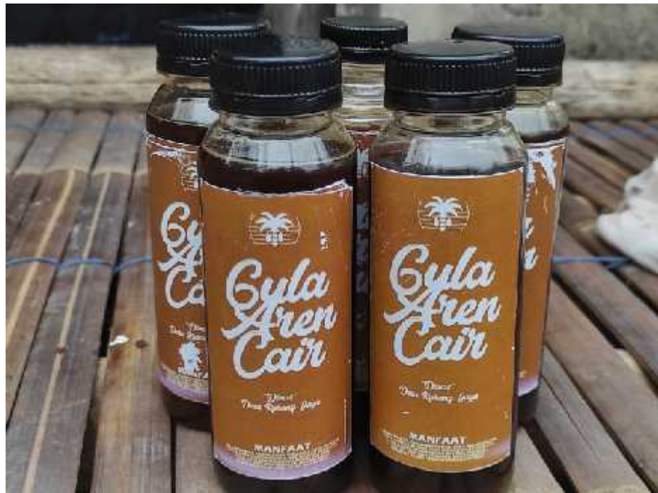
Gambar 2.2 Hasil Pengembangan Umkm