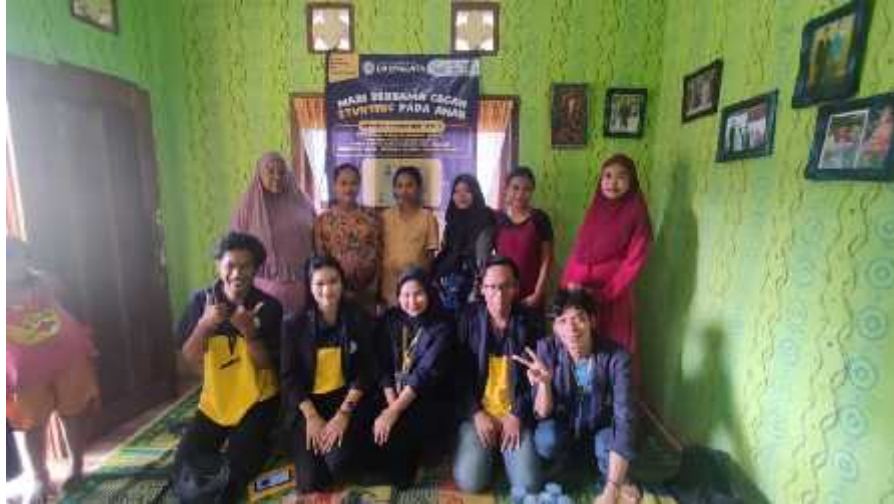
Gambar 2.3 Kegiatan Sosialisasi Stunting