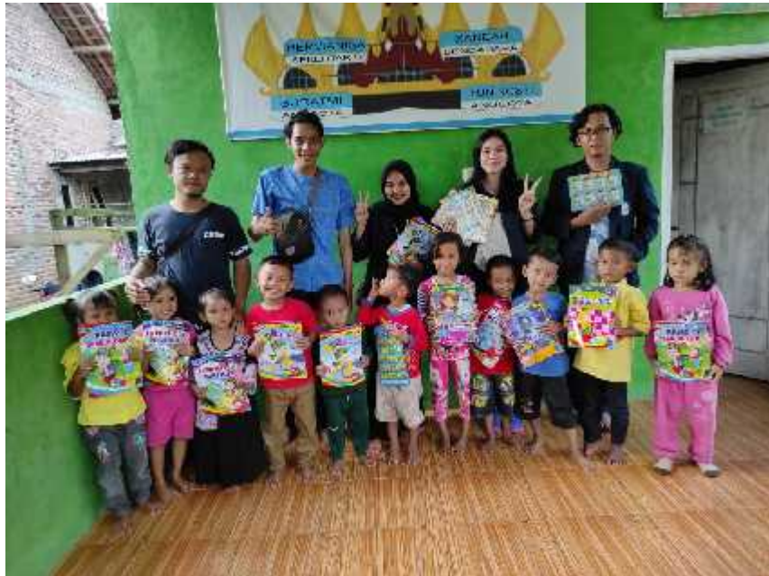
Gambar 2.4 Kegiatan Pendampingan Belajar Pada Anak Anak Paud

Di Desa Karang Jaya terdapat PAUD bagi anak-anak di lingkungan sekitar tetapi belum memiliki ruang kelas sehingga kegiatan belajar menggunakan tempat posyandu, kami membantu beberapa kegiatan belajar disana seperti mewarnai, menyanyi dan belajar berdoa serta memberikan sarana pembelajaran berupa buku baca dan mewarnai untuk kegiatan belajar mengajar