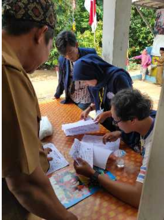
Gambar 2.5 Hasil Kegiatan PKPM lainnya