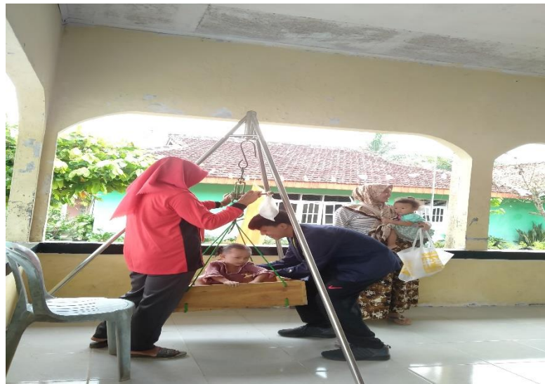
Kegiatan Posyandu Didesa Pujirahayu