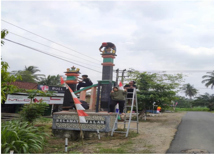
Pengecatan Gapura Di Desa PujiRahayu Untuk Memperingati Hut Ri Indonesia Ke 77