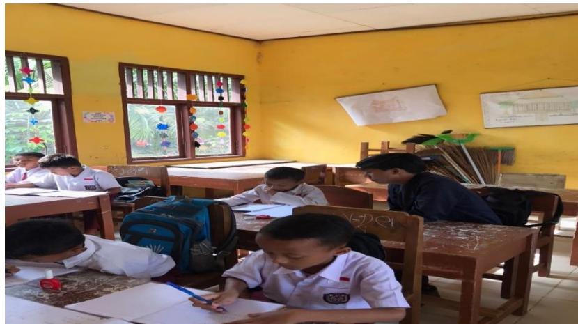
Kegiatan Pendampingan Siswa Sd