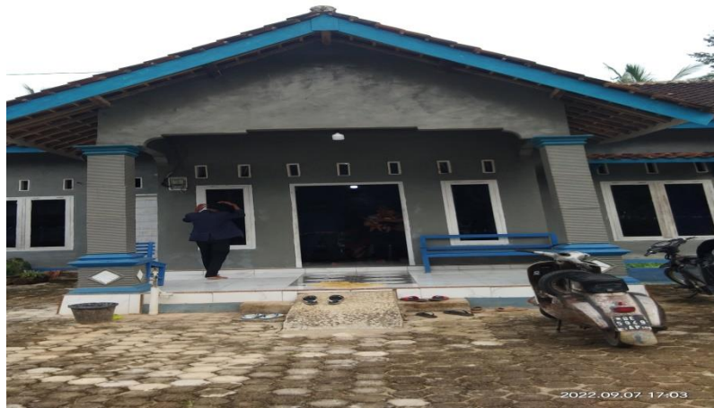
Rumah produksi UMKM ibu sulis