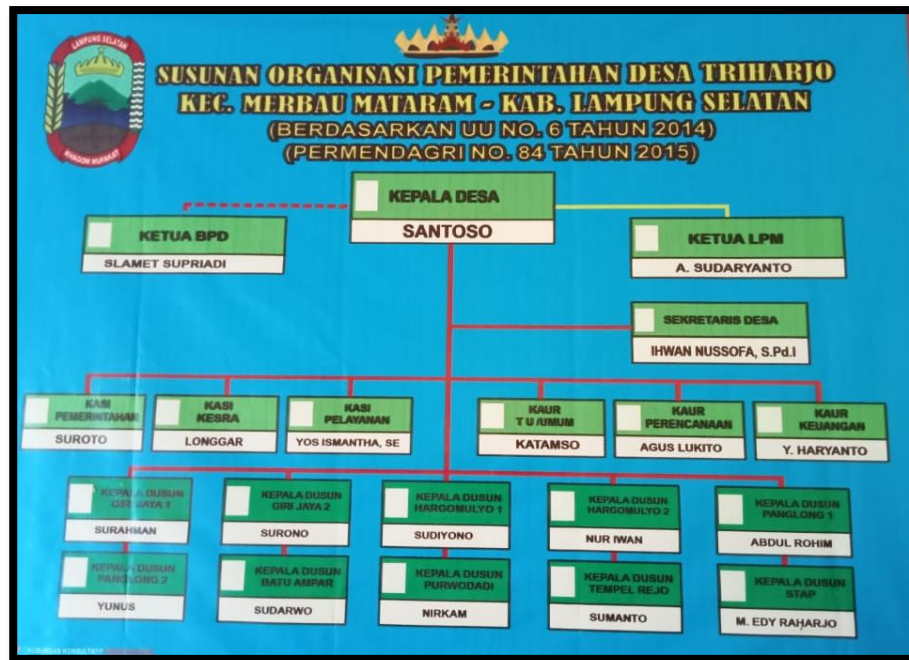
Gambar 1.2 Struktur Organisasi Pemerintahan Desa Triharjo

Berdasarkan hasil observasi, Desa Triharjo memiliki beberapa potensi diantaranya :