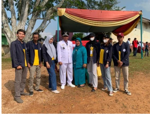
Gambar 2.5 kegiatan masyarakat