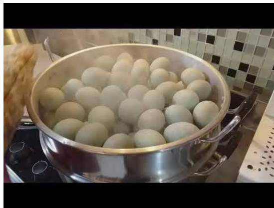
Gambar1.6 Proses Selesai 14 Hari Telur Didiamkan dan Ingin Di Rebus