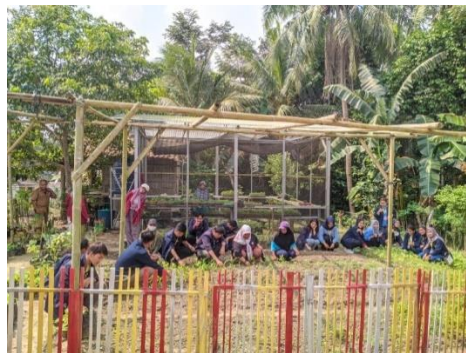
Gambar 2.3 persiapan lomba taman toga

Kegiatan ini dilakukan untuk membantu ibu-ibu pkk desa Kali Asin dalam rangka memperingati hari kemerdekaan dengan lomba taman toga antar desa yang diselenggarakan oleh kecamatan Tanjung Bintang .