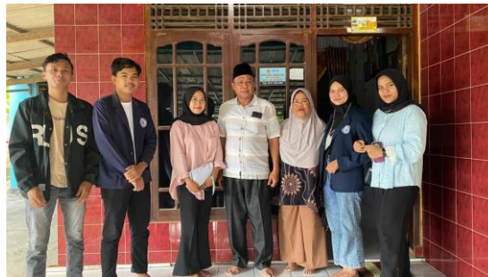
Gambar 1.1 Kunjungan Kepala Desa

Selama PKPM berlangsung saya ikut serta dalam proses pembuatan telur asin barokah dari tahap awal sampai dengan tahap akhir serta berinovasi membuat logo dan merek untuk telur asin barokah dan mengedukasi pemilik UMKM tentang penggunaan media sosial.