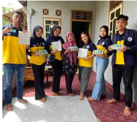
Gambar 2.2 Telur Asin Siap Dijual