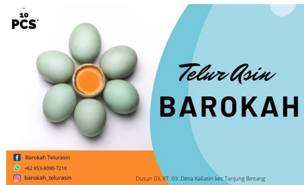
Logo Telur Asin Barokah

Pembuatan logo atau merek telur asin bertujuan untuk memberikan hal yang berbeda kepada konsumen serta menjadi media promosi.