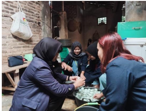
Gambar 1.3 Proses Membersihkan Telur Bebek yang baru diambil

Proses pembuatan telur asin dimulai dengan mencuci bersih telur bebek yang baru diambil dan sehabis itu menyiapkan bak besar garam dan juga bata yang sudah halus. lalu bata dan garam diaduk sambil dituangkan air sedikit demi sedikit sehingga tercampur rata. ambil bahan yang sudah dicampur tadi diratakan sedikit didalam bak dan susun telur bebek satu persatu lalu dikubur lagi dengan bahan tersebut sehingga telur terkubur rata dengan bahan tersebut. dan didiamkan selama 14 hari agar rasa asin yang maksimal kedalam telur. setelah 14 hari telur telur dicuci bersih dan direbus lalu ditiriskan sebentar sesudah itu telur asin siap dikemas dan siap dijual kepada konsumen.