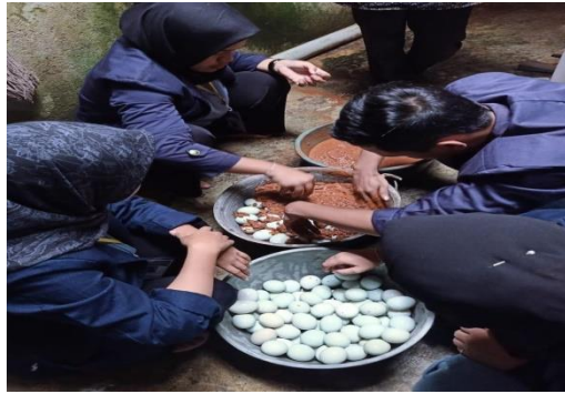
Gambar 1.5 Proses Mengubur Telur Satu Persatu