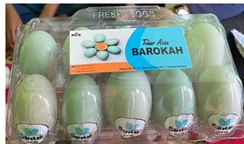
Gambar 1.7 proses Mengelap Satu Persatu Telur Yang Ingin Dikemas dan siap di jual kepada konsumen