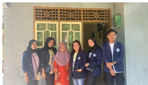
Gambar 1.2 Kunjungan kepada pemilik UMKM