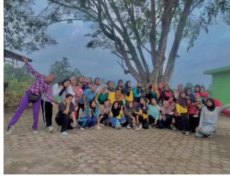
Gambar 2.3 senam jantung sehat