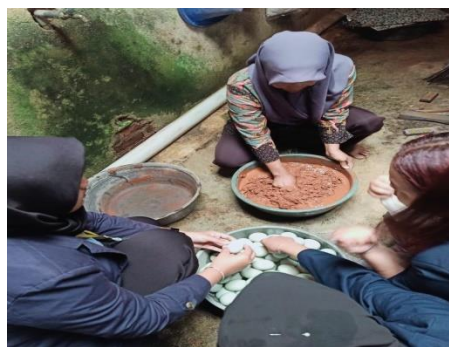
Gambar 1.4 Proses Mencampurkan Garam dan Bata