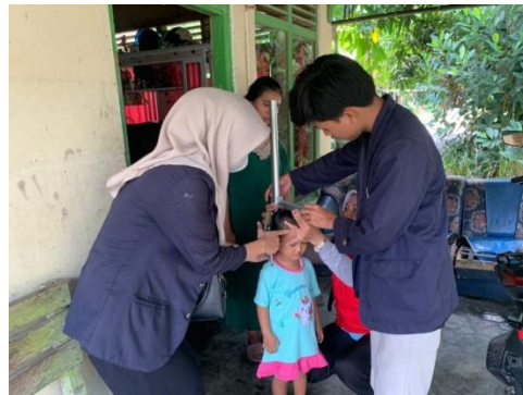
Gambar 2.4 Kegiatan Survei gizi

Kegiatan survei gizi dilakukan untuk mengetahui tumbuh kembang balita yang terdapat pada desa Kali Asin untuk mengetahui dan mencegah terjadinya stunting pada balita.