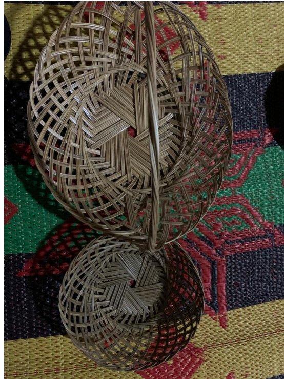
Gambar 2.1 bentuk rinjing