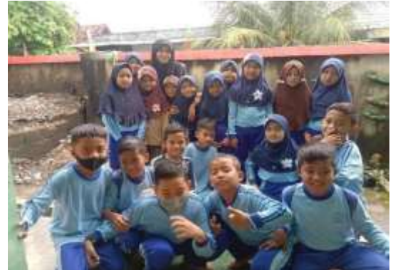
Gambar 5. Sosialisasi Literasi Digital