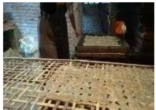
Gambar 6. UMKM Kemplang