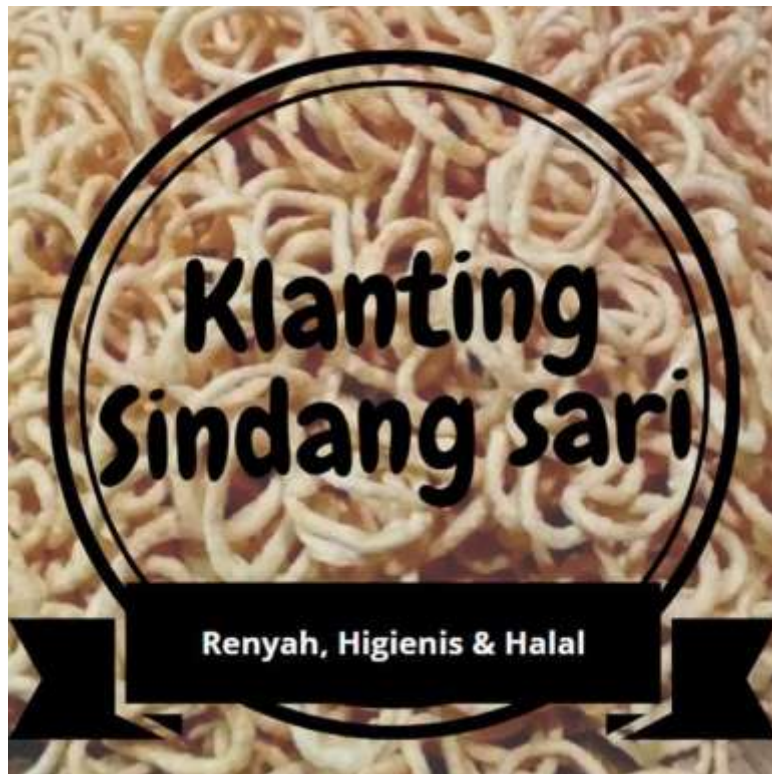
Gambar 1. Pembuatan Logo Merek

Kegiatan Mengunjungi Usaha Mikro Kecil Menengah (UMKM) ini membantu pemilik usaha dalam memasarkan produksi penjualannya dan juga pembuatan Logo Merek agar produk mempunyai ciri khas tersendiri dan dikenal dikalangan masyarakat lainnya. Usaha milik Pak Yanto ini hanya mengandalkan warung/pasar dan tetangga sekitar saja. Oleh karena itu saya mencoba untuk mengenalkan produksi usaha pak yanto ini melalui media sosial dan marketplace seperti facebook, instagram, dan shoppe agar usaha milik pak yanto dapat berkembang luas dan di kenal di masyarakat.