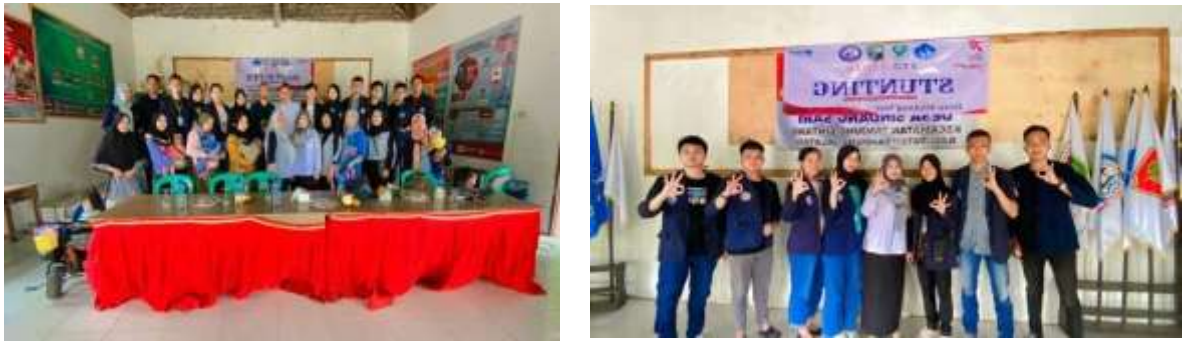
Gambar 7. Sosialisasi Stunting