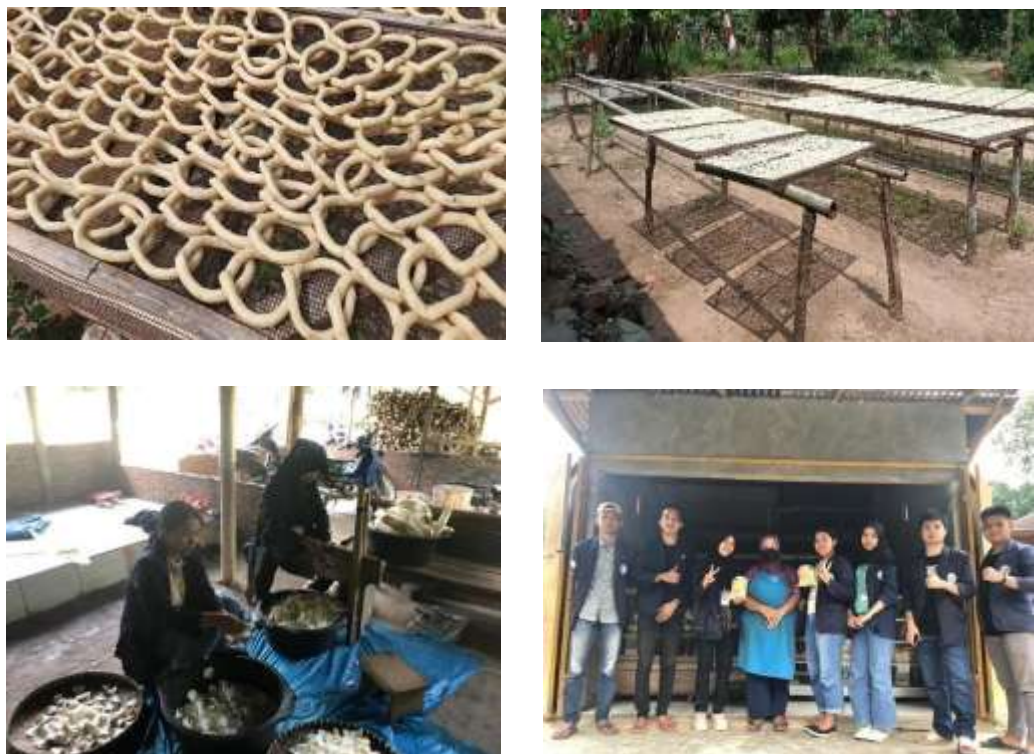
Gambar 3. UMKM Keripik dan Klanting Singkong