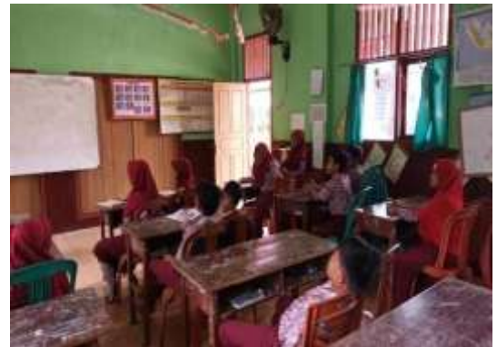
Gambar 4. Sosialisasi Narkotika dan Pergaulan Bebas