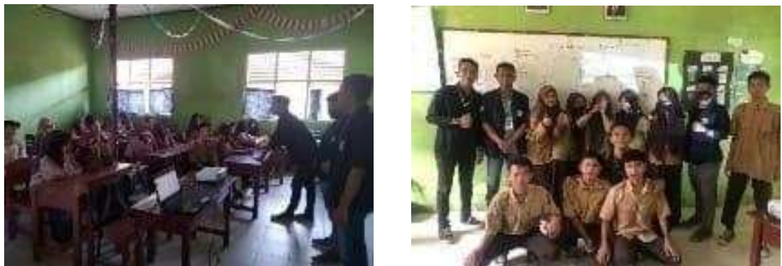
Gambar 8. Sosialisasi Literasi Digital di SMP