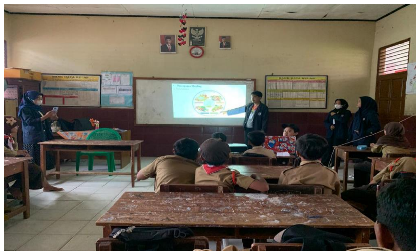
Gambar 2. Melakukan presentasi 4 Sehat 5 Sempurna

Sosialisasi stunting ini diharapkan dapat meningkatkan anak untuk selalu menjaga pola sehat serta mengenalkan 4 sehat 5 sempurna