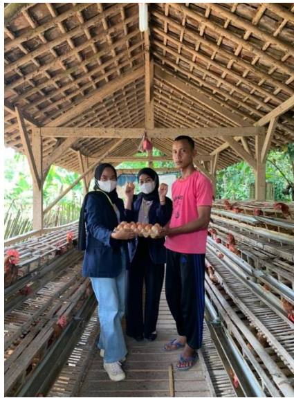
Gambar 13.Foto Produk