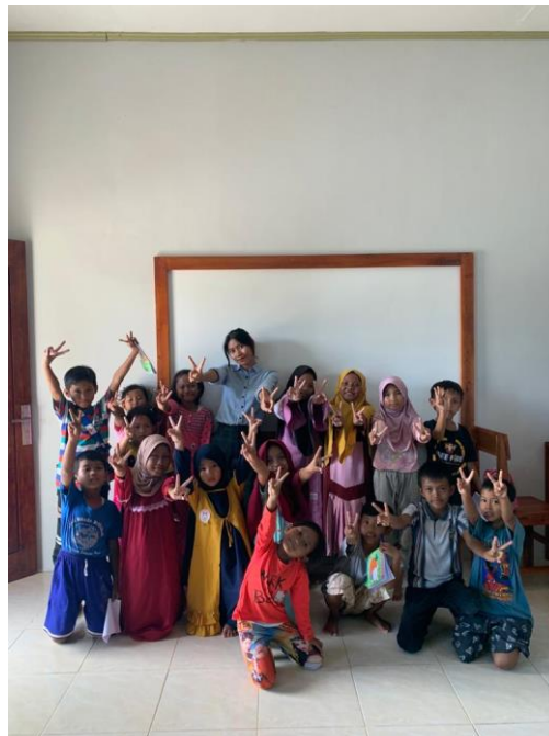
Gambar 6. Dokumentasi Rumah belajar

Rumah Belajar merupakan kegiatan yang diadakan untuk membantu anak-anak pelajar di Galih Lunik yang kurang mengerti disekolah dengan materi ataupun membantu adik-adik pelajar yang mempunyai pr di sekolah.