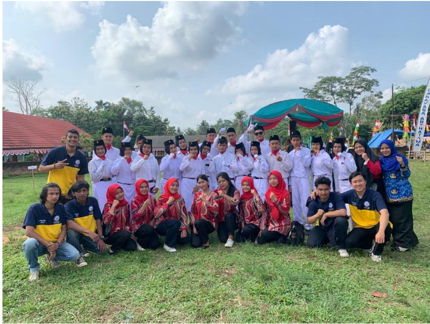
Gambar 4. Mengikuti Upacara