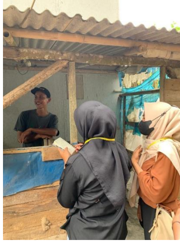
Gambar 12.Sosialisasi Pembukuan