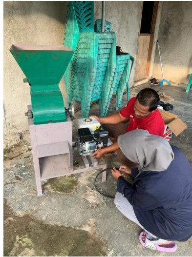
Gambar 9.Foto Produk