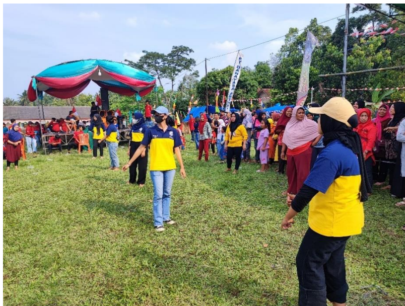
Gambar 5. Memeriahkan Lomba HUT RI