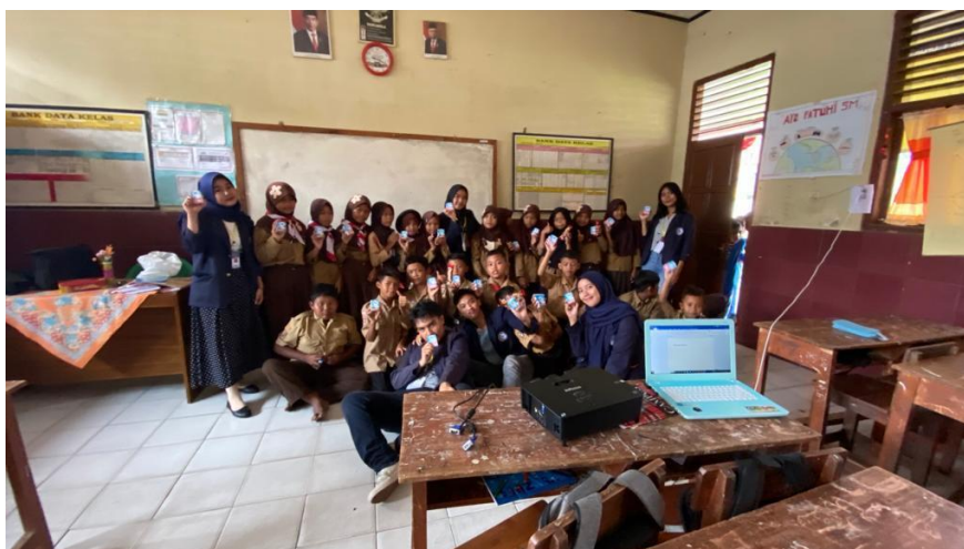
Gambar 3.Sosialisasi Stunting