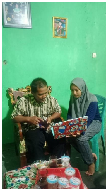
Gambar 8. Penyerahan akun E-commerce dan logo