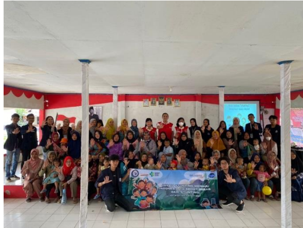
Gambar 2.7 Foto bersama peserta, bidan desa dan juga mahasiswa PKPM