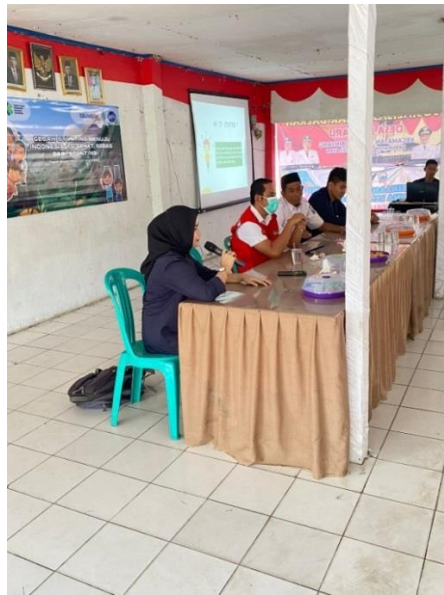
Gambar 2.3 Memberikan sambutan kepada tamu undangan