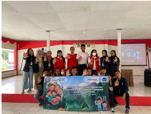
Gambar 2.8 Foto bersama mahasiswa PKPM, bidan desa dan juga bapak sekretaris desa