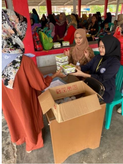
Gambar 2.2 Pembagian snack untuk para tamu undangan