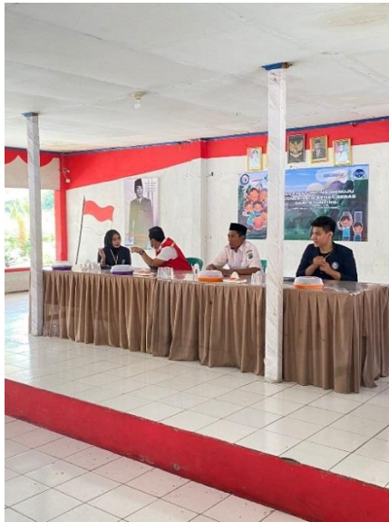
Gambar 2.4 Mendampingi pemateri