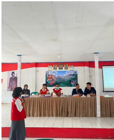
Gambar 2.5 Penyampaian materi oleh pihak puskesmas