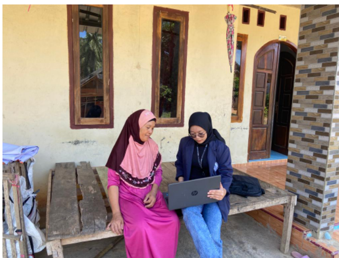
Gambar 2.2 Melakukan pelatihan tentang desain dalam digital marketing

Memberikan pelatihan E-commerce dan desain pada pemilik UMKM kerupuk dua rasa,kegiatan ini dilakukan untuk mengedukasi tentang digital marketing yang bertujuan untuk memasarkan produk agar lebih luas dikenal didalam maupun diluar desa.