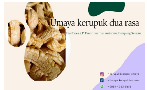
Gambar 2.1. Pembuatan E-commerce dan Desain

Proses pembuatan E-commerce menggunakan aplikasi-aplikasi yang telah disetujui antara mahasiswa dan pemilik umkm, lalu membuat desain produk menggunakan software Canva, pembuatan akun-akun menggunakan alamat email, nomor serta alamat pribadi pemilik yang