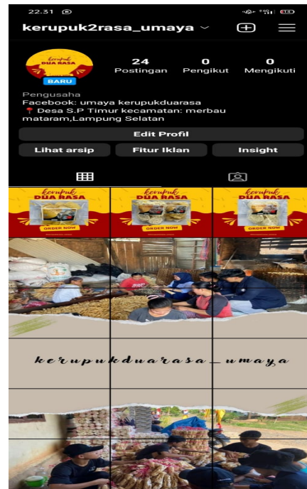
Gambar 2.5. Akun Instagram kerupuk Bu Umaya