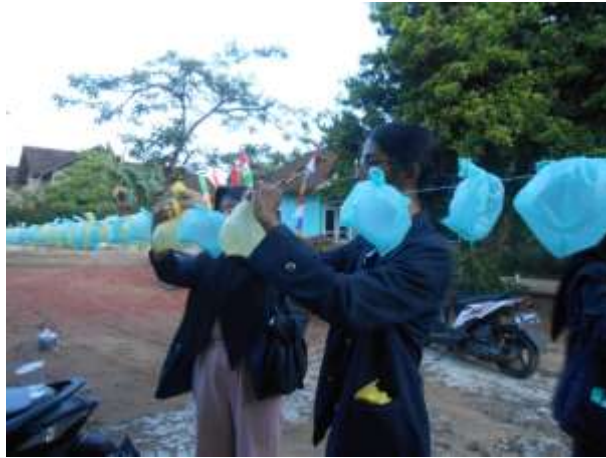
Gambar 7. Menyiapkan lokasi perlombaan 17 Agustus