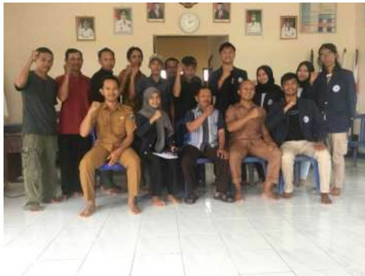
Gambar 23. Foto bersama saat perpisahan PKPM