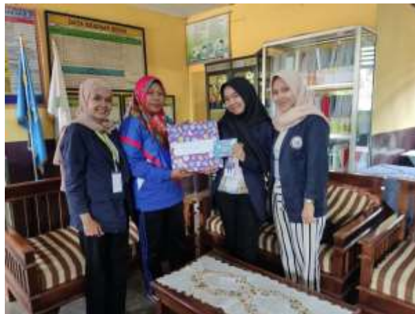
Gambar 12. Memberikan kenang-kenangan kepada SD Negeri 1 Sidoharjo