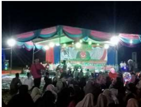
Gambar 17. Menghadiri acara pengajian rutin Jam'iyah Nurul Mahdor