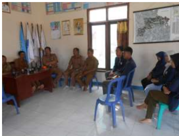
Gambar 6. Berdiskusi bersama perangkat desa dalam rangka perlombaan 17 Agustus