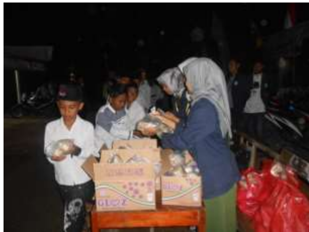
Gambar 3. Membantu & mengikuti pengajian 1 Muharam