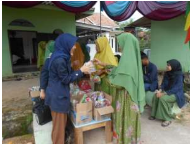
Gambar 5. Membantu & menghadiri pengajian rutin triwulan