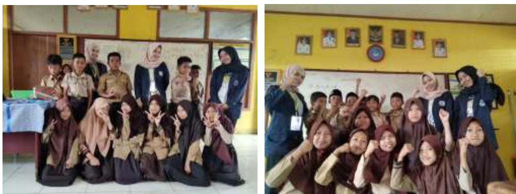
Gambar 13&14. Foto bersama siswa/i SD Negeri 1 Sidoharjo