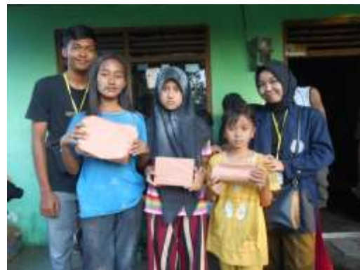
Gambar 9&10. Pembagian hadiah perlombaan kepada pemenang