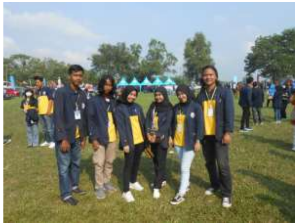
Gambar 8. Mengikuti upacara HUT NKRI di Kecamatan Jati Agung