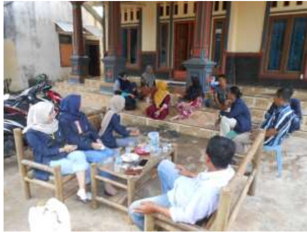
Gambar 4. Melakukan diskusi bersama warga dalam rangka perlombaan 17 Agustus