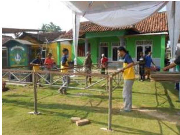
Gambar 2. Bergotong royong bersama warga