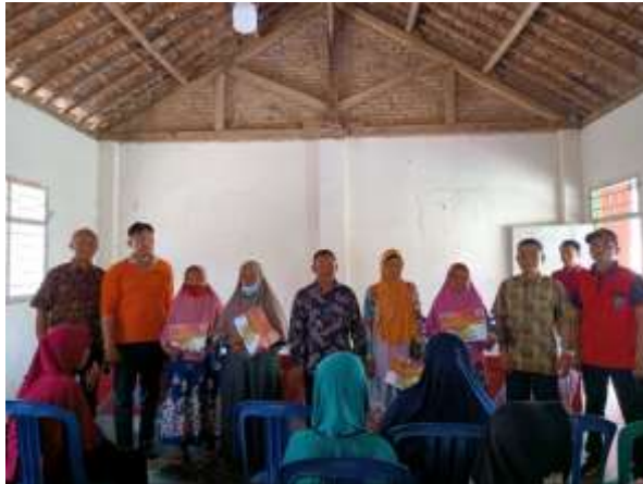
Gambar 11. Membantu dalam acara penerimaan BLT untuk warga