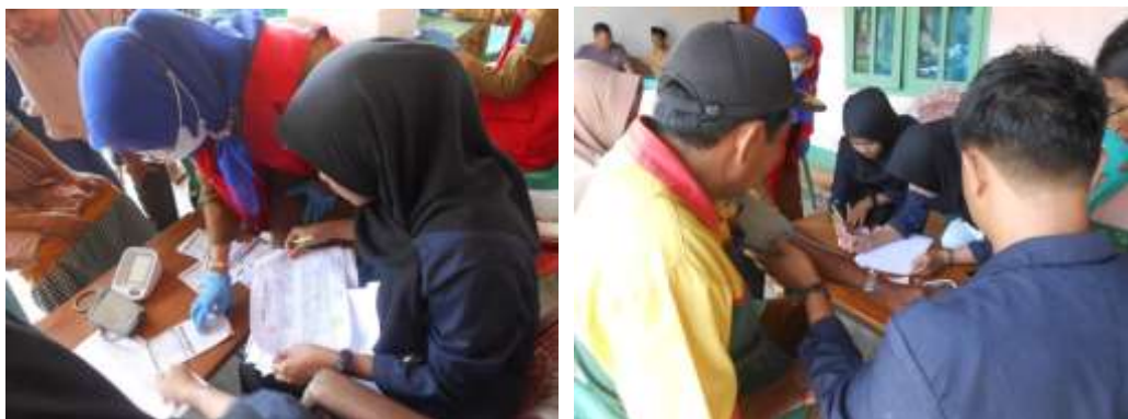
Gambar 18&19. Membantu kegiatan vaksinasi