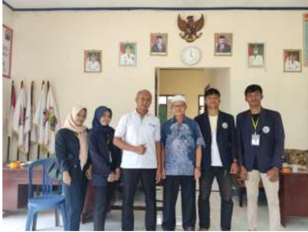
Gambar 1. Foto bersama DPL saat melakukan kunjungan ke lokasi PKPM