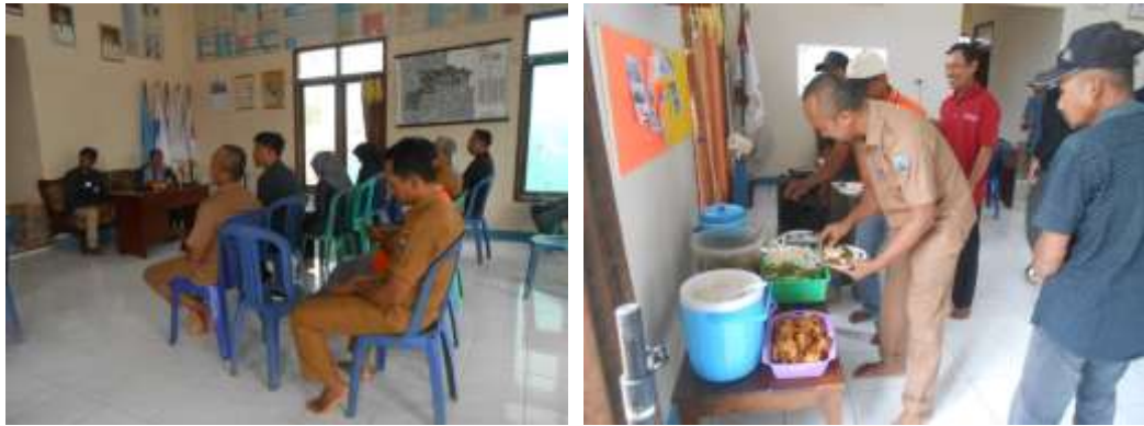
Gambar 21&22. Acara perpisahan mahasiswa PKPM dengan Desa Sidoharjo