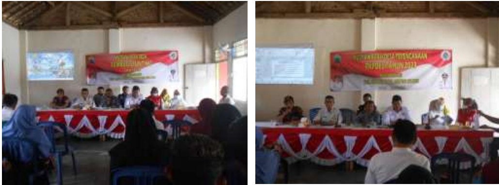
Gambar 15&16. Menghadiri acara musyawarah Rembug Stunting & Rencana RKPDES