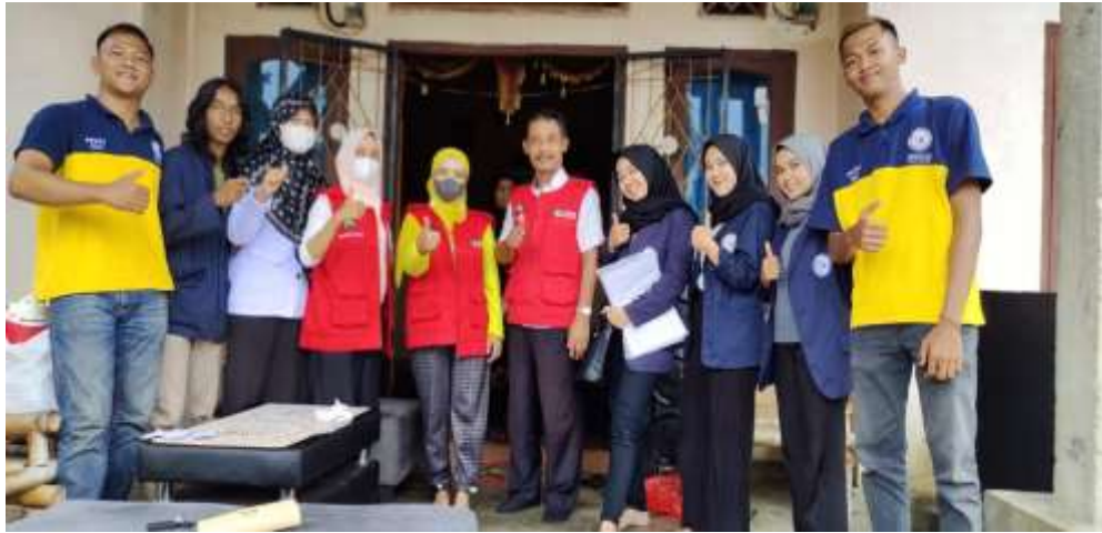
Gambar 20. Foto bersama petugas Kesehatan Vaksinasi