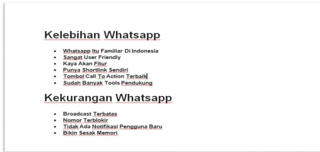
Gambar 2.2 Materi sosialisasi terkait Whatsapp Business