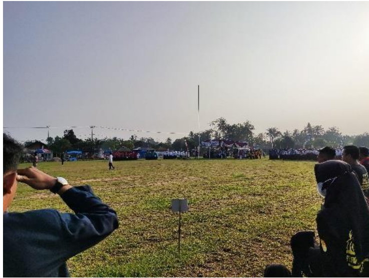
Gambar 2.5 Melakukan upacara bendera HUT RI 77