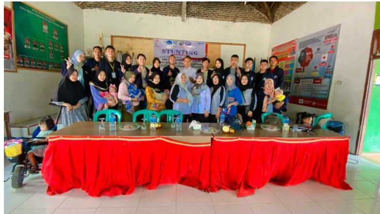
Gambar 2.6 Foto bersama acara Sosialisasi Bahayanya Stunting