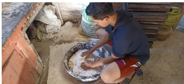
Gambar 2.1 Membantu pembuatan dan produksi UMKM Kemplang Mario

Kegiatan yang dilakukan pada UMKM Kemplang Mario adalah membantu produksi. Produksi dilakukan sesuai dengan pemesanan ada beberapa produk kemplang yang di produksi pada Kemplang Mario yaitu kemplang dengan varian harga RP. 1.000.000 dan RP. 5.000.000,yang membedakan antara kedua varian tersebut yaitu hamyalah kualitas dari sambalnya. UMKM Kemplang setiap hari memproduksi sesuai pesanan yang di minta. Pembuatan Kemplang sendiri masih menggunakan alat tradisional dan proses pengolahannya berlangsung selama 5 jam, setelah diolah maka kemplang selanjutkan di jemur selama 24 jam dan setelah kering maka kemplang akan dipangang lalu dikemas.