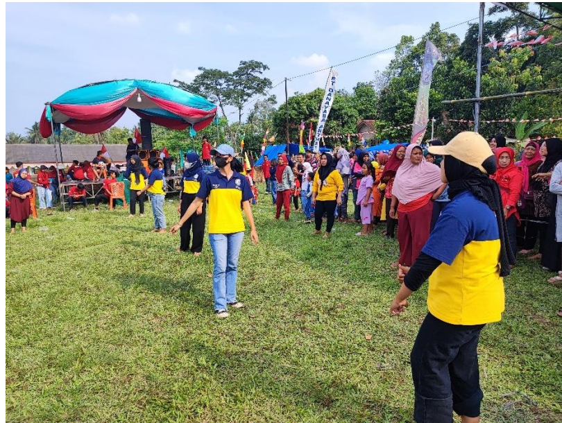
Gambar 6. Berpartisipasi Dalam Lomba yang Diadakan

menggunakan kendaraan masing – masing yang malamnya dilanjut dengan pembagian hadiah.