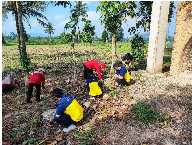
Gambar 15 Gotong Royong Membersihkan Benteng