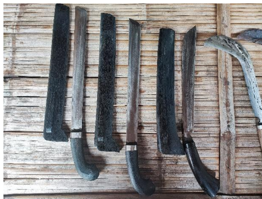
Gambar 10. Dokumentasi foto produk UMKM Pande Besi

Melakukan proses pendaftaran UMKM Pande Besi ke dalam aplikasi e-commerce