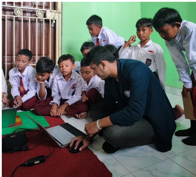
Gambar 5. Proses pembelajaran Ms. Word pada Siswa SD 2 Galih Lunik