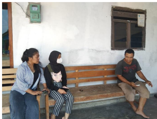
Gambar 9. Dokumentasi mendaftarkan UMKM ke aplikasi

Memberikan informasi terkait penggunaan aplikasi e-commerce dalam peningkatan system pemasaran