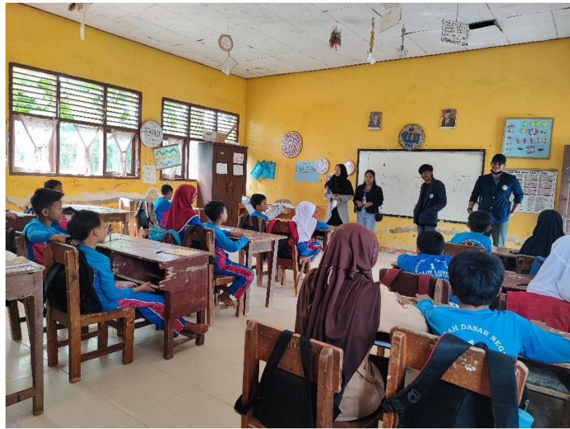
Gambar 4. Pengenalan diri pada Siswa SD 1 Galih Lunik