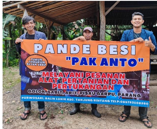
Gambar 8. Penyerahan Banner Pande Besi

Mengunjungi dan menyerahkan Banner Pande Besi pada pemilik UMKM