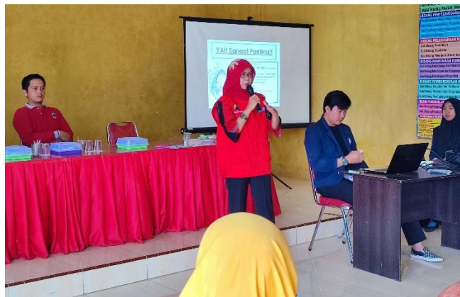
Gambar 2. Sosialisasi stunting

Stunting adalah kondisi gagal tumbuh pada anak balita (bayi dibawah umur 5 tahun) akibat dari kekurangan gizi kronis sehingga anak terlalu pendek untuk usianya. Pencegahan stunting dapat dilakukan saat masa kehamilan dengan cara memakan makanan yang bergizi serta meminum vitamin.