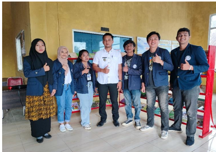
Gambar 13 Foto Bersama Kepala Desa