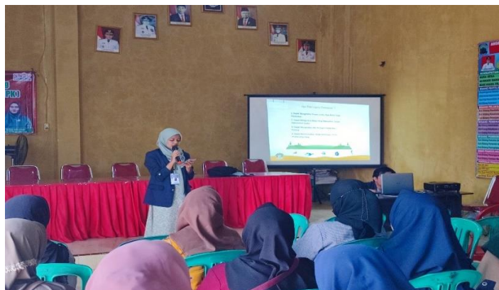
Gambar 1. Melakukan Sosialisasi Pembukuan

Sosialisasi pembukuan dilakukan guna meningkatkan pengetahuan pelaku UMKM tentang betapa pentingnya melakukan pembukuan dalam suatu bidang usaha. Pembukuan yang teratur dan rapi tentu saja memudahkan pelaku UMKM dalam mengetahui keuntungan serta kerugian yang mungkin saja terjadi dan mengurangi kejadian salah perhitungan.