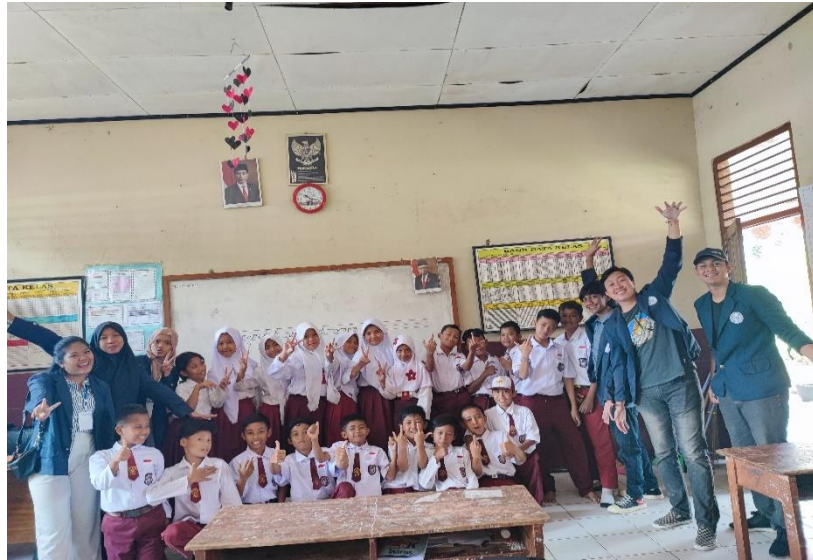
Gambar 16 Foto Bersama Murid-Murid