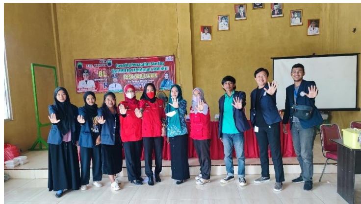
Gambar 3. Foto Bersama Bidan di desa Galih Lunik