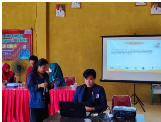
Gambar 19. Sosialisasi Izin Usaha Untuk (Legalitas) untuk Seluruh UMKM