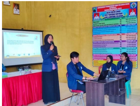
Gambar 18. Sosialisasi Pembukuan Terhadap UMKM Sembako