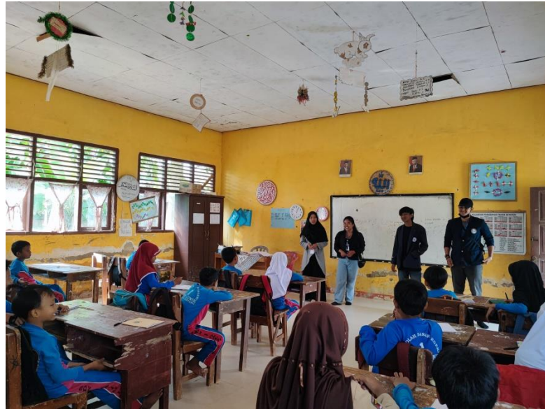
Gambar 22. Ruang kelas SDN 1 Galih Lunik