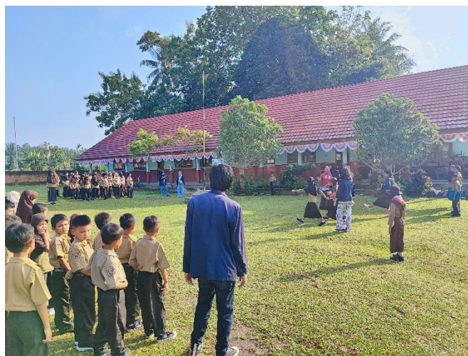
Gambar 21. Sekolah Desa Galih Lunik