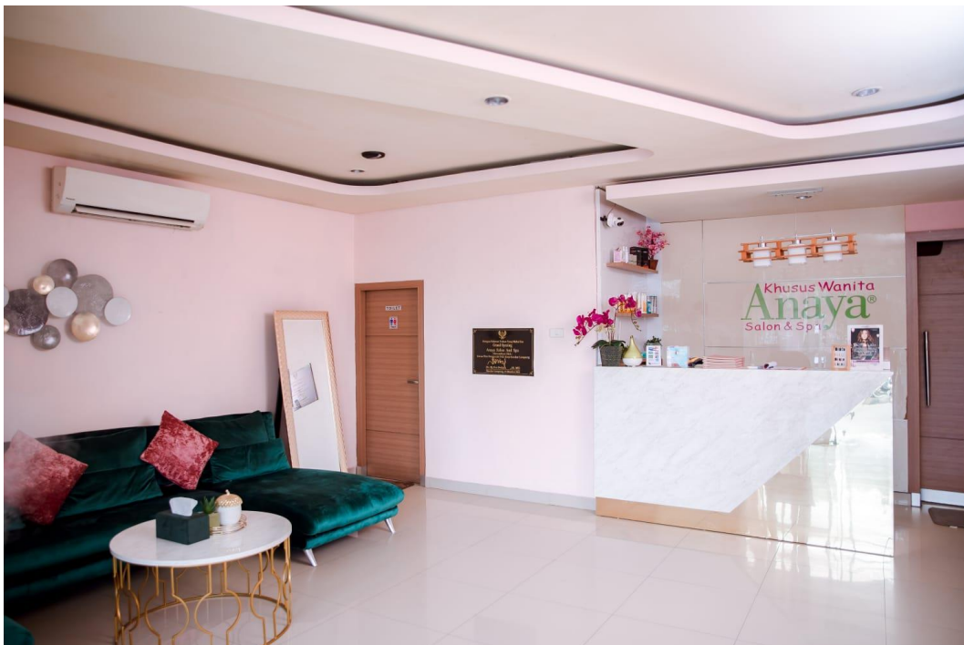
Lampiran 2 Ruangan depan Anaya Salon N Spa