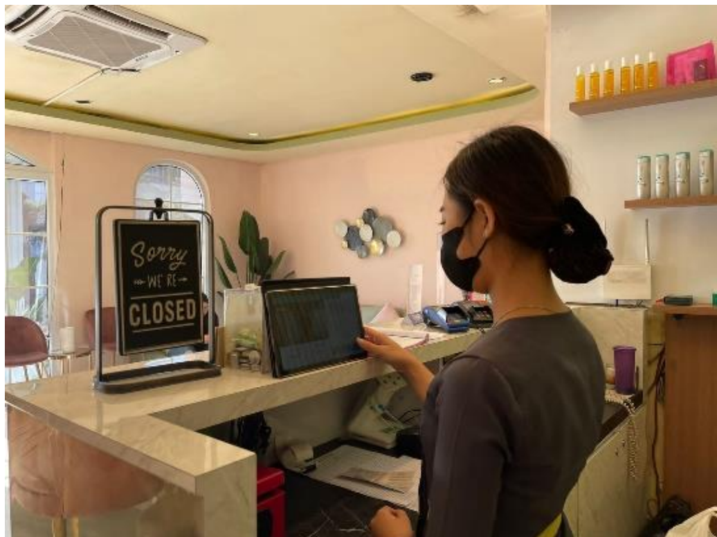
Lampiran 6 Proses absensi setelah menggunakan HRIS