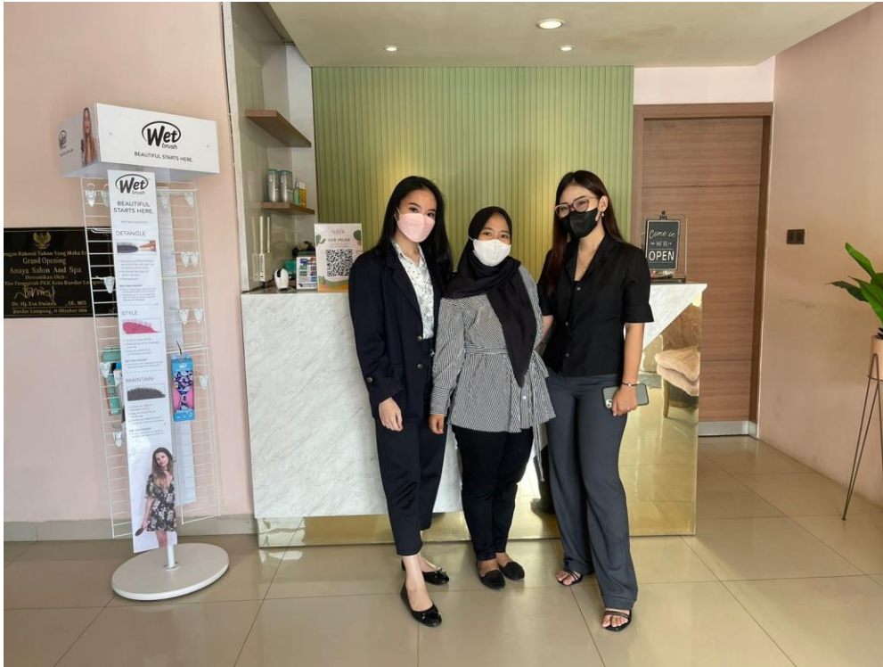
Lampiran 1 Pengantaran Mahasiswa KP ke Anaya Salon N Spa