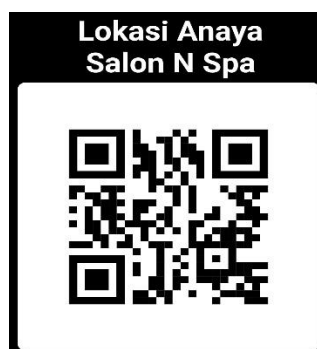
Gambar 2.2 Scan Barcode Lokasi Anaya Salon N Spa

https://maps.app.goo.gl/o5MG1Y4xbQqQ8HJZA