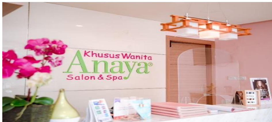
Gambar 2.1 Anaya Salon N Spa

Anaya Salon N Spa terletak di Jl. Teuku Umar No. 56, Sawah Brebes, Kec. Tanjung Karang Timur, Bandar Lampung, Lampung 35121, No. Telepon : (0721) 5604222