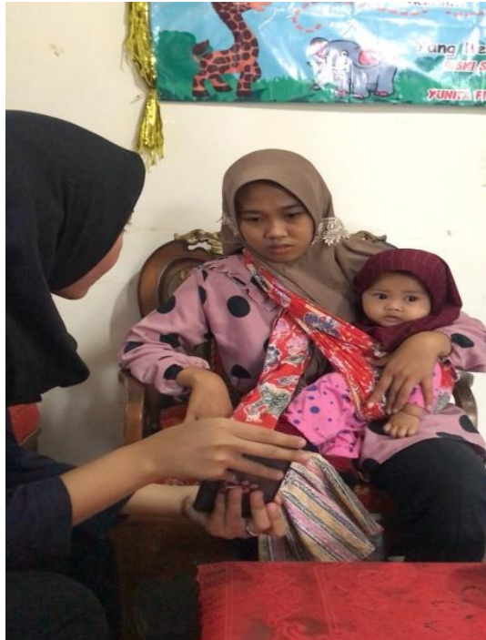
Gambar 2.2 Pelatihan Stroberi Kasir Kepada UMKM KWT Maju Bersama