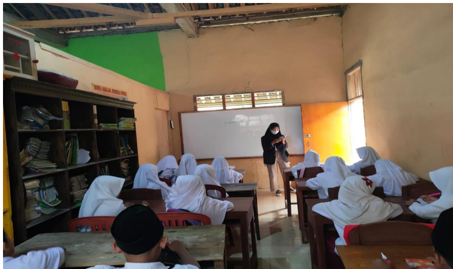
Gambar 2.3 Kegiatan Bersosialisasi Kepada Anak-anak SD Wawasan

Kegiatan yang telah dilakukan selanjutnya adalah pemberian sosialisasi kepada anak-anak SD. Dengan tujuan untuk mengajarkan anak-anak terbiasa menabung sejak dini agar mereka dapat mengatur keuangan dengan baik, dapat mengajarkan berhemat, dan lebih mudah dalam mengelola keuangan ketika sudah dewasa nantinya.