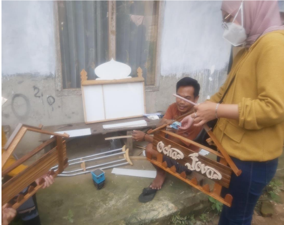
Gambar 10. Hasil proses pembuatan kerajinan kayu