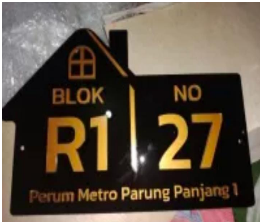
Gambar 6. Nomor rumah hasil dari pengrajin UMKM kayu

Berdasarkan kegiatan yang sudah dilakukan Pas Awal survey ke UMKM kayu pada Agustus 2022 banyak hambatan tentang masalah pemasaran alat dan bahan baku yang kurang memadai. Berdasarkan kegiatan yang sudah dihasilkan, oleh pengrajin UMKM kayu menghasilkan sebuah kerajinan yang sangat unik yaitu nomor rumah dan kotak tisu