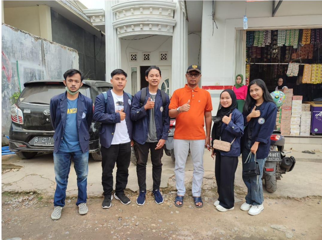
Gambar 8. Kunjungan ke Desa Baru Ranji

Berikut gambar dokumentasi yang diambil selama melakukan Praktek Kerja Pengabdian Masyarakat :