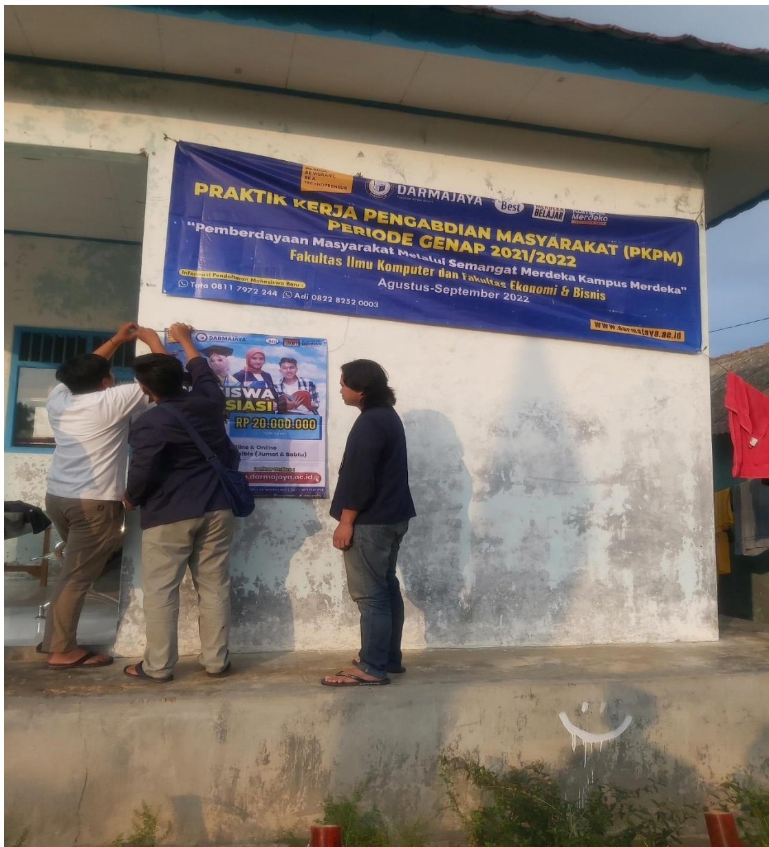
Gambar 9. Proses Pemasangan Banner