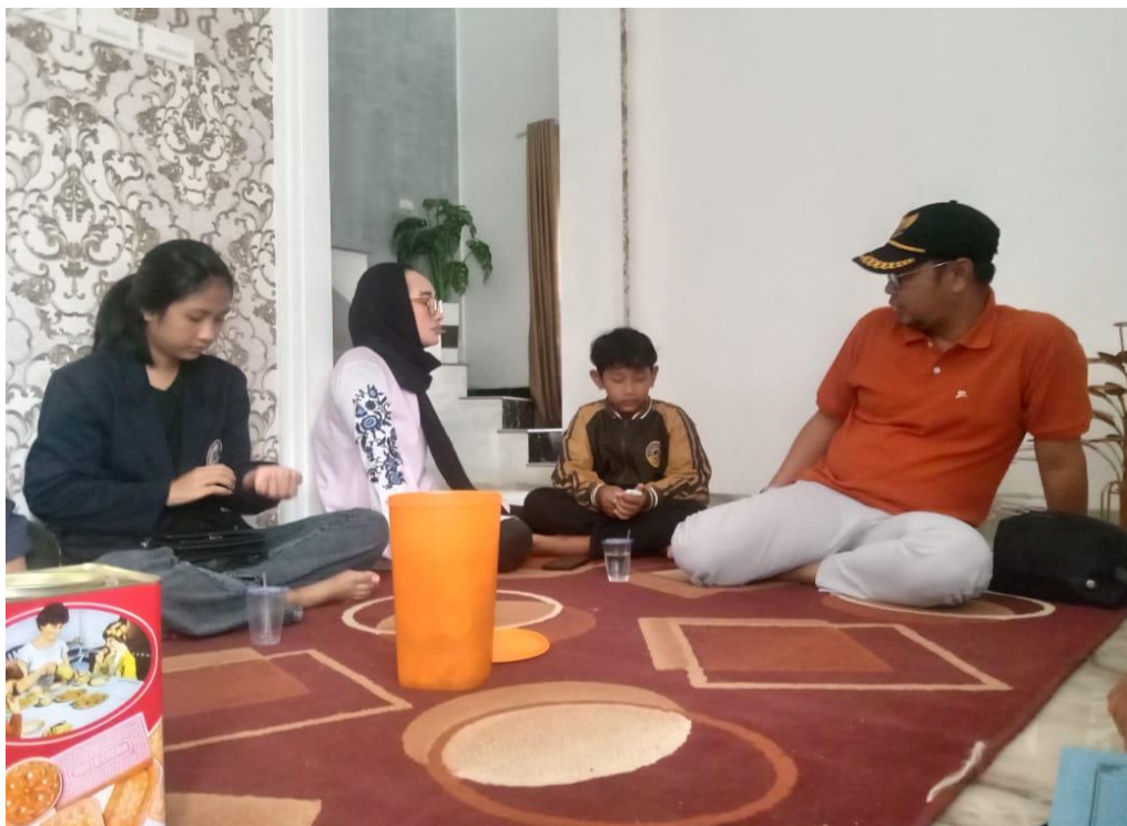
Gambar 11. Silaturahmi ke rumah kades Baru Ranji