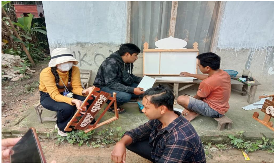
.Gambar 1. Kunjungan ke UMKM kayu

Kunjungan yang dilakukan ke UMKM kayu pada tanggal 10 Agustus 2022 adalah untuk mengetahui apa saja hambatan yang dialami pada UMKM kayu