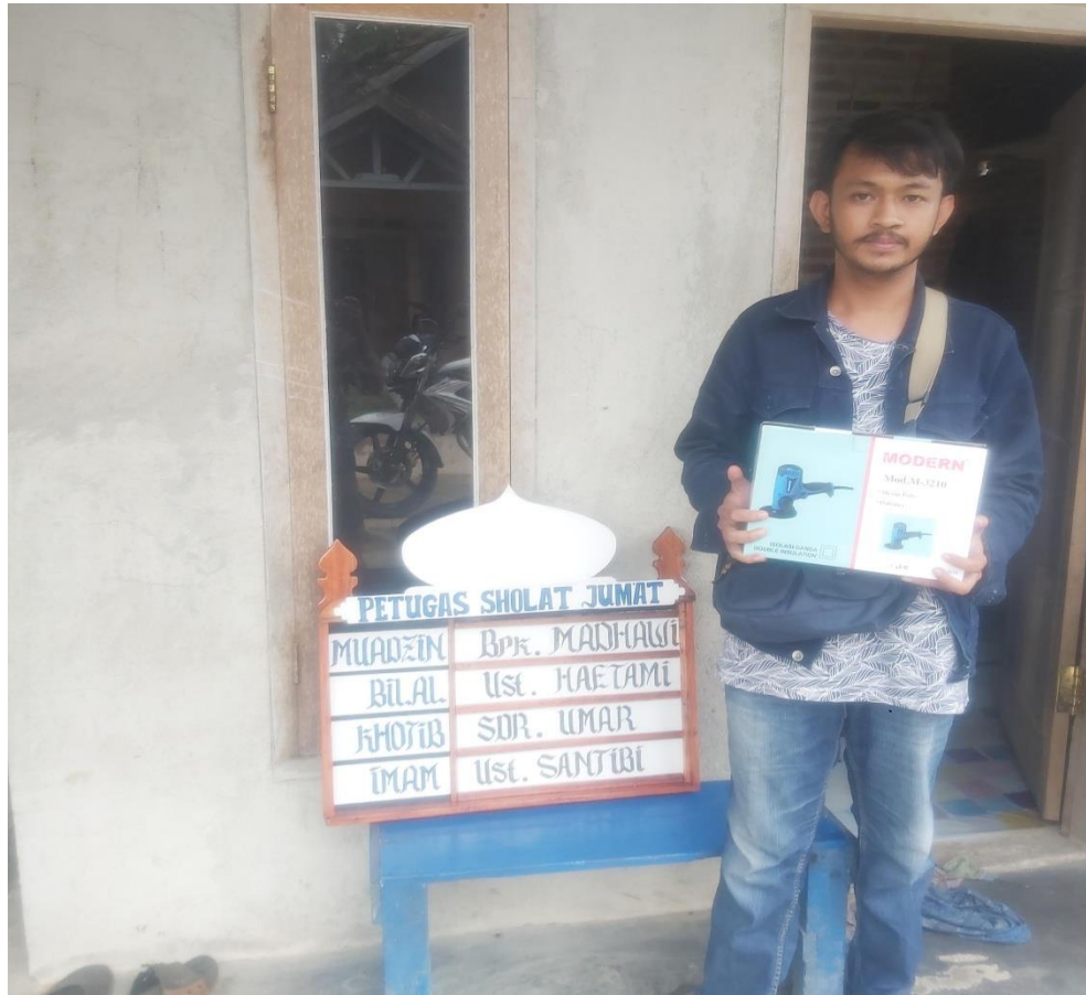
Gambar 12. Penyerahan Alat UMKM