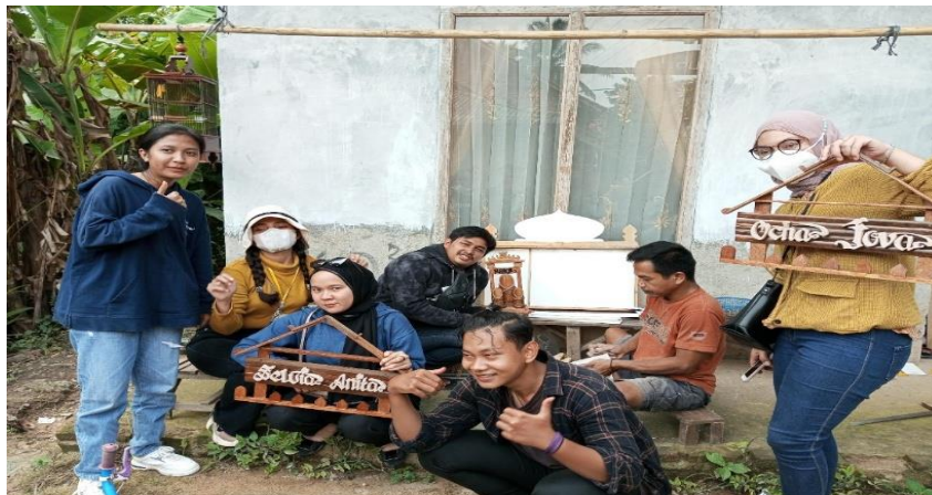
Gambar 2.Survey kebutuhan kayu dan diskusi

Kunjungan yang dilakukan pada tanggal 10 Agustus 2022 ke UMKM kayu ini untuk mengecek apa kebutuhan barang yang di perlukan untuk UMKM kayu dan memperluas potensi pemasaran UMKM tersebut.