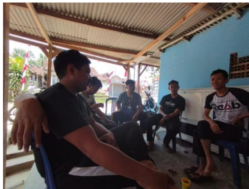
Gambar 3. Diskusi membuat rencana pemasaran UMKM kayu

Setelah melakukan survey ke UMKM kayu kami, menemukan permasalahan yang menghambat dalam proses pemasaran yaitu, minim nya cara pemasaran dan minim nya alat untuk proses pembuatan kerajinan UMKM kayu itu dan kami mendiskusikan masalah tersebut bersama pembimbing lapangan kami dan direktur BUMDES (Ranji Sejahtera) untuk membelikan alat ukir kayu dan kami membuatkan akun media sosial yaitu akun Shopee dengan ada nya akun Shopee itu bisa meluaskan pemasaran kerajinan UMKM kayu ke berbagai daerah yang ada di Indonesia.