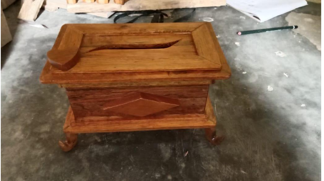
Gambar 7. Wadah tisu hasil dari pengrajin UMKM kayu