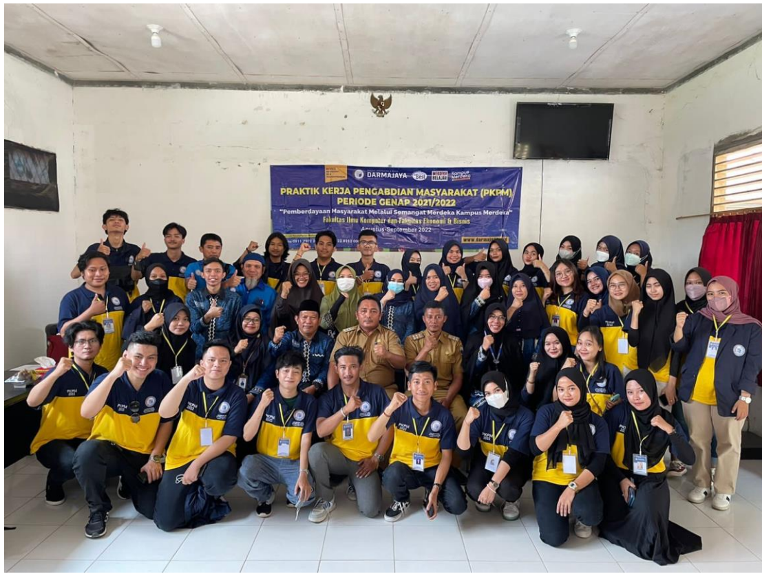
Gambar 2. pelepasan di kecamatan tanjung bintang Lampung selatan