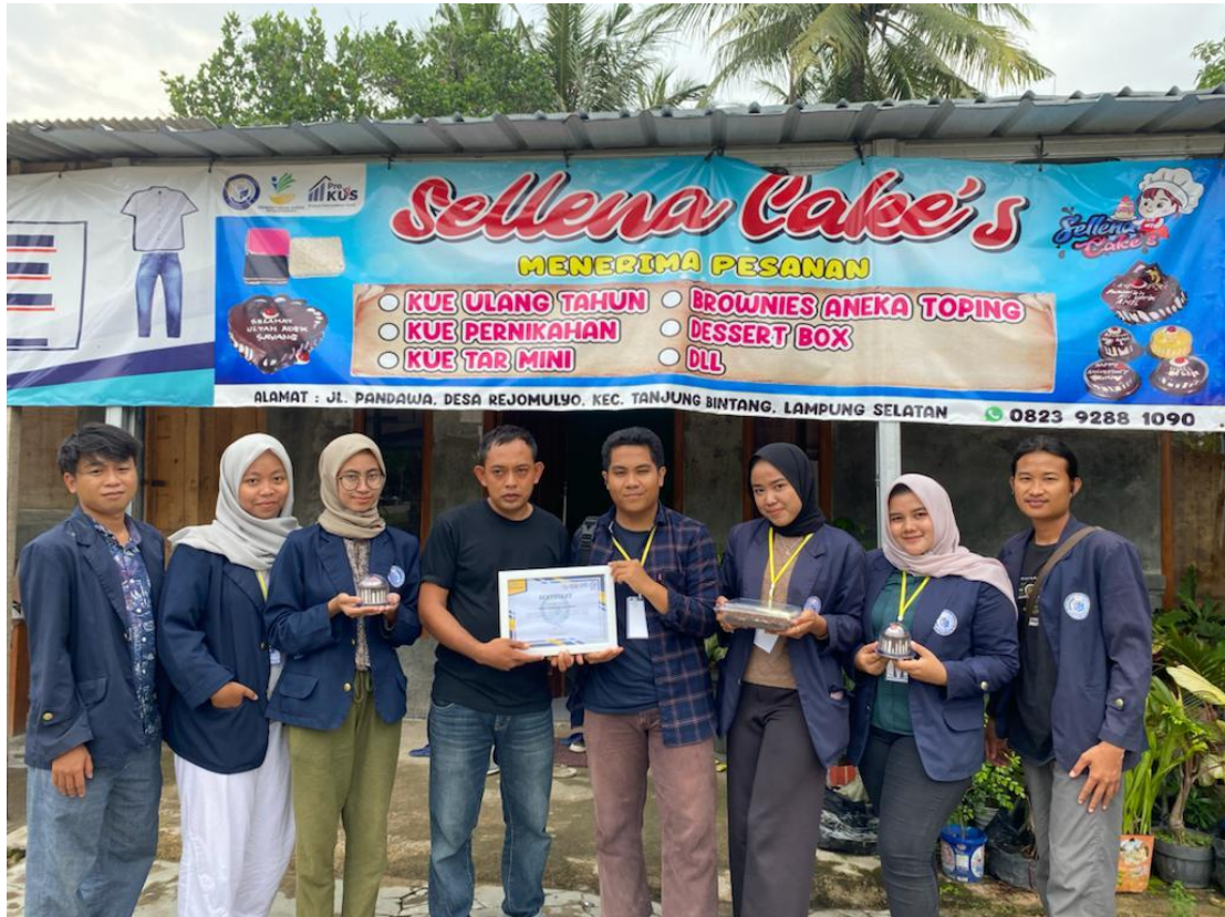
Gambar 1 penyerahan piagam terimakasih mahasiswa kepada pemilik UMKM