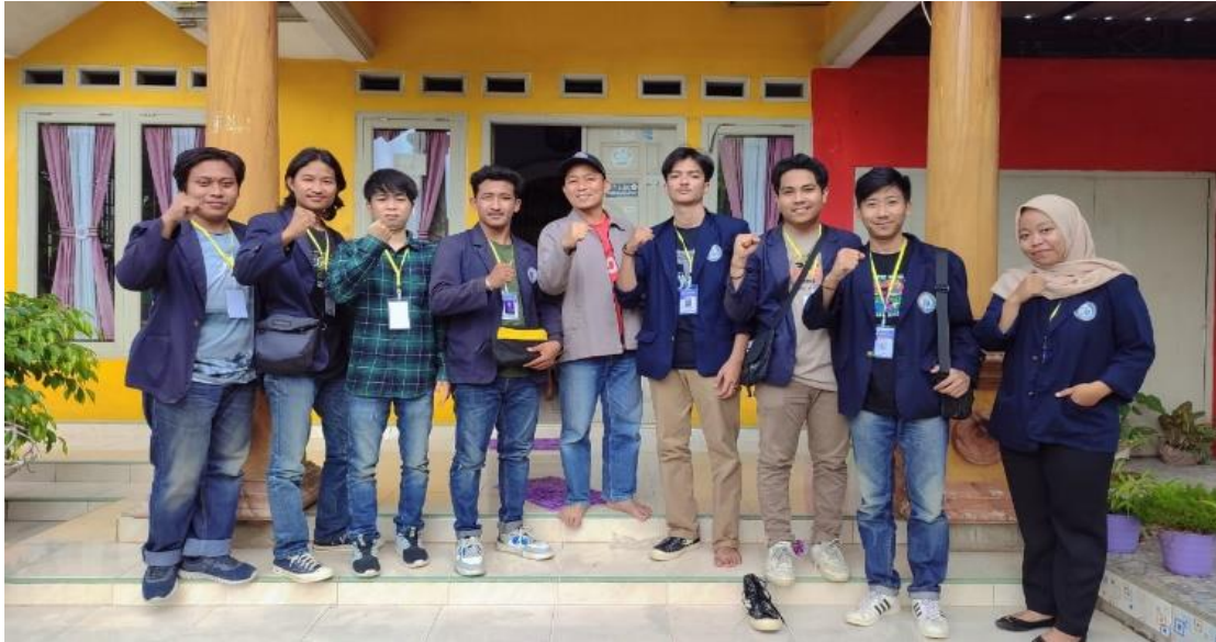
Gambar 10. Foto bersama kepala Desa Rejomulyo