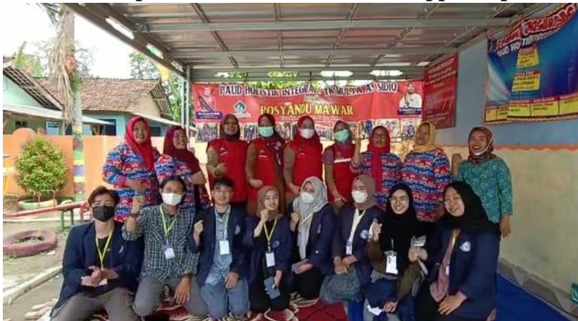
Gambar 5. kegiatan stunting gizi posyandu mawar