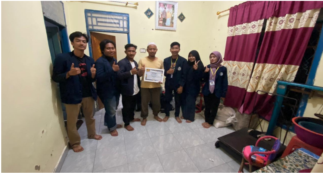
Gambar 8. Memberikan piagam terimakasih kepada pemilik UMKM KOPI CAP DUA JEMPOL