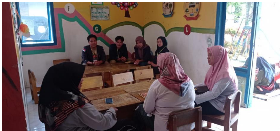
Gambar 3. memberikan masukan tentang stunting