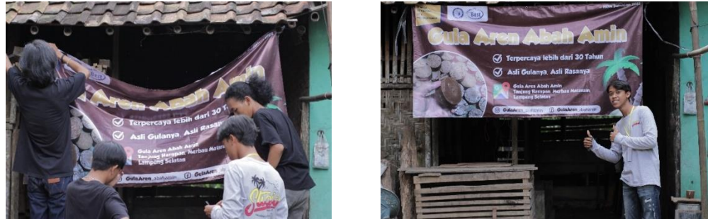
Gambar 2.3.4 Pemasangan pamphlet di Rumah Produksi Abah Amin.

untuk ukuran Banner yang kami buat 1x2, hanya sebagai contoh serta meriset kebiasaan mata konsumen di pasaran.