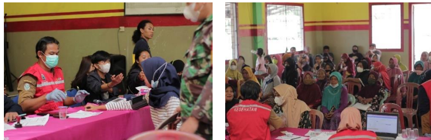
Gambar 2.3.10 Pemberian Vaksin Covid 19 Dosis 2 dan 3

Pemberian vaksin adalah proses untuk membuat seseorang imun atau kebal terhadap suatu penyakit. Proses ini dilakukan dengan cara menyuntikkan vaksin yang bertujuan untuk membentuk daya tahan tubuh terhadap penyakit tertentu.