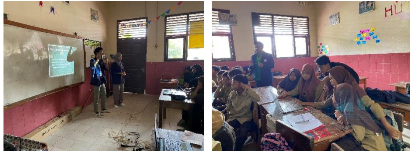
Gambar 2.3.7 Pemberian ilmu tentang pengenalan Teknologi Masakini