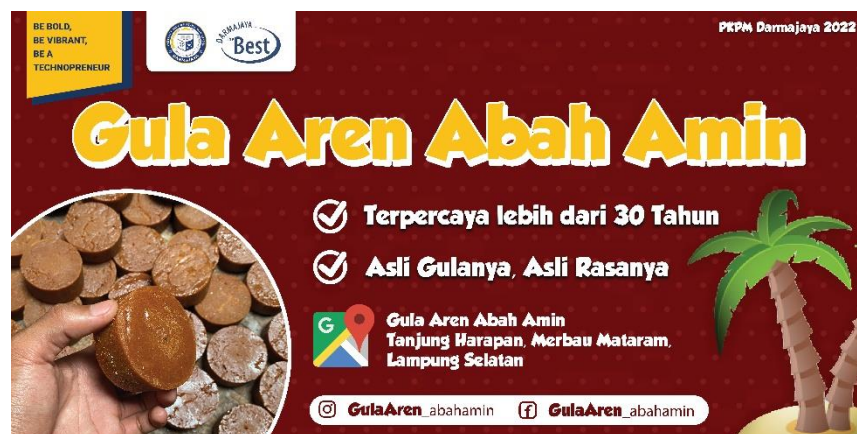
Gambar 2.3.3 Design Banner Gula Aren

Saya mencoba untuk membuat sebuah banner Gula Aren, yang mana tujuannya adalah untuk publiksi. Di sini saya membuat bagaimana caranya agar publiksai gula aren ini mencolok di lingkungan sekitar dan yang utama adalah untuk menimbulkan selling bagi masyarakat yg melihatnya.