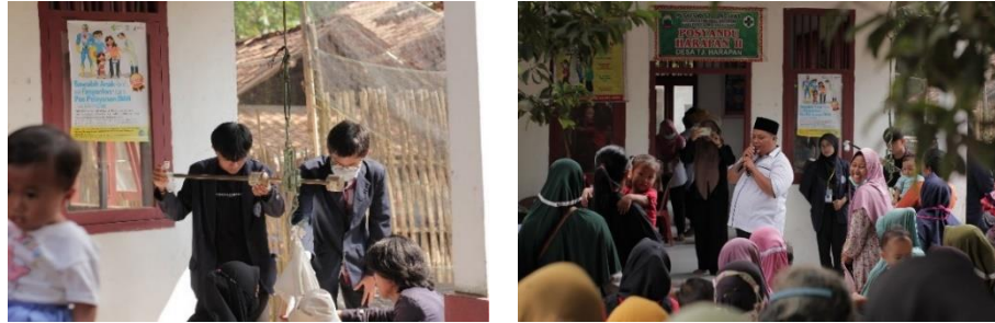
Gambar 2.3.9 Imunisasi terhadap Balita