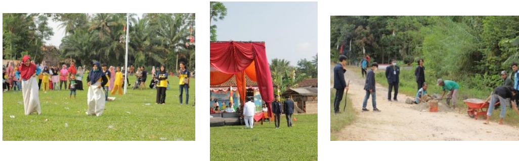
Gambar 2.3.6 Ikut andil dalam peringatan Hut RI ke 77 dan kegiatan Gotong Royong

Kami ikut andil dalam memperingati HUT RI ke77 di desa tanjung harapan dan Gotong royong. Kegiatan ini dilakukan untuk menjalin kedekatan dan silaturahmi dengan masyarakat. Dan lebih sedikitnya disini kita menuangkan cara pola pikir dan kreativitas yg telah kita dapat di bangku perkuliahan dalam mengadakan sebuah acara dengan musyawarah dan mufakat.