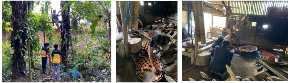
Gambar 2.3.2 tempat produksi Gula Aren Abah Amin