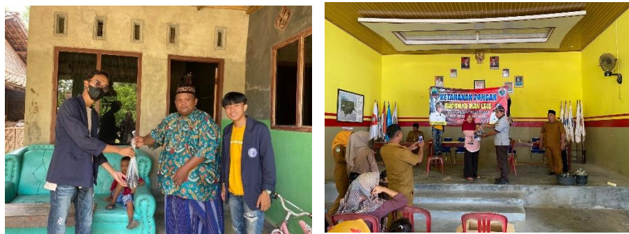
Gambar 2.3.8 Sosialisasi Ketahanan Pangan

kegiatan ketahanan pangan terhadap warga desa Tanjung Harapan, yang mana bertujuan untuk mencegah terjadinya stunting/gizi buruk yang sedang banyak terjadi di daerah lainnya. Disini kami dan perangkat desa membagikan pangan berupa protein ikan lele terhadap warga dan membantu masyarakat membuat kandang ternak ayam untuk ketahanan pangan desa.