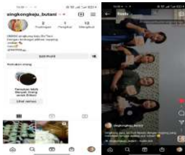
Gambar 2.5 Pemanfaatan media sosial sebagai sarana promosi

Pembuatan akun media sosial untuk UMKM ini tentunya akan dapat bermanfaat bagi pelaku usaha jika digunakan secara bijak dan kreatif. Instagram adalah media sosial yang kami gunakan sebagai sarana promosi produk UMKM baik dari pembuatan untuk konten, segi visual dan lain-lain. Hal ini diharapkan agar singkong keju Bu'Tani dapat dikenal oleh masyarakat luas.