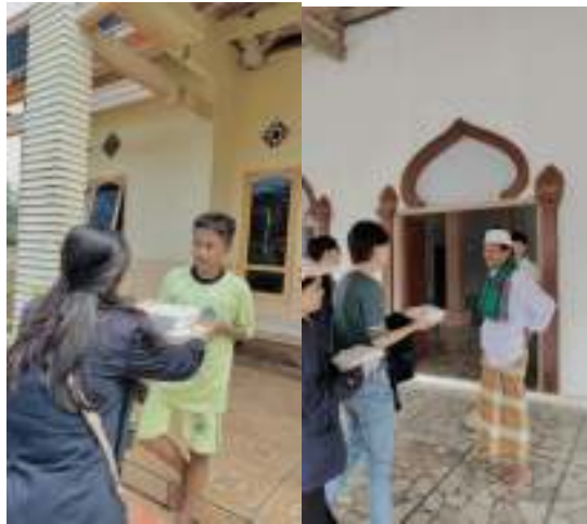
Gambar 2.12 Pembagian jum'at berkah

Kegiatan ini wajib dilakukan setiap seminggu sekali yang digagas oleh ibu Dian selaku ibu kepala desa.