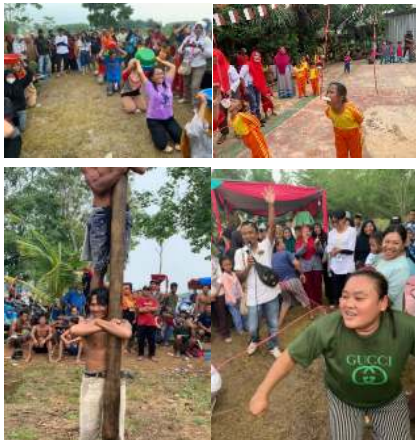
Gambar 2.9 Perayaan HUT RI Desa Karang Rejo