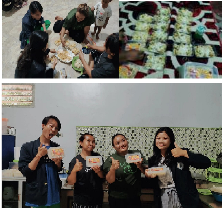
Gambar 2.3 proses pengemasan produk UMKM Singkong Keju