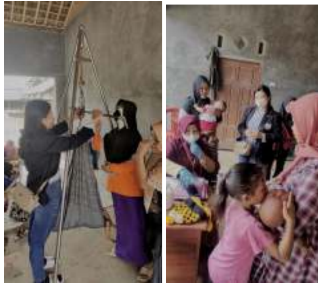
Gambar 2.7 Acara posyandu