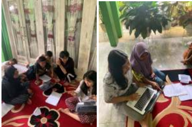
Gambar 2.11 Sosialisasi teknologi informasi