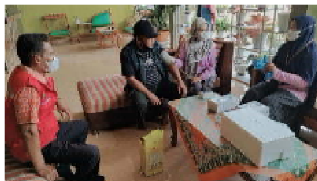
Gambar 2.8 Acara vaksinasi