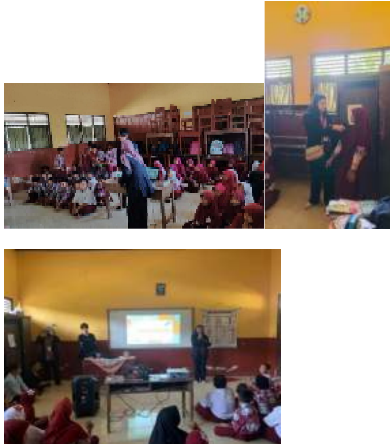
Gambar 2.10 Sosialisasi stop bullying