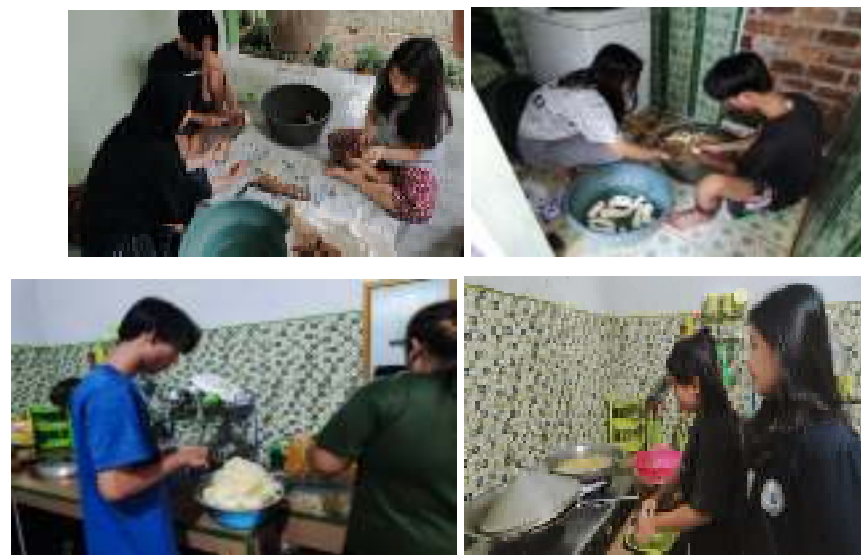
Gambar 2.2 proses pembuatan produk singkong keju