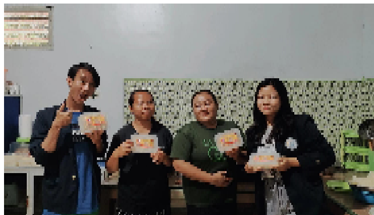
Gambar 2.1 kunjungan UMKM Singkong Keju

Dikarenakan UMKM Singkong ini berada di rumah ibu kepala desa yang kami tinggali ini memudahkan kami untuk meminta permohonan izin guna keberlangsungan acara serta dapat mempererat ikatan dalam membantu mengerjakan mengembangkan UMKM selama kegiatan PKPM.