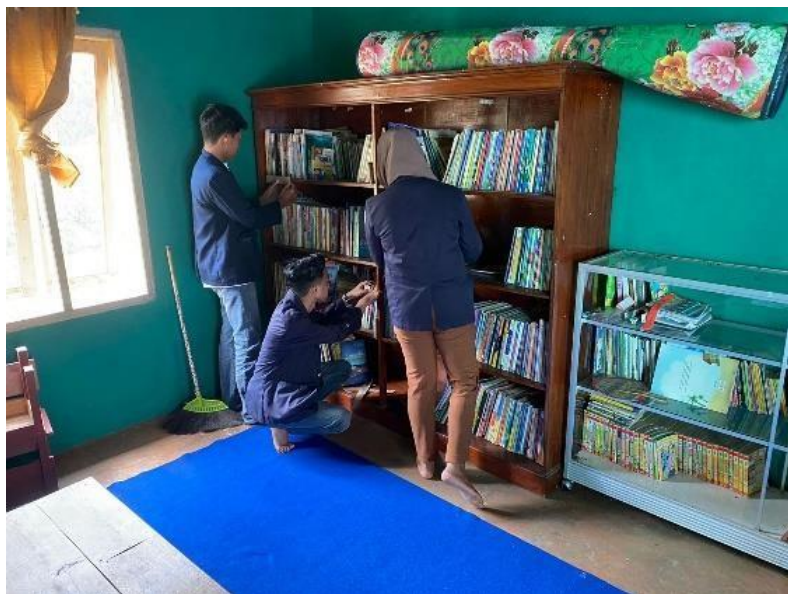
Gambar 2.17 Mengecek Buku Di Perpus