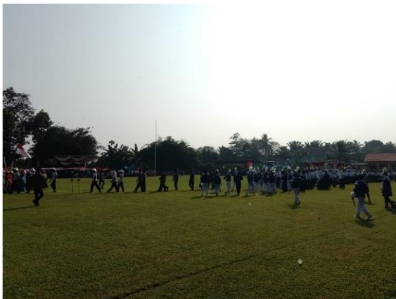
Gambar 2.9 Persiapan Upacara Bendera