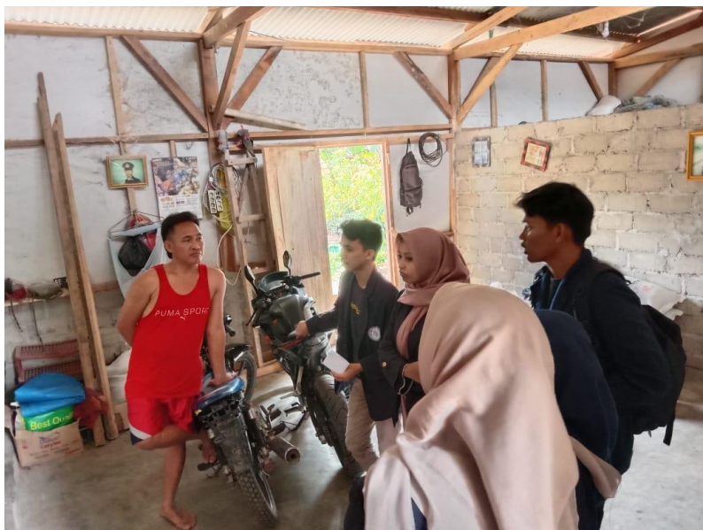
Gambar 2.16 Sosialisasi Ke Pemilik UMKM Kecambah