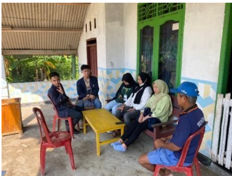
Gambar 2.13 Sosialisasi Ke Dusun 4