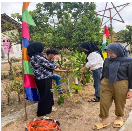
Gambar 2.6 Menggantungkan Balon Air ke Pohon