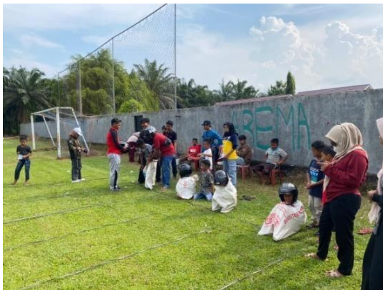
Gambar 2.11 Menjadi Panitia Lomba Balap Karung