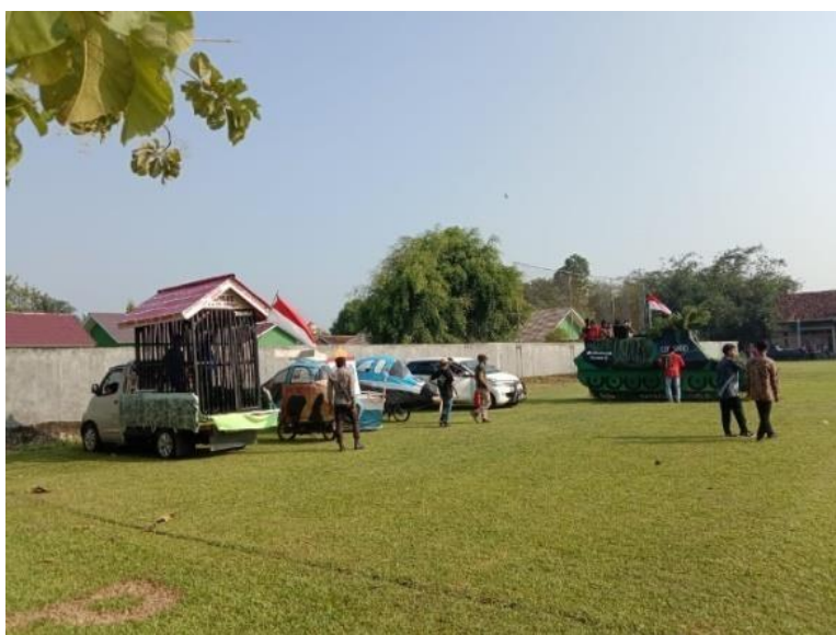
Gambar 2.10 Penampilan Karnaval