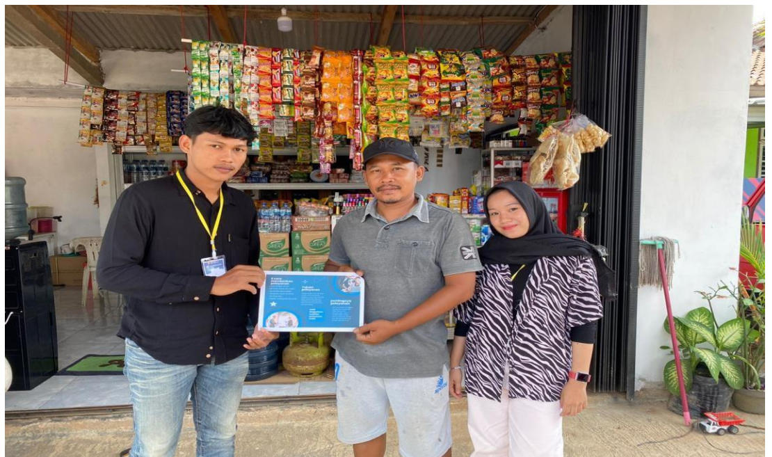
Gambar 2.1 sosialisasi terhadap retail

Dalam hal ini kami peserta PKPM melakukan sosialisasi mengenai pentingnya pelayanan pelanggan dan cara meningkatkan pelayanan pelanggan dengan cara membagikan brosur terhadap beberapa retail yang ada di desa margo rejo yang mana brosur tersebut berisikan tentang pentingnya pelayanan pelanggan dan memberikan pemahaman bagaimana cara meningkatkan pelayanan pelanggan yang baik, yang mana pelayanan pelanggan adalah suatu hal yang sangat penting bagi pelaku usaha dan bahkan pelayanan pelanggan bisa di jadikan senjata utama untuk bersaing dengan kompetitor lainnya.