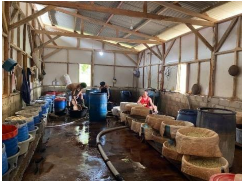
Gambar 2.15 Proses Produksi Kecambah

lebih kompetitif dan menghasilkan hasil produksi yang dapat bersaing dipasar.