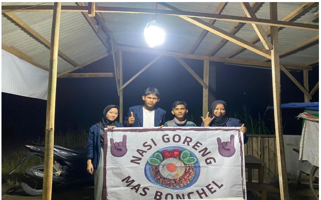
Gambar 2.2 membuatkan baner pelaku umkm

Dalam dunia bisnis istilah branding ialah suatu hal yang tidak asing lagi di kalangan para pebisnis maupun pengusaha. Branding ialah strategi bisnis yang tidak kalah penting di bandingkan strategi bisnis lainnya, didesa margorejo kami mengunjungi salah seorang penjual nasi goreng yang mana penjual nasi goreng tersebut belum memahami branding oleh karena itu kami memberikan pemahaman mengenai pentingnya branding terhadap usaha yang pelaku usaha miliki dan kami pun tidak hanya memberikan pemahaman, kami juga mengarahkan pelaku usaha untuk menggunakan media mini baner untuk pelaku usaha tersebut sehingga pelaku usaha mempunyai identitas yang mana identitas tersebut akan mudah dikenali dan mudah di ingat oleh konsumen maupun calon konsumen.