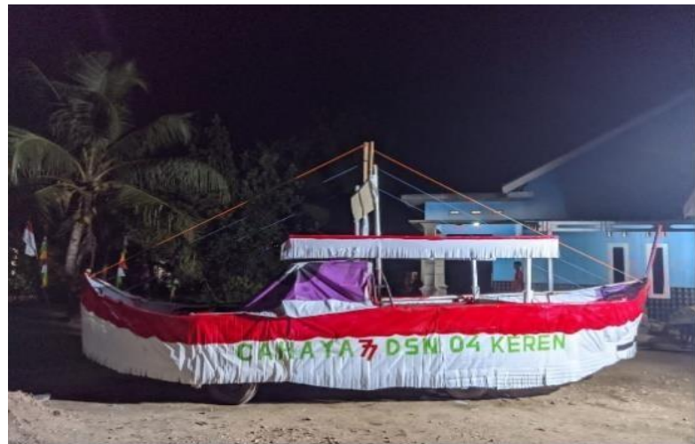
Gambar 2.4 Kendaran Karnaval