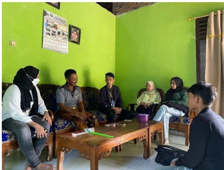
Gambar 2.12 Sosialisasi Ke Dusun 1