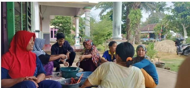
Gambar 2.5 Membuat Hiasan Dari Plastik & Air