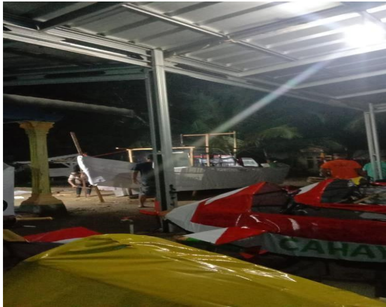
Gambar 2.3 Proses Pembuatan kendaraan karnaval

Setiap malam sebelum penyambutan Hut RI Ke 77. Setiap dusun di Desa Margo Rejo berlomba – lomba memeriahkan Hut RI Ke 77 dengan membuat kendaraan karnaval. Dengan berbagai kendaraan yang dimodifikasikan dengan sangat kreatif.