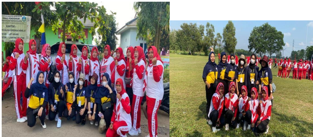
Gambar 2.3. Lomba Senam Jantung Sehat