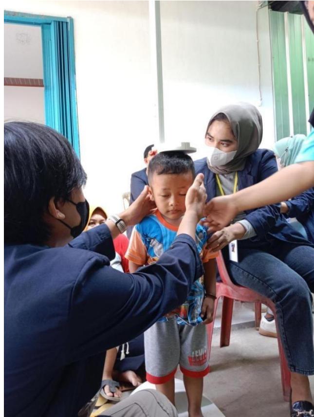
Gambar 11. Berpartisipasi dalam kegiatan posyandu