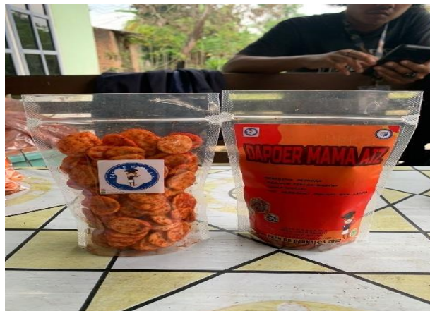
Gambar 1. Pelatihan Diversifikasi Packaging