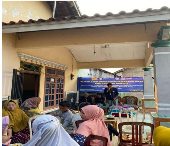
Gambar 2. Pelatihan Diversifikasi Produk Tahu