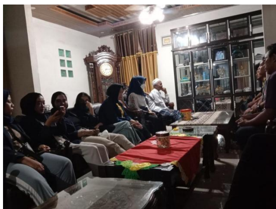
Gambar 6. Kunjungan serta koordinasi kerumah Kades di Desa Sinar Rejeki