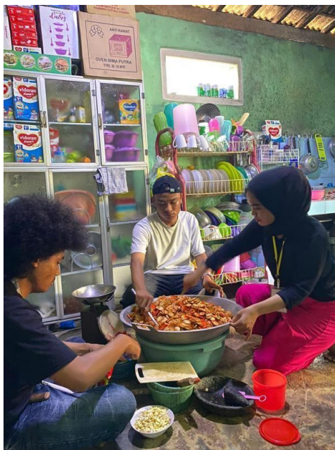
Gambar 18. Ikut dalam proses pembuatan Kerupuk Seblak