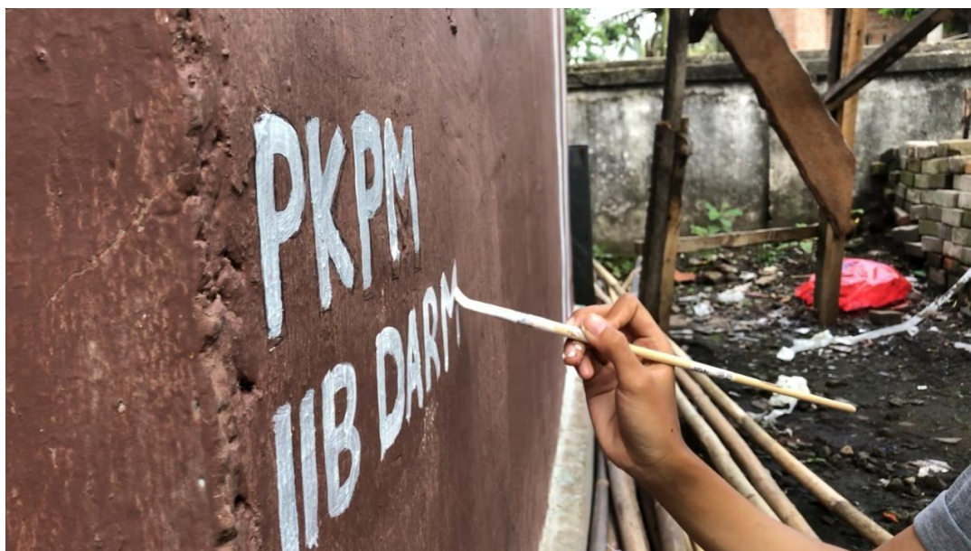
Gambar 21. Pemberian kenang-kenangan berupa pengecatan tugu di dusun Sumber Bakti