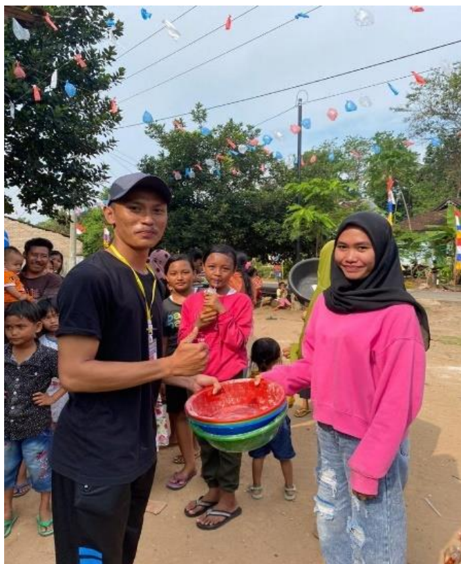
Gambar 14. Berpartisipasi kegiatan lomba di dusun Sri Mukti