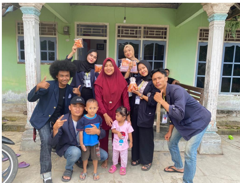
Gambar 19. Ikut serta dalam melakukan pemasaran kerupuk seblak