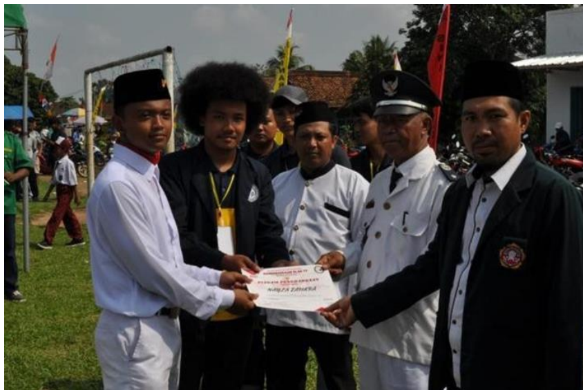
Gambar 12. Mengikuti upacara HUT RI dibalai desa dan Pembagian sertifikat