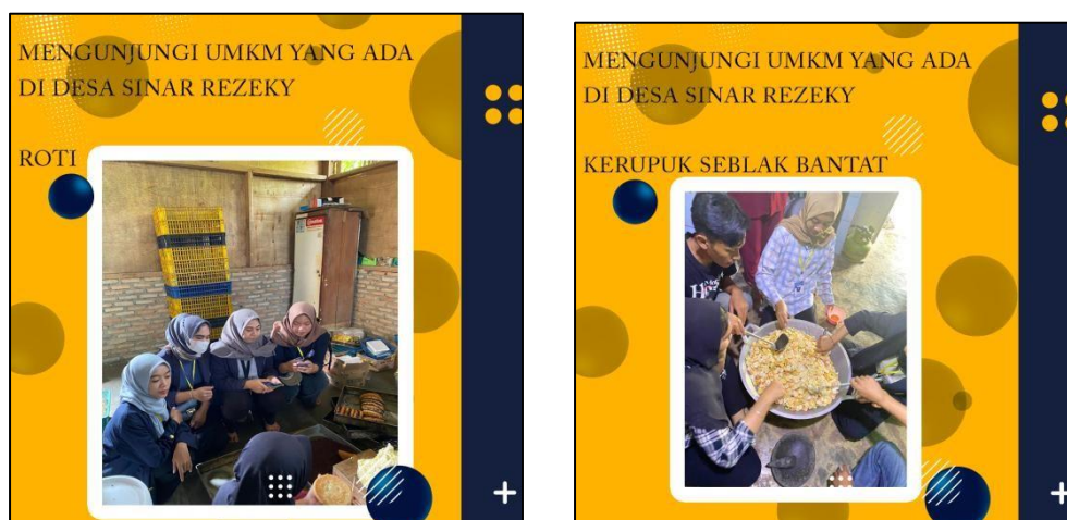
Gambar 8. Survey potensi UMKM yang ada didesa sinar rejeki