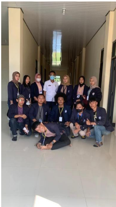
Gambar 9. Kunjungan dan Koordinasi dengan UPT puskesmas dalam membahas program stunting