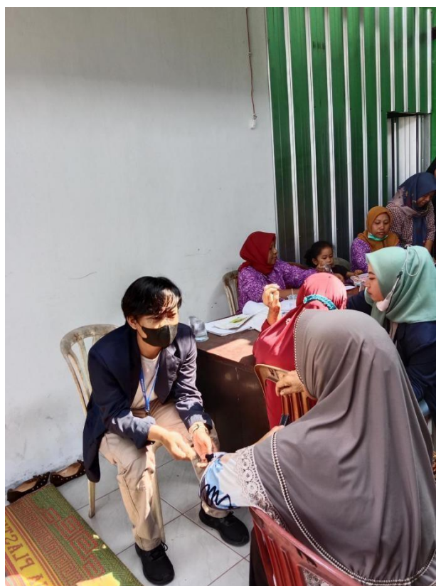
Gambar 17. Sosialisasi pencegahan stunting pada anak