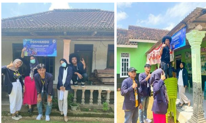
Gambar 5. Pemberian dan Pemasangan Banner Posyandu