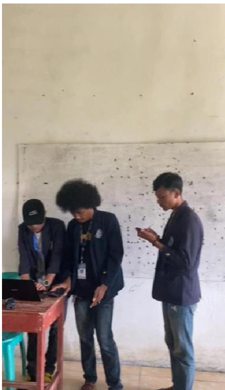
Gambar 20. Sosialisai Literasi digital di Smk Gema Karya