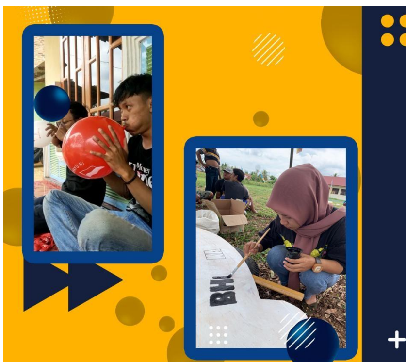
Gambar 15. Berpartisipasi kegiatan lomba di dusun Sri Mukti