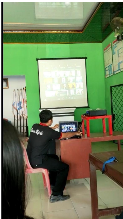
Gambar 7. Ikut serta pelatihan zoom digital marketing ibu-ibu PKK di balaidesa