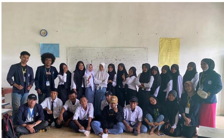
Gambar 4. Sosialisasi literasi digital SMK Gema Karya