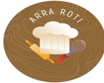
Gambar 6: Logo ARRA Roti