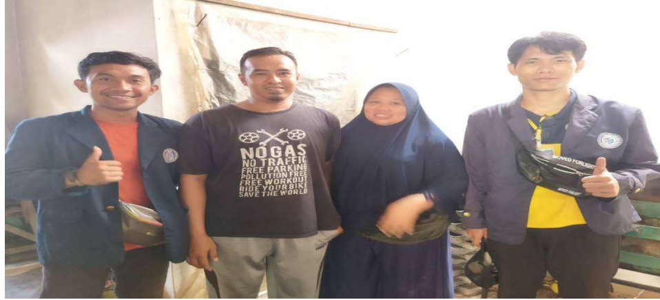
Gambar 3 : Program UMKM Untuk Meminta Perijinan

Memintan izin untuk melaksanakan PKPM selama 1 bulan dan berduksi terkait permasalahan yang terjadi di UMKM tersebut.