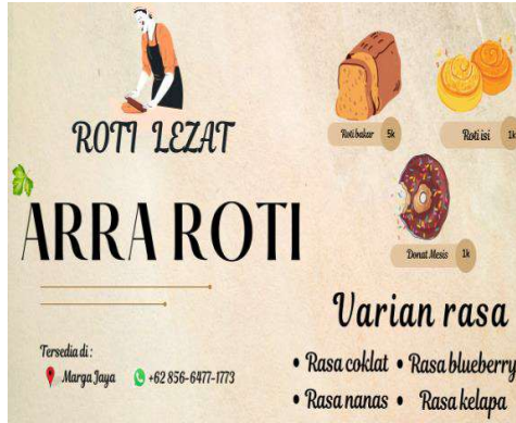
Gambar 5: Banner Arra Roti

Logo, dan banner merupakan sebuah identitas usaha yang sangat bermanfaat bagi sebuah usaha. Adanya logo, kartu nama, dan banner, pelanggan akan lebih mudah mengetahui informasi tentang usaha tersebut.