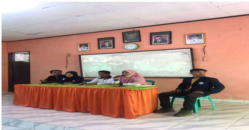
Gambar 4 : Program Sosialisai Kampus Di Sman 1 Merbau Mataram.

Hasil dari kegiatan sosialisasi ke SMA adalah mengenalkan kampus atau perguruan tinggi Darmajaya,serta memberikan wawasan pentingnya pendidikan kepada siswa siswi agar melanjutkan jenjang lebih tinggi tanpa takut terkendala biaya.