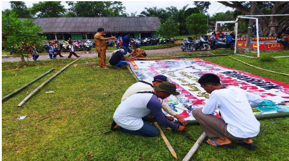
Gambar 2 : Kegiatan Warga Desa persiapan 17 agustus.

Membantu masyarakat dalam rangka menyambut hari kemerdekaan Indonesia yang ke 77 tahun.