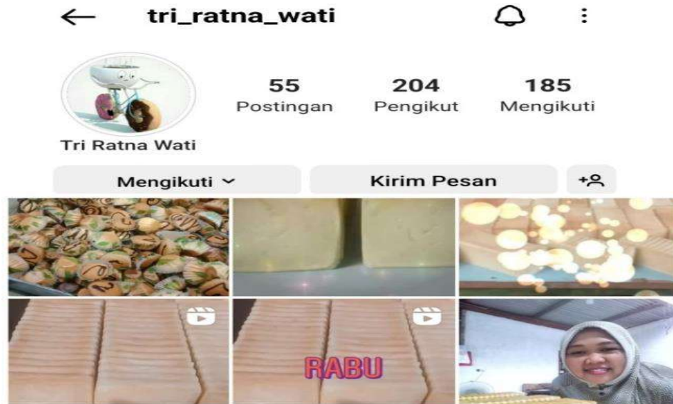
Gambar 8 : Pembuatan Akun Instagram

Pembuatan akun Instagram dan Facebook dapat memudahkan calon konsumen untuk membeli dan juga mengetahui waktu pembuatan Roti