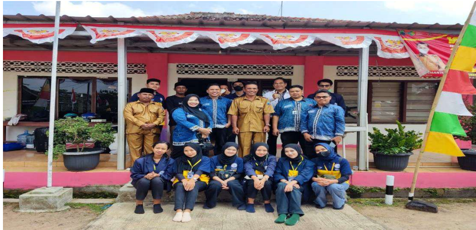
Gambar 1 : Bersama Wakil Seketaris Desa.

Meminta perizinan kepada aparat desa untuk melakukan kegiatan selama 30 hari untuk melakukan kegiatan PKPM di sekitar wilayah desa Talang Jawa.