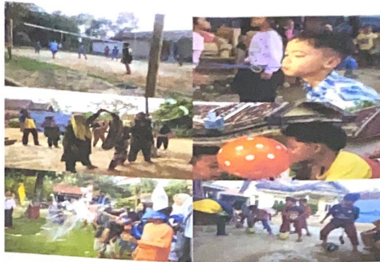
Gambar 2.4 Kemeriahan Lomba 17 Agustus di dusun 5 dan dusun 1

Selain itu 17 Agustus di meriahkan oleh berbagai macam lomba di desa Sidoharjo berteptan di dusun 1 dan dusun 5 yang diikuti oleh bapak-bapak, ibu-ibu sampai anak-anak.