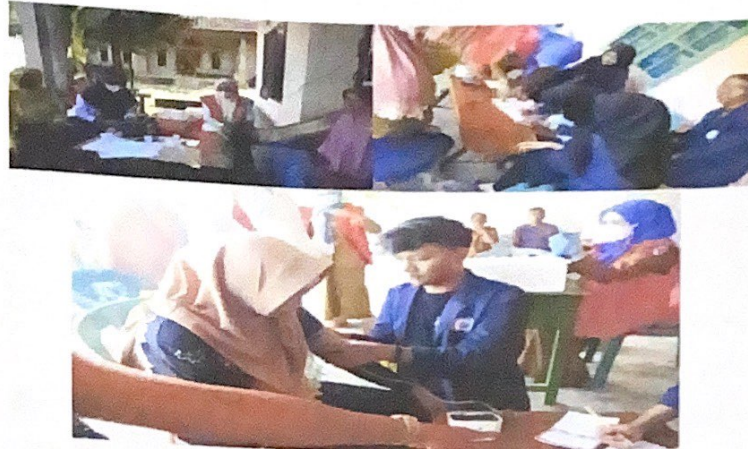
Gambar 2.6 Kegiatan vaksinasi di Desa Sidoharjo

Mengikuti dan membantu kegiatan vaksinasi covid 1,2 dan booster pada warga Desa Sidoharjo. Yang bertujuan untuk memenuhi kebutuhan vaksinasi covid warga sidoharjo bertepatan di dusun 4 dan di pasar sidoharjo