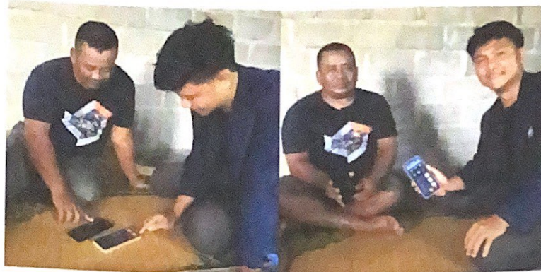
Gambar 2.2 Memperkenalkan aplikasi stroberi kasir

sangrai dapat memudahkan perhitungan kas secara terperinci dan efisien.