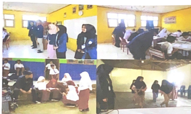
Gambar 2.5 Kegiatan belajar mengajar di SDN 01 Sidoharjo

Membantu kegiatan belajar mengajar, seperti mengajari pelajaran umum dan mengajari ekstrakurikuler salah satu nya menari