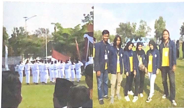
Gambar 2.3 Proses upacara 17 agustus di kantor kecamatan jati agung

Kegiatan ini di lakukan pada tanggal 17 Agustus 2022 untuk memperingati HUT RI Ke-77 Tahun, dengan melakukan upacara bendera di lapangan kecamatan jati agung lampung selatan.