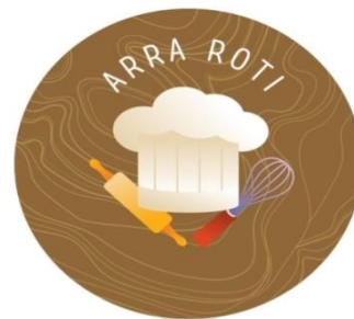
Gambar 5 Logo ARRA Roti