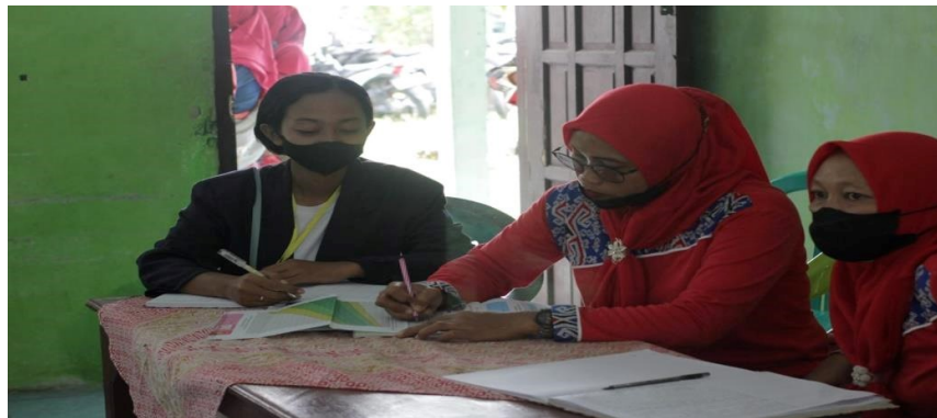
Gambar 2. Program kegiatan posyandu

Hasil dari kegiatan ini adalah penulis mengetahui cara memberikan layanan kesehatan kepada ibu, anak-anak, balita untuk imunisasi, gizi, pemberian vitamin A yang bisa mencegah Stunting pada anak-anak.