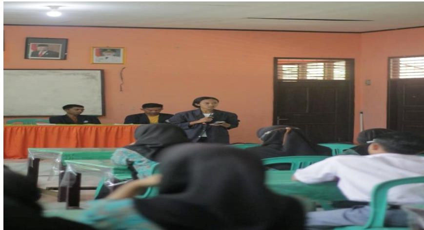
Gambar 3 Program sosialisasi Ke SMA 1 MERBAU MATARAM

Hasil dari kegiatan sosialisasi ke SMA adalah mengenalkan kampus atau perguruan tinggi Darmajaya,serta memberikan wawasan pentingnya pendidikan kepada siswa siswi agar melanjutkan jenjang lebih tinggi tanpa takut terkendala biaya.