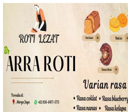
Gambar4 Banner Arra Roti

Logo, kartu nama, dan banner merupakan sebuah identitas usaha yang sangat bermanfaat bagi sebuah usaha. Adanya logo, kartu nama, dan banner, pelanggan akan lebih mudah mengetahui informasi tentang usaha tersebut.