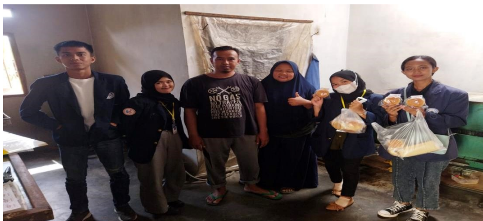
Lampiran 7 Kunjungan dan izin ke pemilik UMKM ARRA Roti