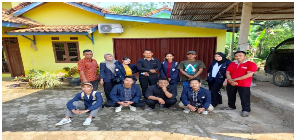
Lampiran 3 proses izin dan survey ke desa Talang Jawa