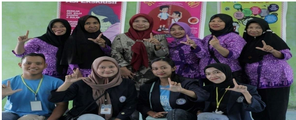
Lampiran 16 Membantu ibu kader posyandu marga sehat 1