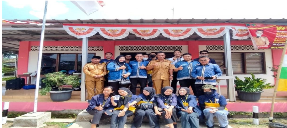
Lampiran 5 kegiatan pelepasan mahasiswa di kantor balai desa