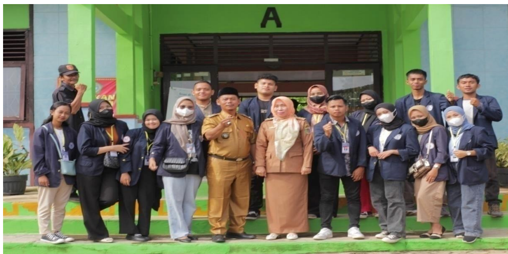
Lampiran 14 Kunjungan ke SMA 1 Merbau Mataram bersama bapak Kepala Desa