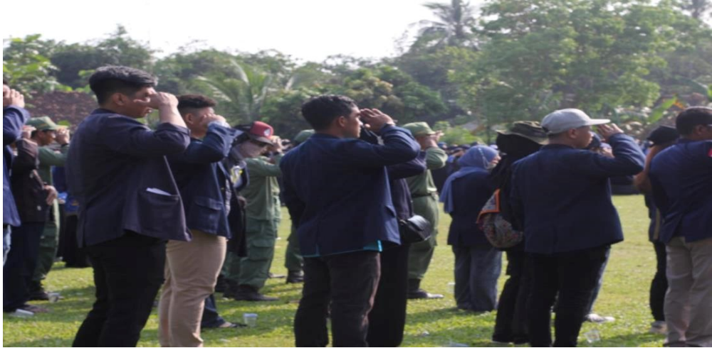
Lampiran 8 kegiatan upacara 17 agustus 2022