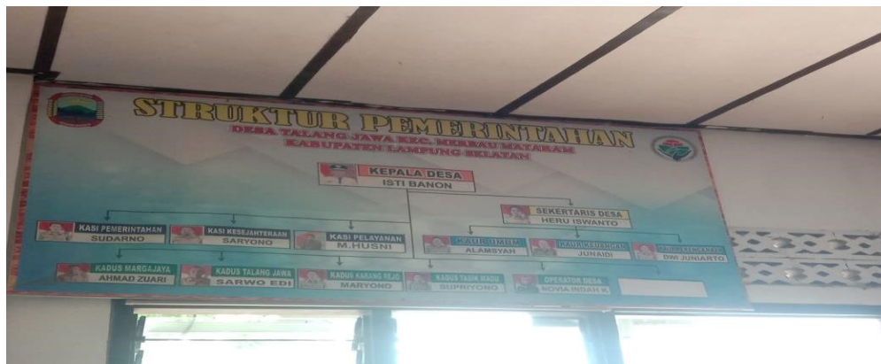
Lampiran 2 Struktur pemerintahan Desa Talang Jawa