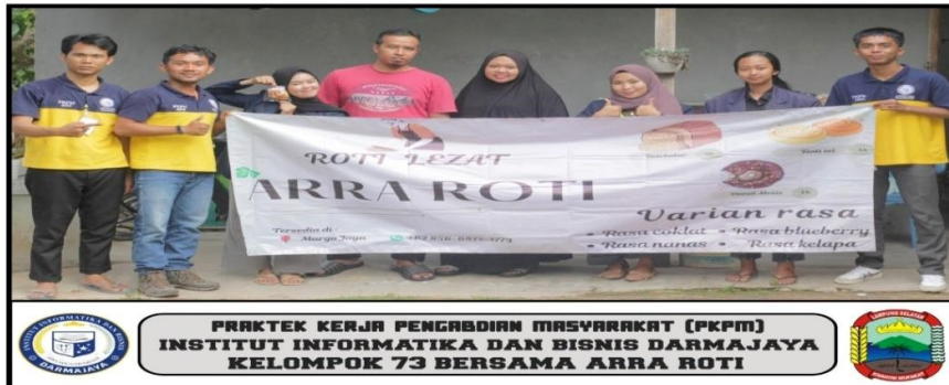
Lampiran 12 kegiatan penyerahan banner UMKM