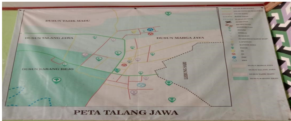
Lampiran 1 Peta wilayah Desa Talang Jawa