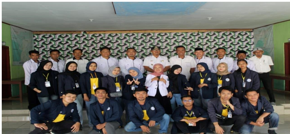
Lampiran 17 Foto bersama dengan Aparat Desa Talang Jawa