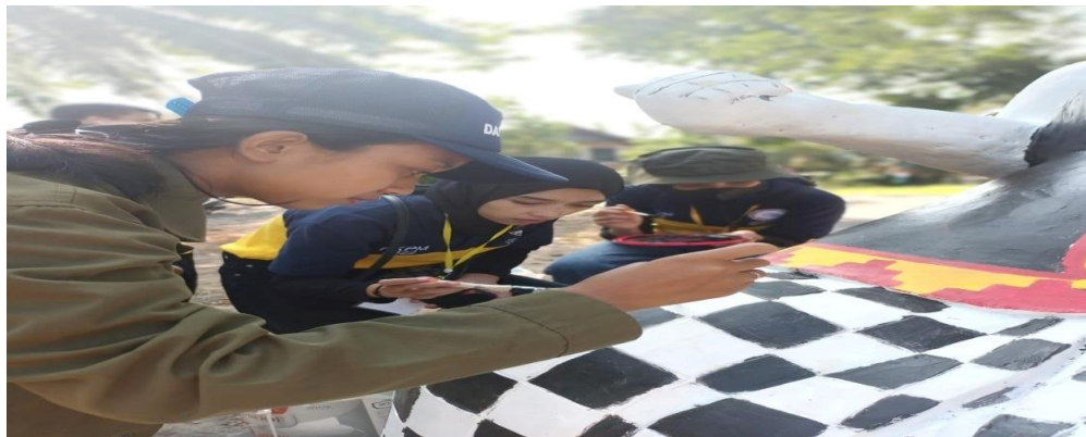
Lampiran 6 Membantu Menghias Dan Melukis Gapura Di Lapangan Desa