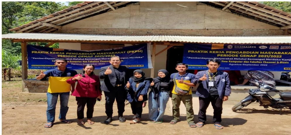
Lampiran 13 Kunjungan Dosen Pendamping Lapangan