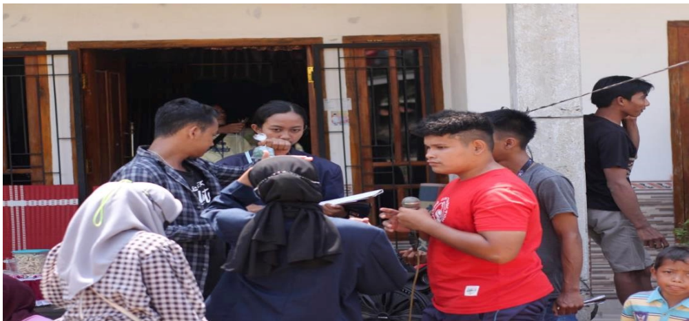
Lampiran 9 Membantu kegiatan perlombaan di dusun