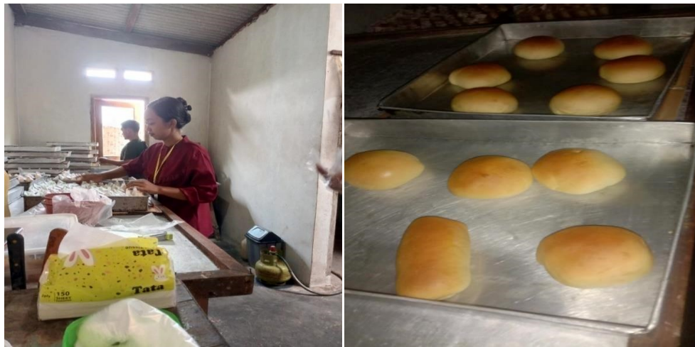
Lampiran 10 kegiatan produksi di UMKM ARRA Roti