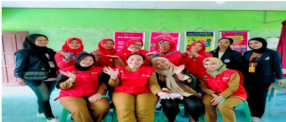
Lampiran 11 kegiatan posyandu bersama ibu bidan dan kader Marga Sehat II