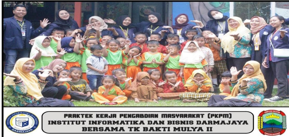
Lampiran 15 Kunjungan ke TK Bina Mulya II