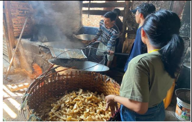
Membantu penggorengan kerupuk