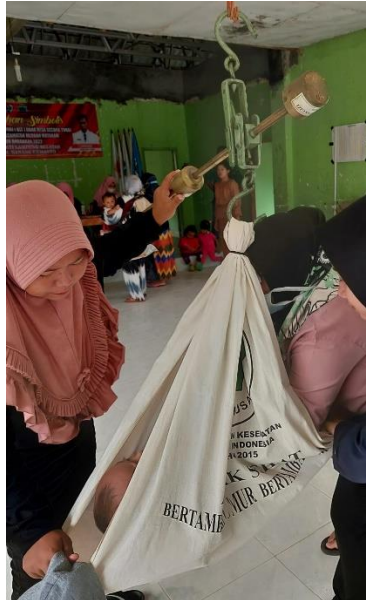
Membantu kegiatan posyandu