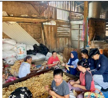
Membantu proses produksi kerupuk