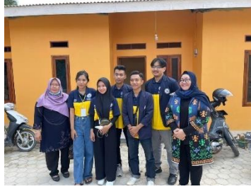
Foto bersama dikediaman pkpm dengan dosen pembimbing lapangan