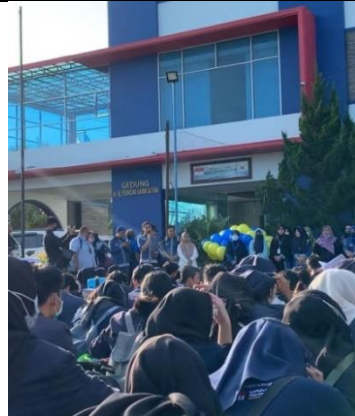
Pelepasan mahasiswa PKPM di Kampus IIB Darmajaya