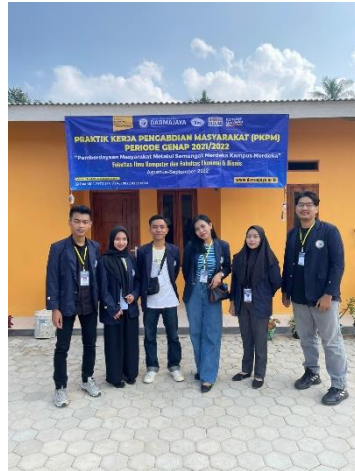
Survei lokasi PKPM