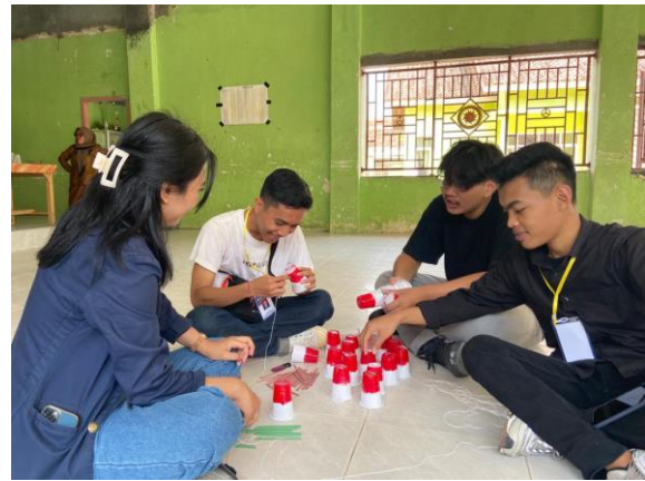
Persiapan 17 agustus