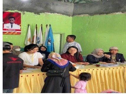
Membantu kegiatan di balai desa