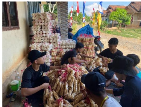
Membantu proses pengemasan produk