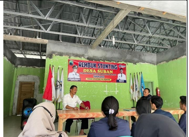
Penerimaan mahasiswa PKPM Darmajaya kepada aparat desa