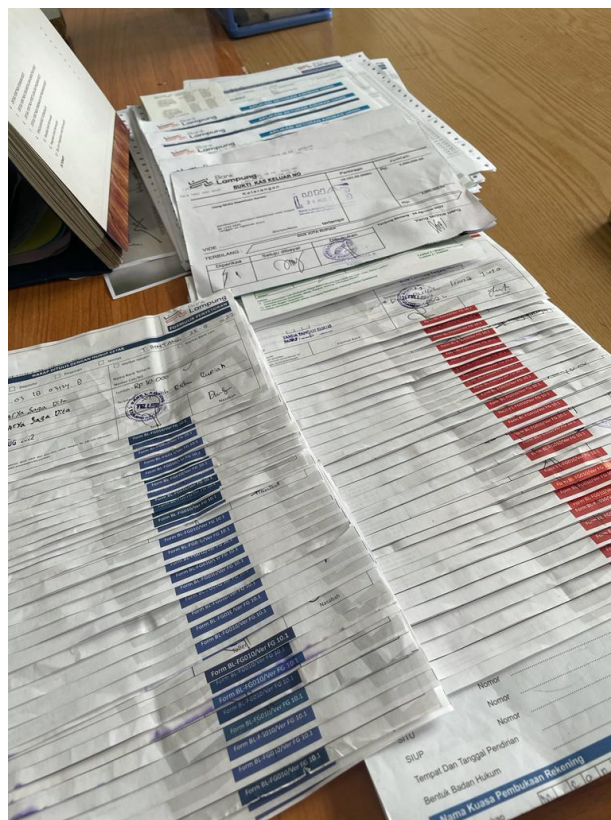
Gambar 4.2.2 Tampilan Arsip yang belum tersusun dengan rapi