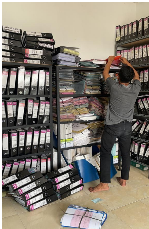
Gambar 4.2.4 Tampilan arsip yang telah dikelola dan dipelihara dengan baik dan rapi sehingga nantinya mudah jika ditemukan kembali