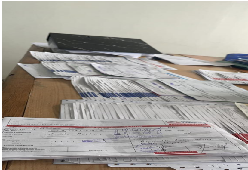
Gambar 4.2.1 Tampilan Arsip yang belum dikerjakan Setiap harinya