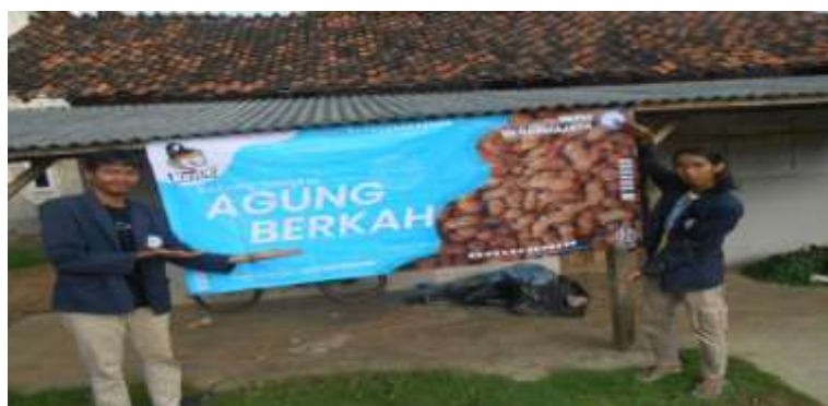
Gambar 2. 5 Melakukan sosialisasi Digital Markerting pada UMKM