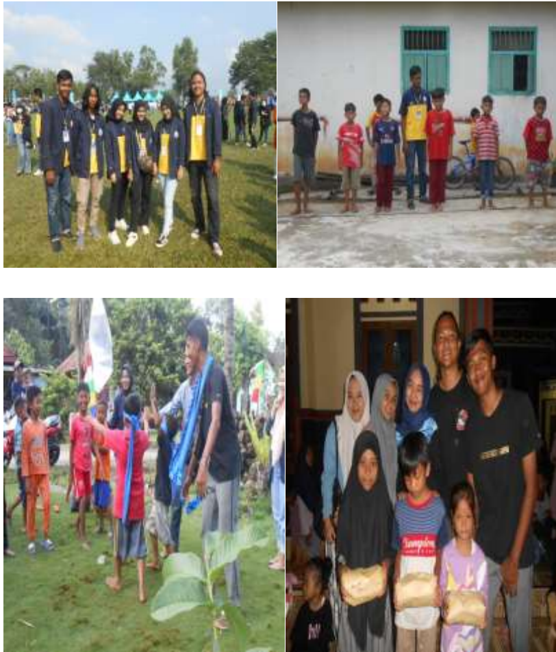
Gambar 2. 3 lomba 17 Agustusan di dusun IV dan I

Menghadiri upacara di kecamatan dan melakukan kegiatan perlombaan. Terdiri dari perlombaan Gapple, voly terpal, pukul air, balap kelereng, balap karung, voly, estafet tepung, estafet karet, joget balon, makan krupuk, giring bola pakai terong, masukin paku dalam botol, dan estafet sarung. Bertempatan di dusun IV dan dusun I.