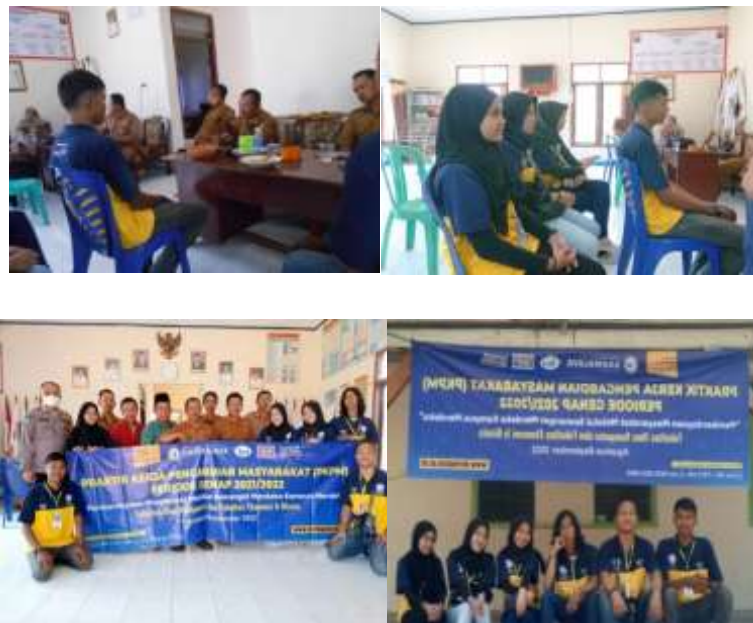
Gambar 2. 1 Penerimaan Mahasiswa PKPM IIB Darmajaya

Kegiatan penerimaan mahasiswa PKPM ini dilakukan pada saat kami sampai di Desa Sidoharjo. Penerimaan ini disambut dan diterima oleh Bapak Kepala Desa dan beberapa perangkat desa Sidoharjo. Penerimaan mahasiswa ini bertujuan untuk memberitahu beberapa perangkat desa bahwa terdapat mahasiswa PKPM yang melakukan pengabdian di Desa Sidoharjo.