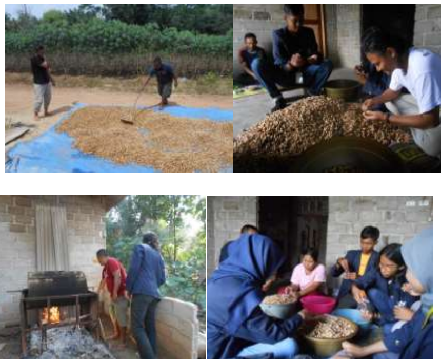
Gambar 2. 2 Proses Pembuatan Kacang Sangrai

Yang pertama harus dilakukan untuk pembuatan kacang sangrai ialah melakukan pencucian pada kacang sampai bersih agar tidak ada lagi tanah yang menempel pada kacang, kemudian lakukan penjemuran pada kacang supaya kacang menjadi kering, lalu lakukan penyortiran pada kacang yang busuk/tidak layak untuk di sangrai untuk menjaga kualitas rasa paa kacang tersebut, kemudian lakukan proses sangrai yang memakan waktu sekitar 2 sampai 3 jam agar kacang tersebut matang secara merata, lalu taruh kacang di tempat yang dingin diperlukan waktu 30 menit untuk proses selanjutnya, lalu melakukan packing pada kacang yang telah di dinginkan selama 30 menit tadi, setelah itu kacang dapat di pasarkan di wilayah sekitar Sidoharjo sampai perbatasan Lampung Timur.