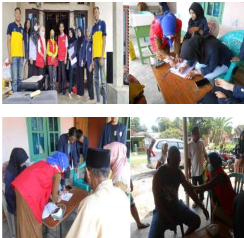
Gambar 2. 6 Membantu kegiatan vaksinasi covid 19

Kegiatan ini dilakukan dikarenakan warga desa Sidoharjo masih banyak yang belum divaksin. Kami membantu proses pelaksanaannya dengan membantu mendata, melakukan tensi dan mengukur pinggang.