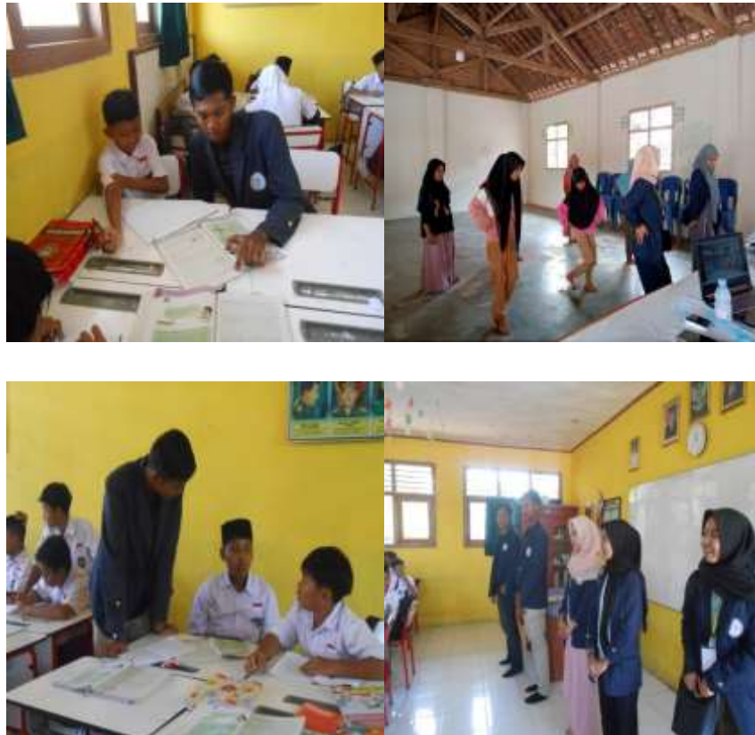
Gambar 2. 4 Melakukan bimbingan belajar dan mengajarkan seni tari

Kegiatan ini dilakukan karena pentingnya bimbingan belajar sejak dini pada siswa siswi SD N 1 Sidoharjo agar siswa siswi tersebut memiliki motivasi untuk terus semangat belajar dalam belajar dan kegiatan ekstrakurikuler seni tari dilakukan agar para siswa siswi memiliki bekal untuk seni tari.