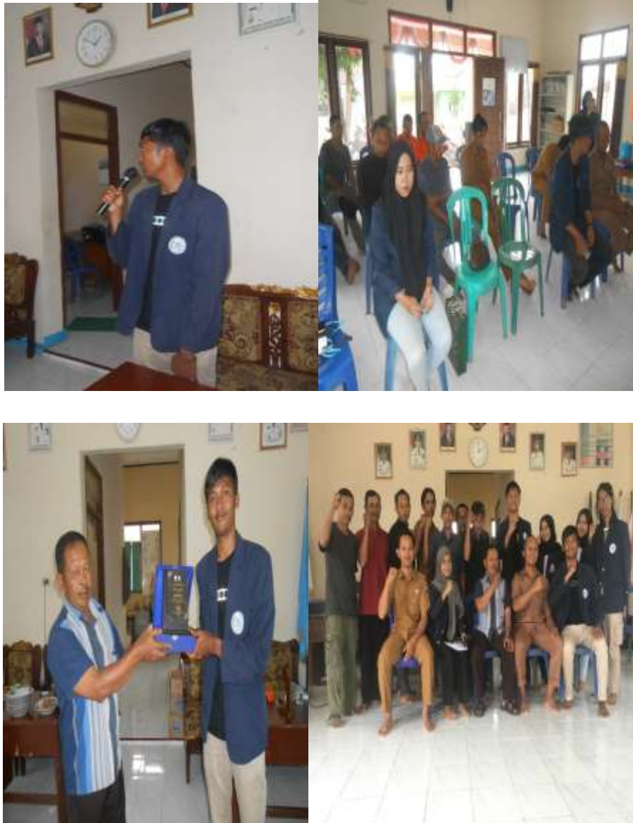
Gambar 2. 7 Acara perpisahan Mahasiswa PKPM dengan desa Sidoharjo

Kegiatan ini dilakukan di balai desa Sidoharjo dengan tujuan mengucapkan terimakasih telah menerima serta membimbing kami dalam kegiatan PKPM di Desa Sidoharjo.