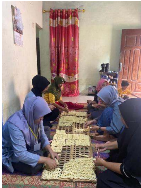
Gambar 2.5 Proses Membentuk Kelanting Menjadi Lingkaran