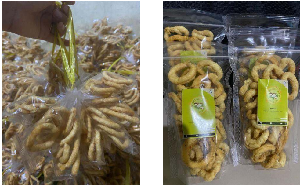
Gambar 2.6 Before After Kemasan Kelanting