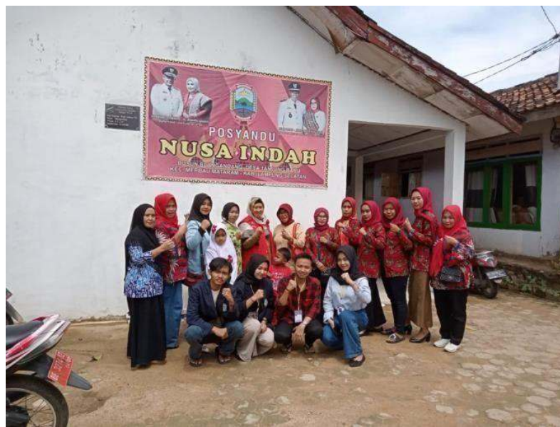
Gambar 2.9 Kegiatan Posyandu Nusa Indah