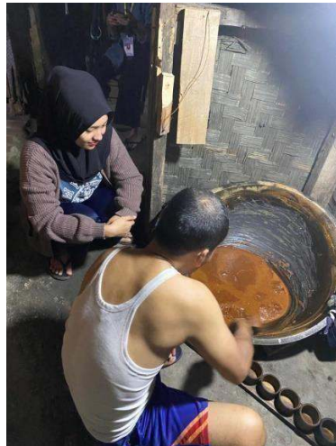
Gambar 2.11 Melihat Proses Pembuatan Gula Aren