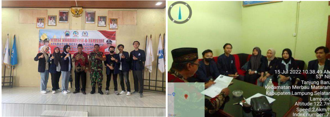
Gambar 2.2 Survei Lokasi PKPM Dengan Kepala Desa