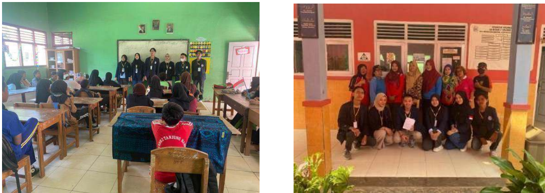
Gambar 2.3 Berkunjung Ke SD 2 Tanjung Baru