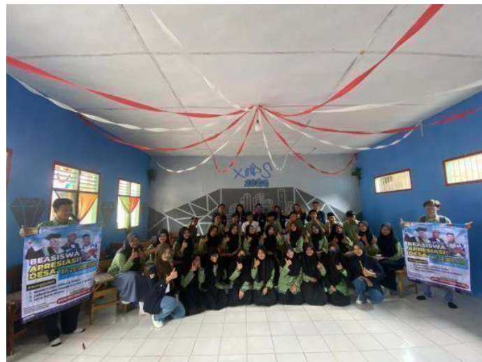
Gambar 2.13 Sosialisasi MA Nurul Falah