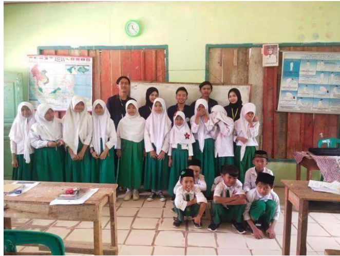
Gambar 2.12 Memberikan Materi di MI Nurul Falah