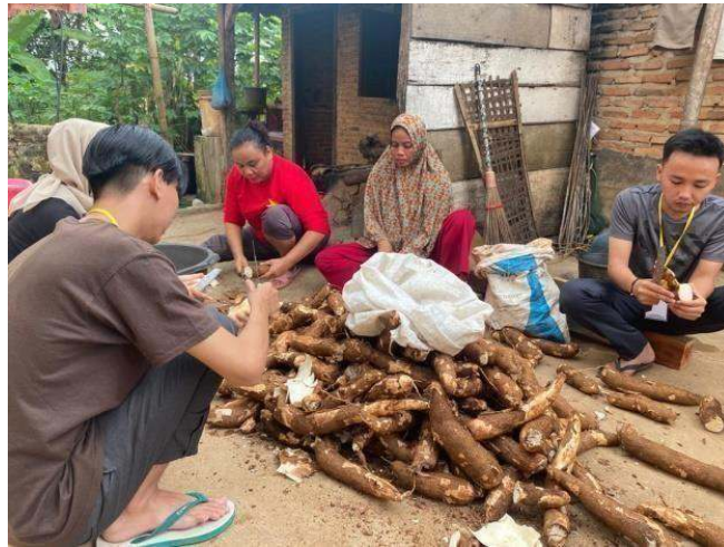
Gambar 2.4 Proses Pengupasan Singkong