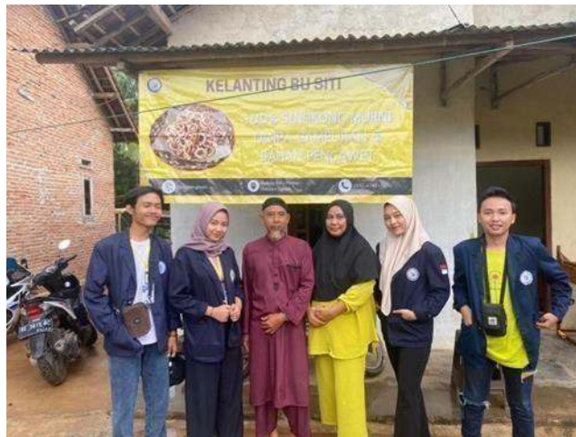
Gambar 2.7 Foto Dengan Mitra UMKM dan Banner Kelanting