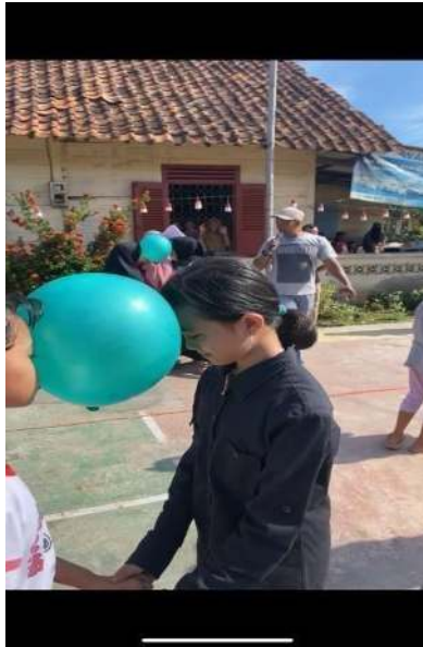
Gambar 2.10 Panitia Lomba 17 Agustus