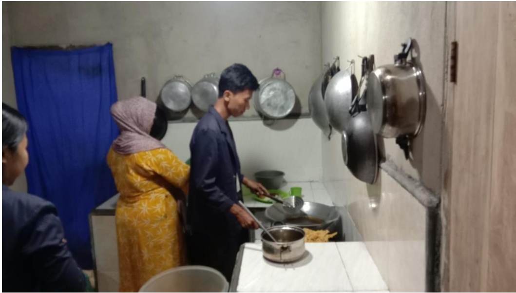
Gambar Pembuatan Peyek