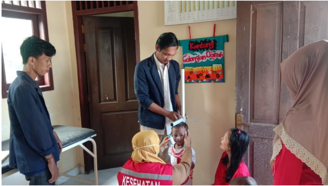
Gambar Kegiatan Posyandu Balita