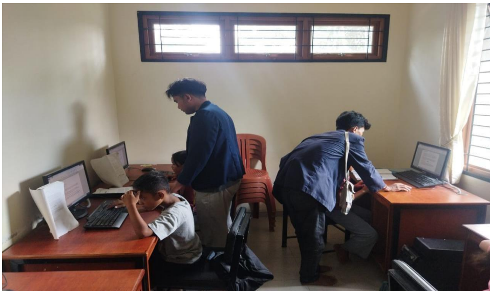
Gambar Mengajar Di Rumah Pintar