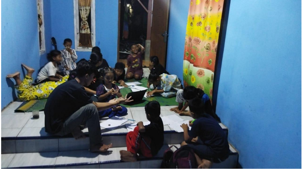
Gambar Memberi Jam Pelajaran Tambahan Di Posko PKPM