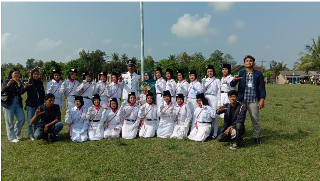
Gambar Bersama Petugas Paskibra HUT RI