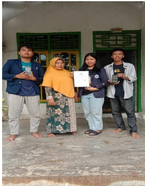
Gambar Penyerahan NIB (Nomor Induk Berusaha dan Memberi Materi Stroberi Kasir Kepada Pemilik UMKM