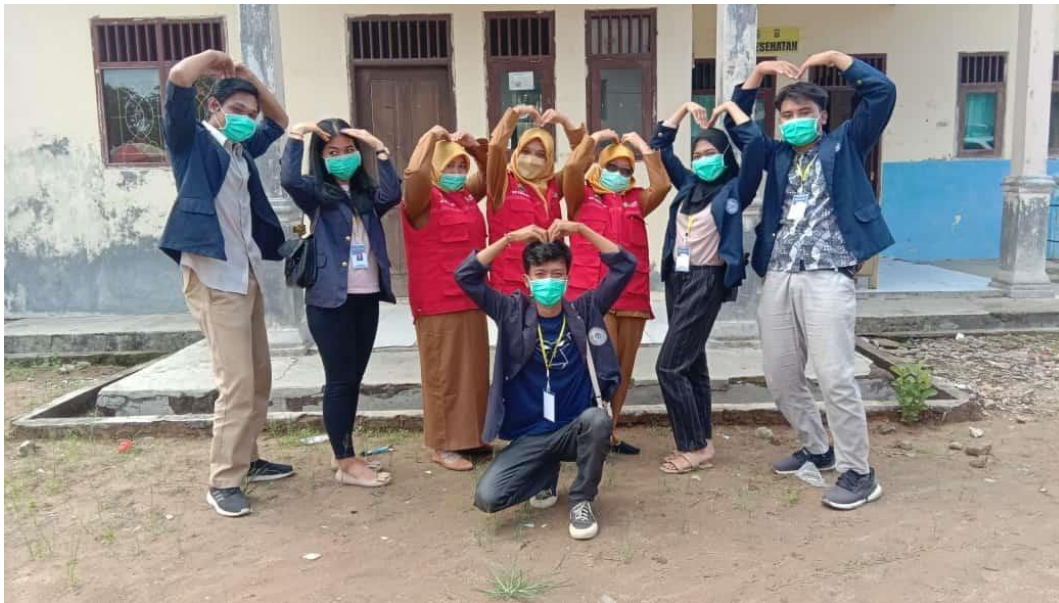
Gambar Bersama Bidan Desa Dalam Memberikan Penyuluhan Pencegahan Stunting