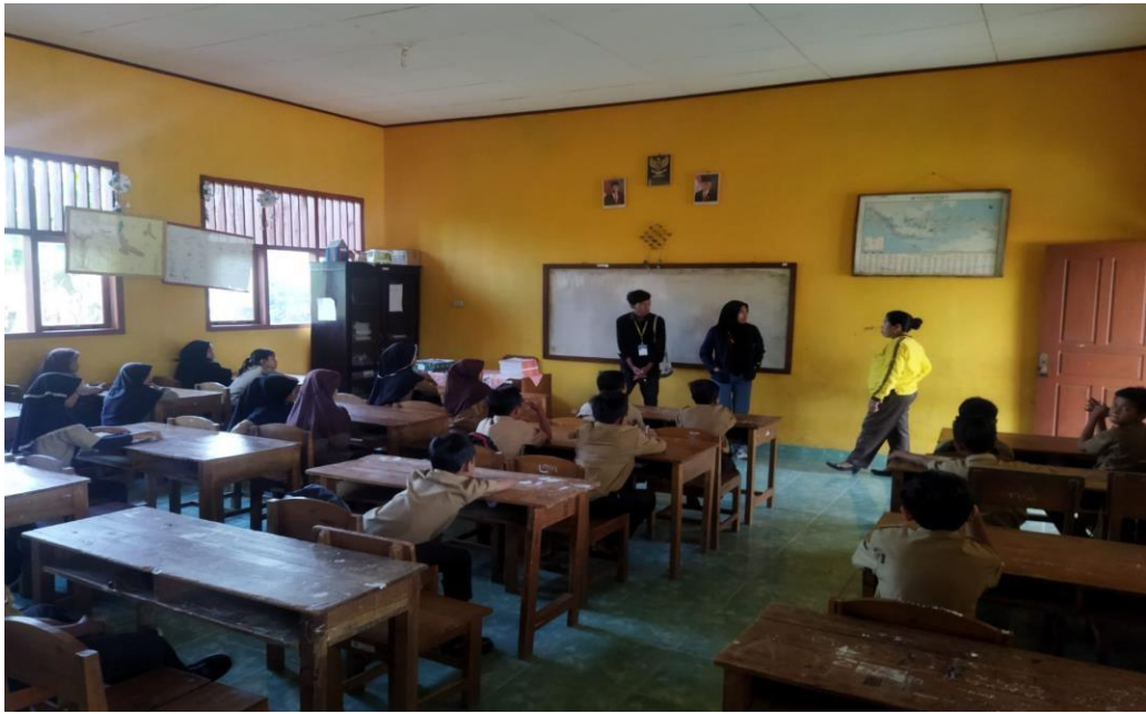
Gambar Memberikan Materi di Sekolah Dasar