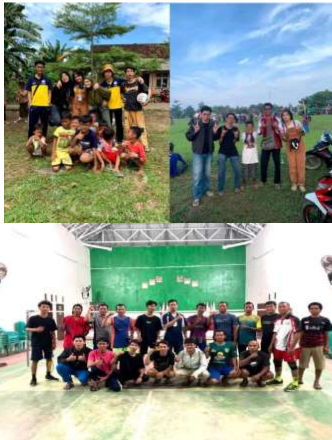
Gambar 2.3.11 Kegiatan 17 Agustus

Hasil kegiatan dari program kerja yang saya lakukan ini saya bisa menumbuhkan rasa nasionalisme dari masyarakat Desa Puwotani dari, anak-anak hingga anak remaja yang tadinya mereka tidak mengerti apa itu nasionalisme dan sekarang mereka bisa ikut serta dalam memperingati para Pahlawan yang gugur demi memerdekakan Indonesia, dari segi positif mereka yang tadinya di kampung mereka tidak aktif setelah ada ajakan dan pengetahuan yang saya berikan mereka menjadi aktif menjadi panitia hingga mewujudkan acara yang meriah sebagai bukti sikap nasionalisme mereka ada pada diri mereka.