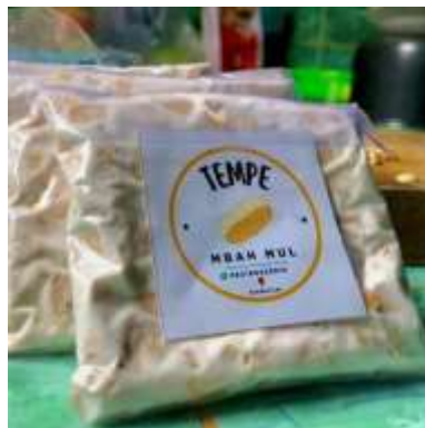
Gambar 2.3.8 Strategi Pemasaran Produk Tempe

Strategi pemasaran tempe yang dapat dilakukan adalah mempertahankan pasar yang sudah ada dan mencari pasar yang baru, mempertahankan mutu agar konsumen tetap memilih produk, serta mencari alternatif saluran pemasaran dengan menempelkan Brand Nama di Produk Tempe.