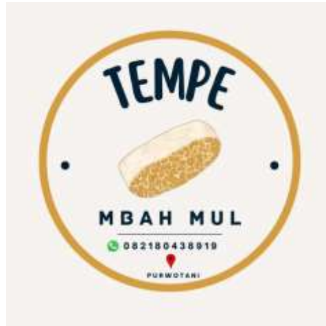
Gambar 2.3.7 Desain Branding Nama produk