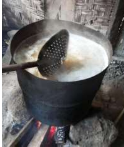
Gambar 2.3.4 Pengukusan Kedelai