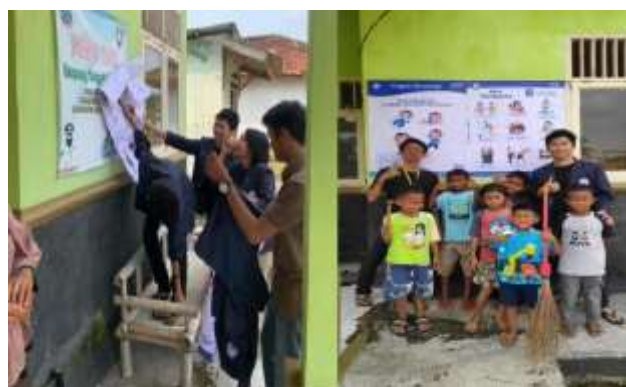
Gambar 2.3.14 Program Pemasangan Banner Stunting Dan PHBS

Hasil kegiatan dari program kerja yang telah saya lakukan ini yaitu saya dapat memberikan pengetahuan tentang stunting dan PHBS secara langsung guna menangulangi masalah kurangnya gizi dan pentngnya kebersihan bagi kesehatan