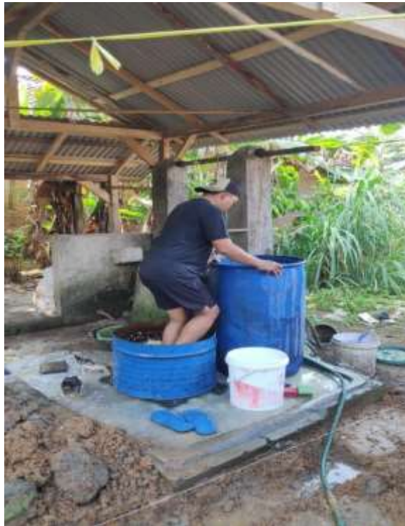
Gambar 2.3.2 Pengolahan Tempe

Mengolah Kedelai dan membersihkan kulit arinya hingga Terlepas. Kedelai yang sudah dipanen lalu dibersihkan dari kulit arinya, pembersihan ini dilakukan hingga tidak ada lagi kulit ari yang tersisa kemudian dicuci hingga bersih. Jika sudah dicuci dengan bersih, Kedelai di rendam lalu di rebus.