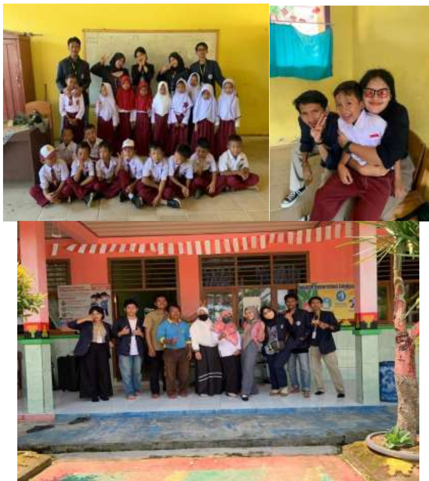
Gambar 2.3.13 Program Belajar Mengaja