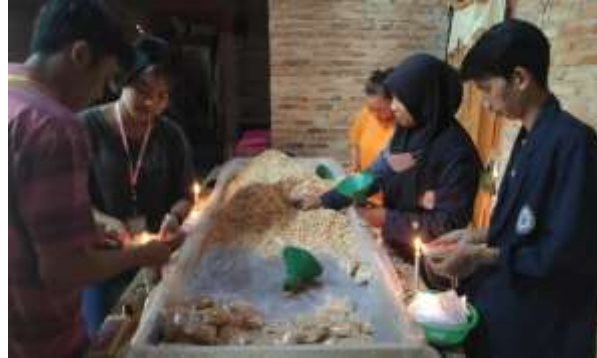
Gambar 2.3.6 Pengemasan Tempe

plastik dapat dilihat dari luar untuk melihat perubahan yang terjadi pada Tempe, pengemasan memastikan produk terbungkus seperti yang di butuhkan juga berfungsi untuk menjaga kualitas produk.