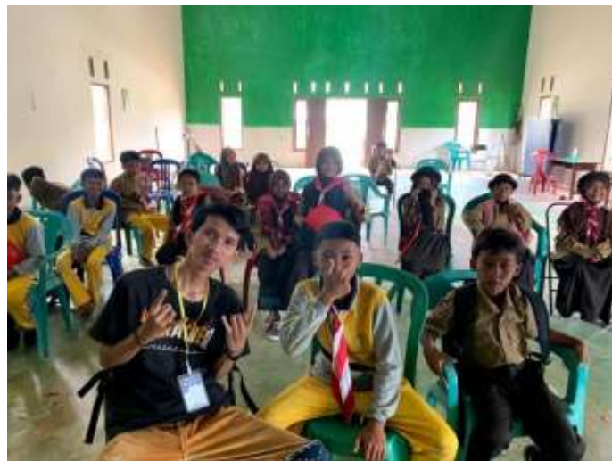
Gambar 2.3.10 Rapat Pembentukan Panitia 17 Agustus

Rapat pembentukan panitia 17 Agustus untuk menentukan panitia dan susunan acara pada hari kemerdekaan RI ke-77 dengan diadakan rapat agar acara dapat terlaksanakan dengan baik.