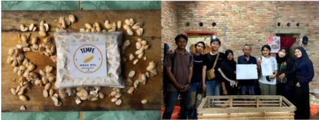
Gambar 2.3.9 Produk Tempe yang siap di pasarkan

itu. Oleh sebab itu, dibutuhkan keahlian khusus dalam menyusun rencana pemasaran sehingga dapat menghasilkan keuntungan besar.