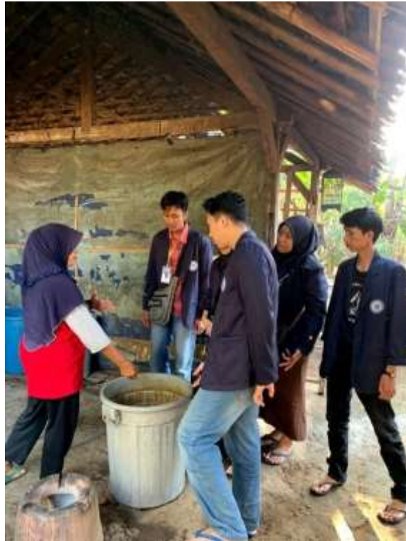
Gambar 2.3.1 Program Berkunjung Ke Ukm Tempe

Tujuan program berkunjung ke UMKM Tempe ini ialah untuk melihat bagaimana keadaan produksi Tempe dan bagaimana kondisi bahan baku Tempe.