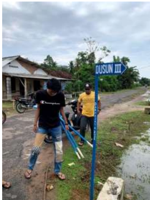
Gambar 2.3.15 Program Pembuatan Dan Pemasangan Papan Jalan