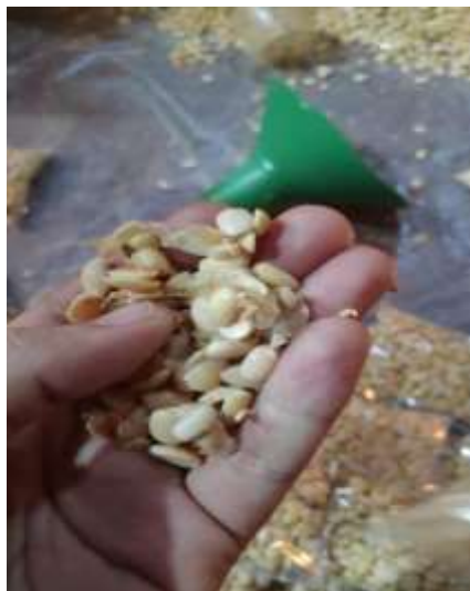
Gambar 2.3.5 Pemberian Ragi

Ragi tempe berfungsi sebagai agen mikroorganisme yang melakukan fermentasi pada kedelai. Ragi tempe juga membentuk tempe dengan benang-benang miselium yang terjalin menyelingkupi kedelai.