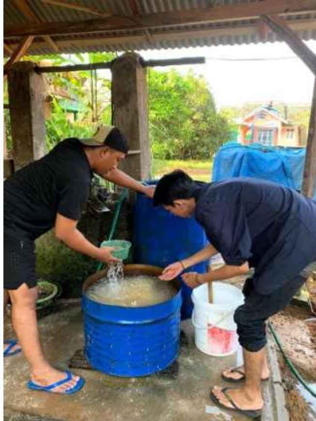
Gambar 2.3.3 Pencucian Kedelai

Produksi merupakan inti dari kegiatan usaha yang dilakukan oleh perusahaan, dengan harapan bahwa akan memberikan nilai tambah dari setiap produk yang di kelola menjadi Tempe. Salah satu proses produksinya yaitu Pencucian Tempe.