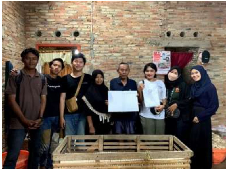
Penyerahan Surat Izin NIB Dan Branding Logo