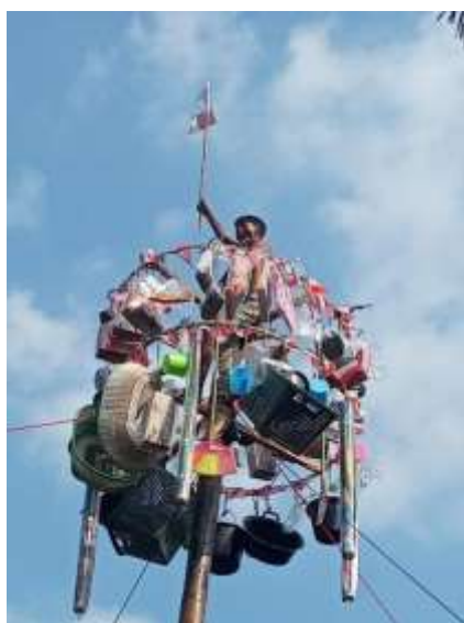
Program 17 Agustus