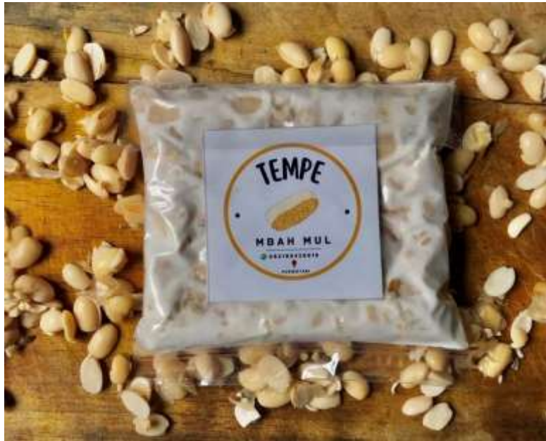
Tempe yang siap di pasarkan