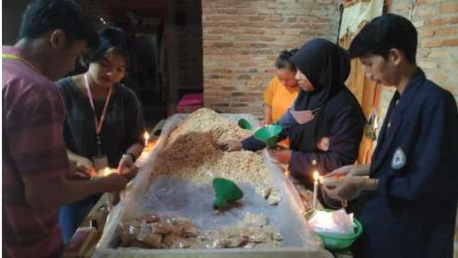
Membantu pengemasan tempe