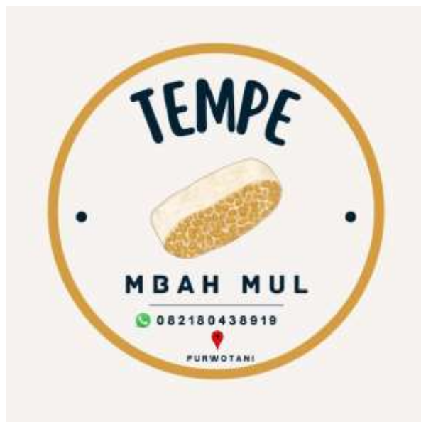
Brand Produk Tempe Mbah Mul