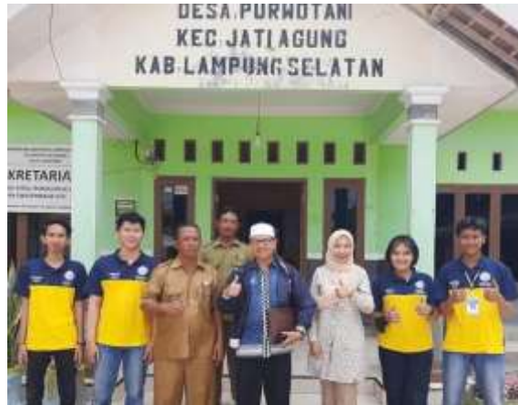
Penyerahan surat izin kepada Kepala Desa