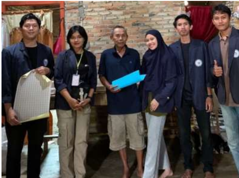
Penyerahan/kunjungan UMKM Tempe