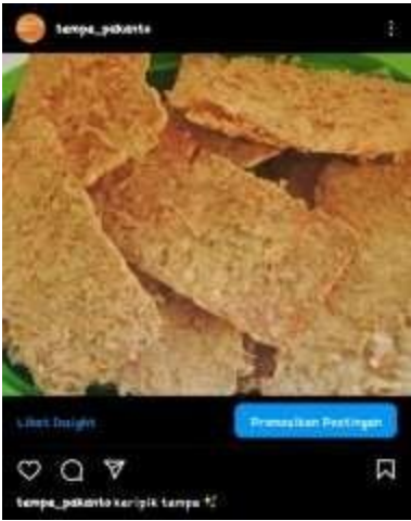
Gambar 6 Akun bisnis instagram