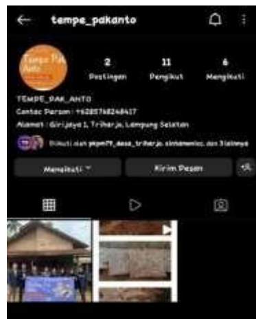
Gambar 2.5.3 Akun instagram Pak Pujianto

Selanjutnya saya membuka aplikasi instagram tersebut dengan membuat akun instagram terbaru terlebih dahulu,yang saya lakukan yaitu memberi nama pengguna pada instagram UMKM sebagai berikut