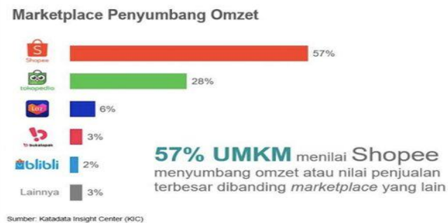
Gambar 2.1 Melakukan Pengenaln Potensi Pasar Online UMKM Milik Pujianto

Saya mengunjungi pemilik usaha UMKM tempe kemudian saya membantu proses pembuatan Tempe. Dan mengenali potensi dan inovasi prodak tempe yang sebelumnya melakukan olahan setengah jadi agara melakukan proses prodak yang lebih ekonomis agar lebih menguntungkan.