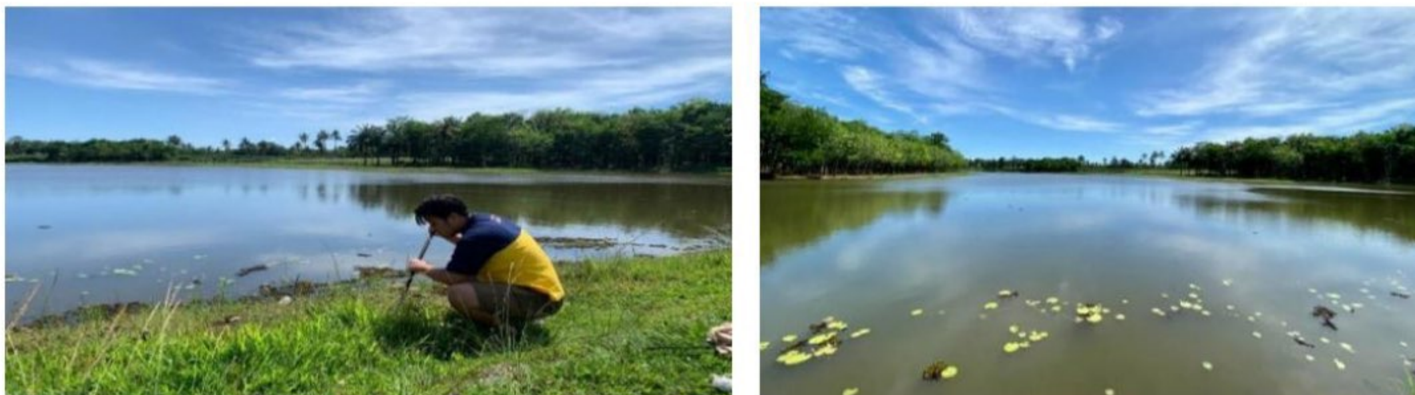
Gambar 2.1: Embung Umbul Slawe