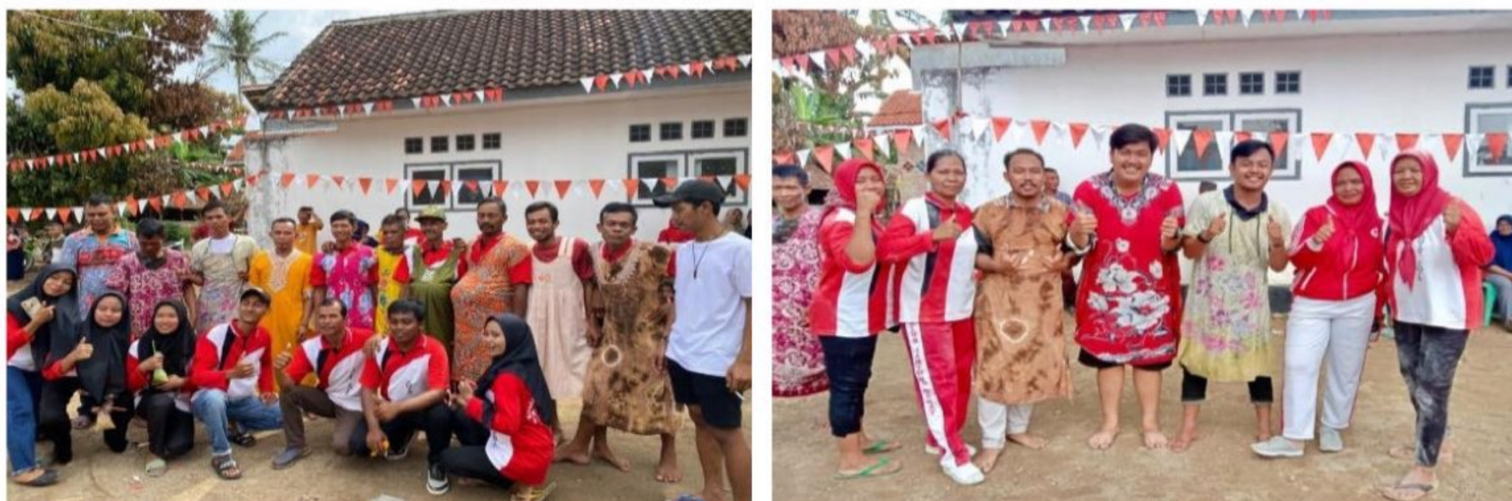
Gambar 2.8: Membantu Kegiatan 17 Agustus 1945 Desa Sidomukti.

Setiap Desa Pasti Memiliki Kegiatan Rutin Masing-Masing Dan Mungkin Berbeda, Seperti Hal Nya Kegiatan Rutin Aparat Desa Dalam Menyambut Bulan Muharram Atau Tahun Baru Islam. Dimana Kegiatan Ini Dihadirkan Oleh Seluruh Aparat Desa Dan Keluarganya, Serta Masyarakat Desa Sidomukti . Acara Pada Kegiatan Tersebut Ada Potong Tumpeng, Do'a Bersama Dan Makan Bersama Di Desa. Tujuannya Untuk Meningkatkan Tali Silaturahmi Antara Aparat Desa Dengan Masyarakat, Maupun Antar Masyarakat. Bukan Hanya Itu Saja Dengan Kegiatan Ini Dapat Mengingat Kita Mengenai Sejarah Nabi Memperjuang Agama Islam Ini, Dan Banyak Keutamaan Yang Didapatkan Pada Bulan Muharram Ini. Sedangkan Kegiatan Membantu Karang Taruna Dan Masyarakat Yaitu Ikut Serta Kepanitian Dalam Memperingati Hut Ri Ke-77 Desa Sidomukti . Dengan Begitu Mahasiswa Pkpm Dapat Menjalin Tali Silaturahmi Dengan Karang Taruna, Sehingga Bisa Berbagi Pengetahuan Dan Wawasan Yang Dipunya. Karna Ini Merupakan Kegiatan Rutin Yang Dilakukan Setiap Tahun Sekali, Maka Perlu Dilakukan Dengan Tujuan Meningkatkan Rasa Nasionalisme Pada Diri Masyarakat Desa Sidomukti Dan Mengingat Perjuangan Para Pahlawan Yang Telah Berjuang Untuk Indonesia Merdeka.