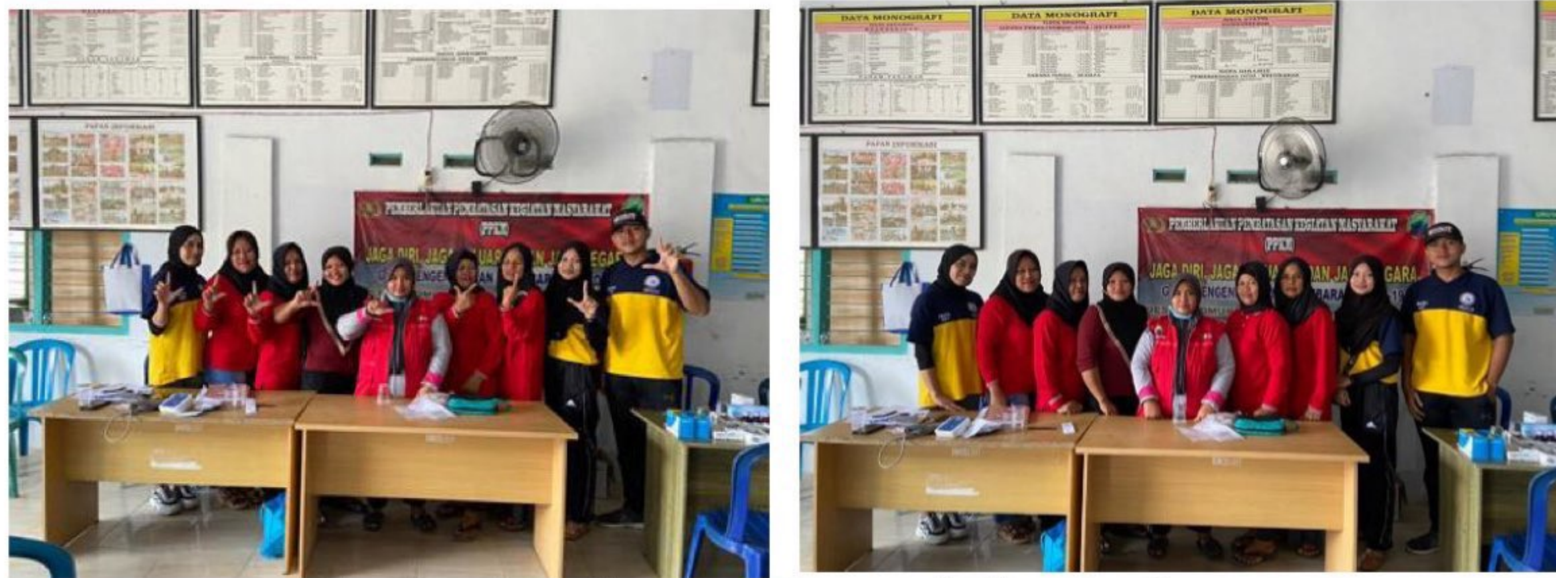
Gambar 2.3: Kegiatan Posyandu Lansia Ceria