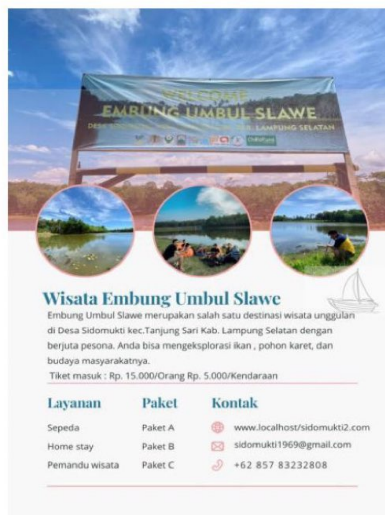
Gambar 2.7: Brosur Paket Wisata Embung Umbul Slawe