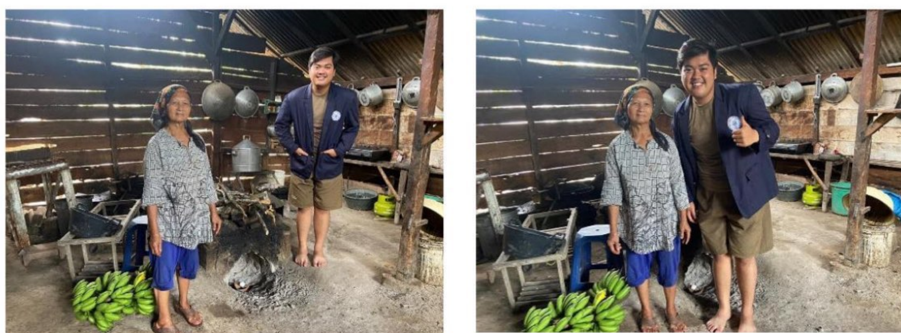
Gambar 2.5: Kunjungan Dan Membantu Proses Kegiatan Umkm

Di Desa Sidomukti Terdapat umkm Yaitu Umkm Tahu. Kami Melakukan Kunjungan Disatu Hari Sebelum Besok Tahunya Dipasarkan Dipasar. Bukan Hanya Melakukan Kunjungan Saja Namun Kami Membantu Juga Saat Proses Produksi, Seperti halnya Tahu Dengan Bahan Pokok Kedelai, Dari Proses Pembuatan Tahu Sebenarnya Ada Beberapa Yang Dapat Dijadikan Inovasi Baru Agar Lebih Bermanfaat Dengan Lebih Baik Lagi. Seperti halnya Tahu Dibuat Dari Sari Pati Kedelai, Nah Saat Proses Perebusan Kedelai Yang Telah Digiling Sebenarnya Airnya Dapat Dijadikan Sebagai Susu Kedelai. Dan Juga Limbah Dari Produksi Tahu (Limbah Kedelai) Bisa Dijadikan Produk Oncom Atau pun Pangan Ternak Yang Bergizi. Namun Karna Kurangnya Sdm (Sumber Daya Manusia) Umkm Tahu Hanya Membuat Tahu Nya Saja, Dan Menjadikan Limbah Kedelai Itu Pangan Ternaknya. Bahan Pokok Pembuatan Tahu Yaitu Dengan Menggunakan Kedelai Import, Karena Kedelai Lokal Kualitasnya Kurang Bagus Apabila Dijadikan Tahu Maupun Tempe.