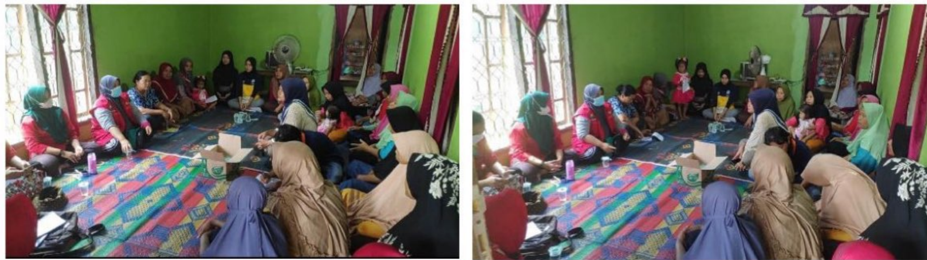
Gambar 2.4: Penyuluhan Parenting