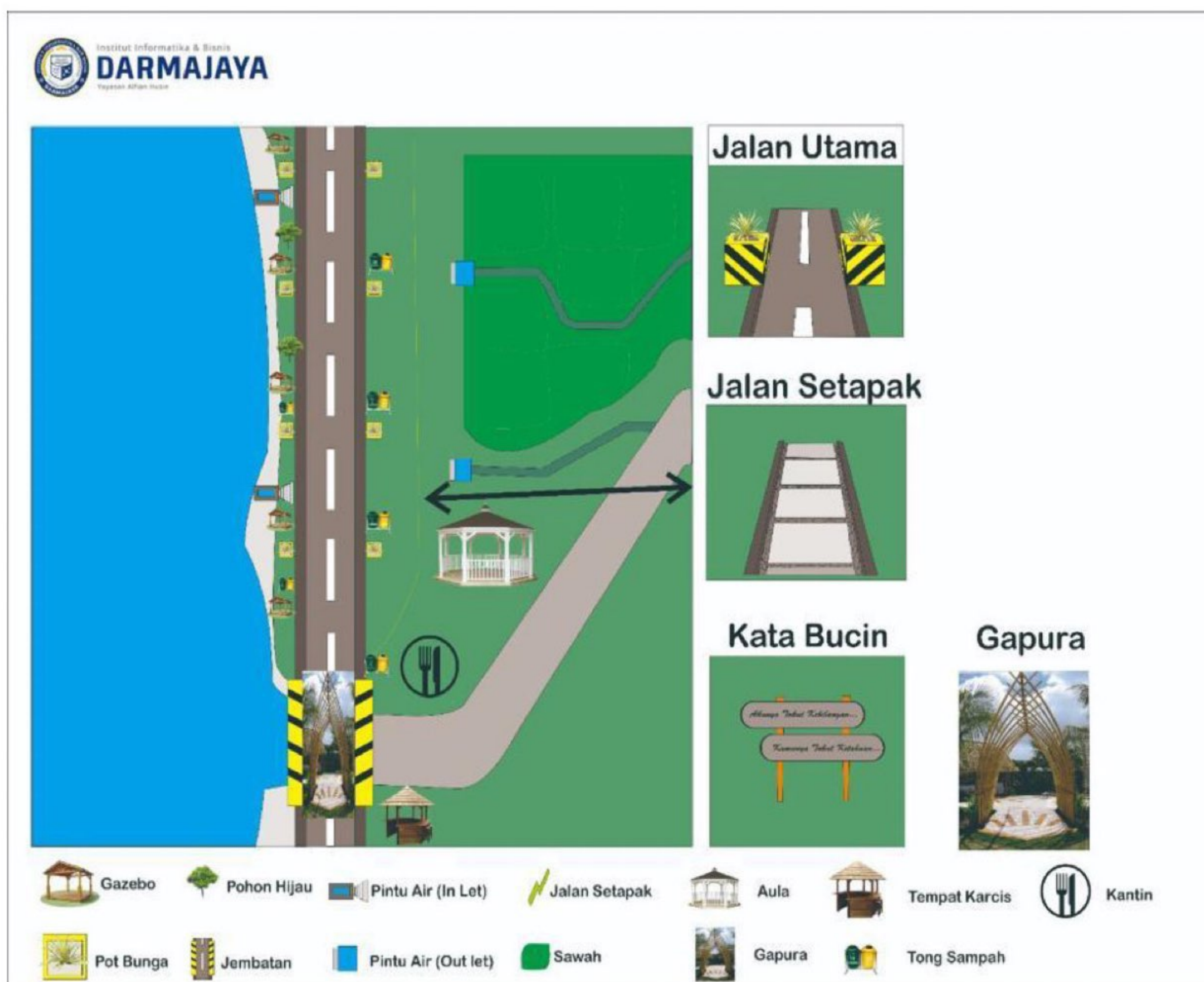
Gambar 2.6 : Gambar Mapping